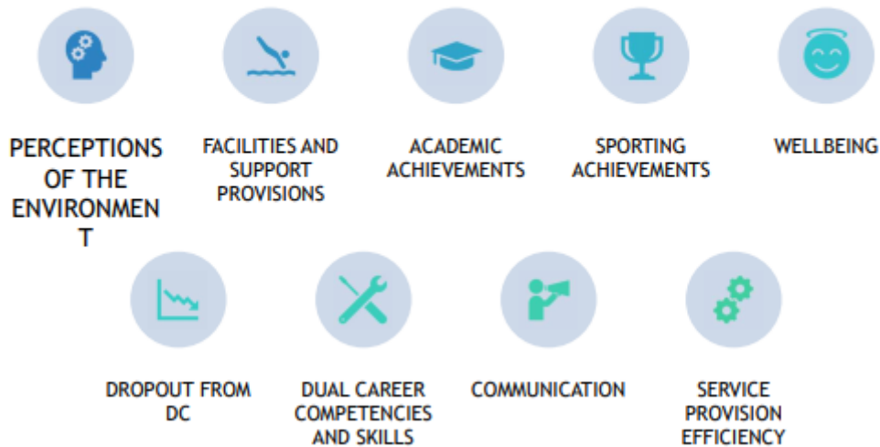
Figuur 3. Criteria to assess the effectiveness and efficiency of DCDEs (Liverpool John Moores University, 2019).

In dit onderzoek – naar de beleidsvoering van BVO's op het gebied van duale carrière – zal gekeken worden wat verschillende betrokken actoren nodig achten om een omgeving te creëren die bevorderend kan zijn voor het hebben van een duale carrière onder jeugdspelers. In dit onderzoek wordt voornamelijk ingezoomd op de criteria wellbeing, dropout from DC en dual career competencies and skills. Er zal uitgelicht worden in hoeverre de BVO'S spelers begeleiden om aan deze criteria te voldoen en hoe zij dat in de praktijk uitvoeren. Er zal onderzocht worden welke betekenis verschillende betrokken actoren geven aan deze omgeving en hoe dit verbeterd kan worden. Hierbij wordt gekeken naar een holistische ecologische benadering waarbij de aandacht verschuift van de individuele sporter naar de omgeving waarin de sporter zich bevindt.