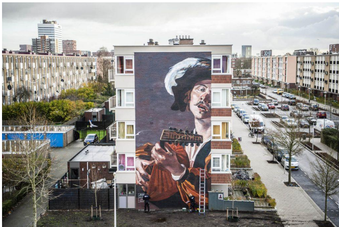
Afbeelding 1: Oosterbroek. R. (z.d.). Luitspeler van Dick van Baburen [foto]. Duic. https://www.duic.nl/cultuur/utrecht-op-weg-naar-inclusieve-culturele-metropool-wat-wordt-daarmee-bedoeld/

Een kwalitatief onderzoek naar de verwerking van het begrip inclusiviteit in de Cultuurnota 2021-2024 door de Gemeente Utrecht.