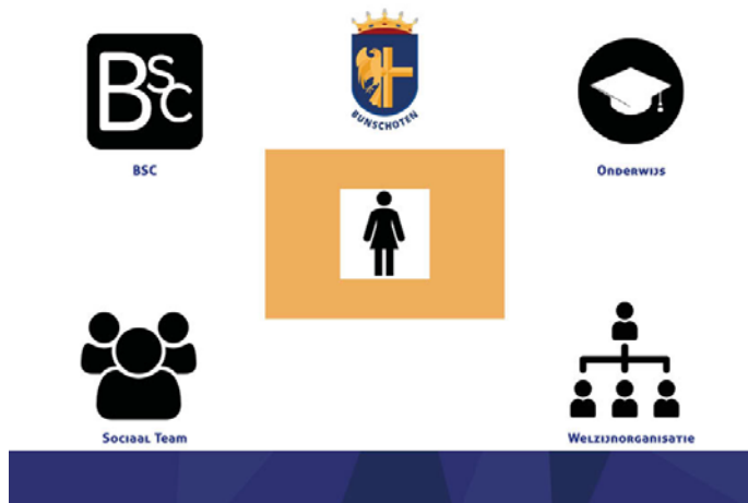
Figuur 2: Afbeelding focusgroep