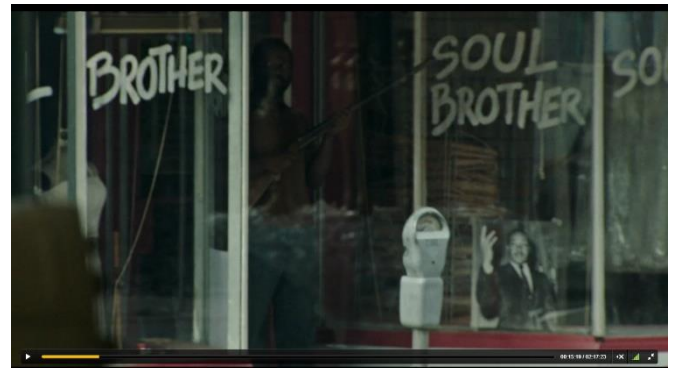
Scène 1, shot 12

opgesteld in een etalage. In deze shots geeft de film geeft de kijker cues dat de agenten de gekleurde bevolking in de gaten houden, maar dat de gekleurde bevolking hen ook in de gaten houdt. De combinatie van de opmerking van Demens met de shots van de twee gekleurde mannen, met nadruk op de man in shot 12, wekt bij de kijker de verwachting dat de gekleurde mensen inderdaad een aanval voorbereiden op de agenten. Doordat de agenten worden gefilmd alsof de kijker bij hen in de auto zit, wordt bij de kijker het proces van alignment gecued. Alignment is de tweede stap binnen Smiths structure of sympathy en beschrijft hoeveel toegang de kijker krijgt tot de gedachten en gevoelens van personages. 87 Doordat de kijker als het ware bij de agenten in de auto zit, wordt het gevoel van bedreiging bij de agenten kenbaar gemaakt aan de kijker. De agenten zitten dus in een tank die een hinderlaag in dreigt te rijden.