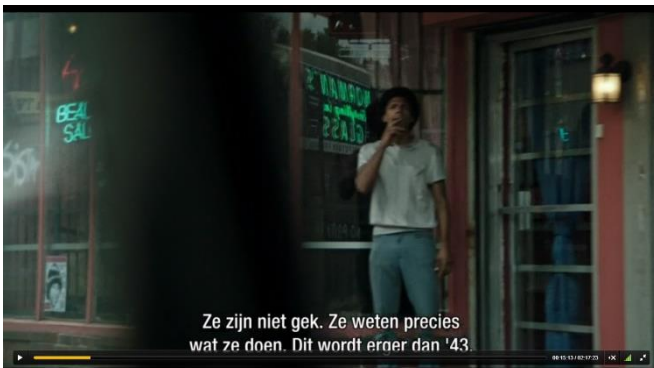
Scène 1,shot 9

Shot 9 is een shot vanuit het oogpunt van Demens. In dit shot is te zien dat een Afro-Amerikaanse man de auto inkijkt terwijl hij rokend voor een met graffiti beklad gebouw staat. De combinatie van deze shots insinueert dat de twee personen oogcontact met elkaar hebben. Shot 10 laat door de ruit van het bekladde gebouw zien hoe de rokende man met zijn hoofd de beweging van de auto volgt. Het elfde shot toont weer hoe de auto door de verwoeste stad rijdt. Het twaalfde shot toont een gekleurde man met een jachtgeweer die verdekt staat