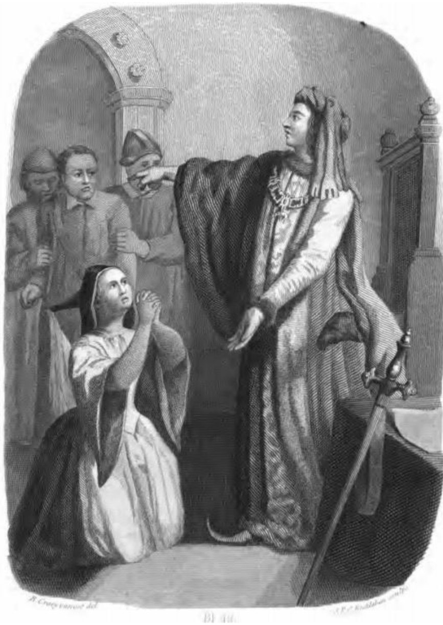
Afbeelding 3: De overgave van Jacoba van Beieren aan Filips de Goede, 1433. (Staalgravure uit Algemeene geschiedenis des vaderlands van de vroegste tijden tot op heden . Deel 2.3 door J.P. Arend, 1849. Maker onbekend.)