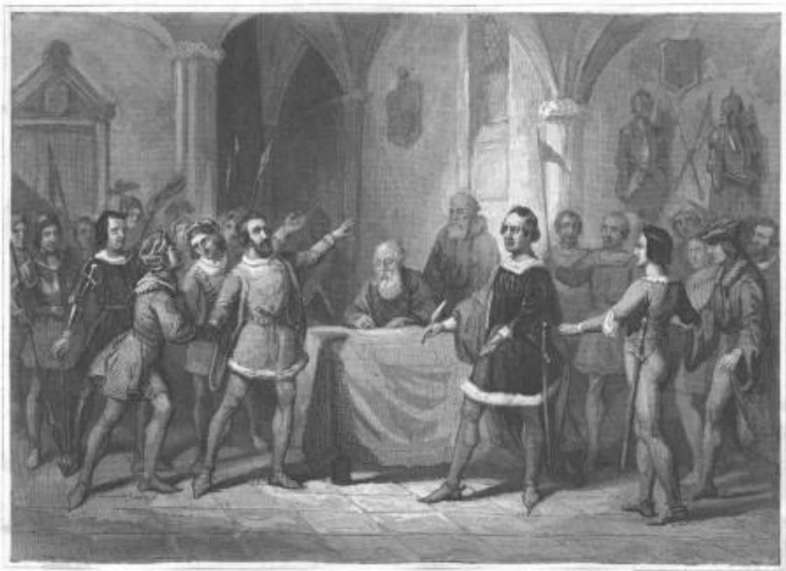
Afbeelding 2: Willem V sluit het Kabeljauwse verbond met de edelen en steden, 1350. (Staalgravure uit Algemeene geschiedenis des vaderlands van de vroegste tijden tot op heden . Deel 2.2 door J.P. Arend, 1846. Maker onbekend.)

hoofdstuk vergeleken worden met het populaire beeld dat Oltmans verspreidde met zijn roman. Samen moeten de twee hoofdstukken een algemeen beeld kunnen vormen over de manier waarop er in de negentiende eeuw tegen de laatmiddeleeuwse conflicten werd aangekeken en welke waarde deze hadden binnen het historisch besef in die tijd.