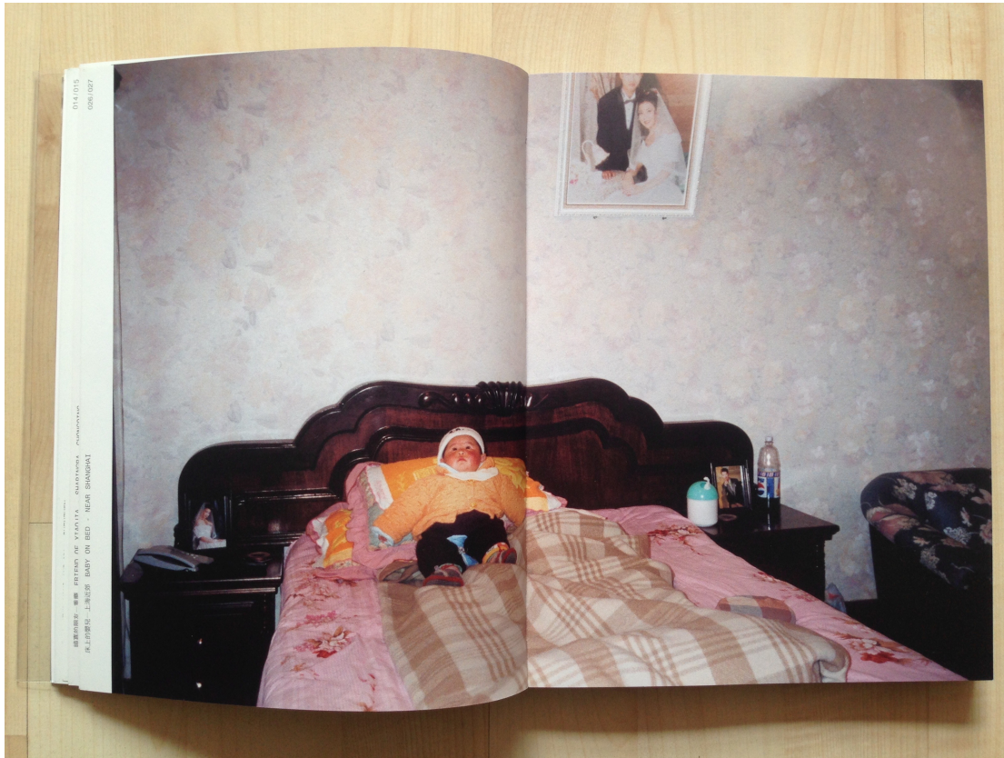
Afb. 5. Bertien van Manen, East wind, west wind , 2001, boek, 25,6 x 20 x 1,8 cm, pp. 26-27.