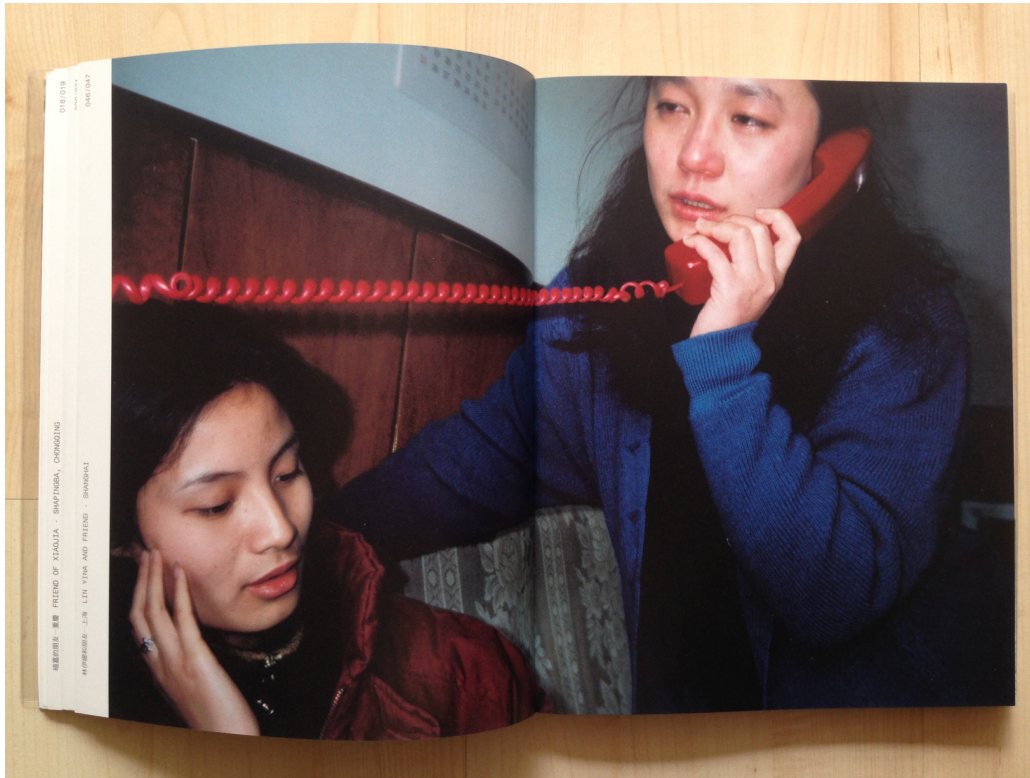
Afb. 3. Bertien van Manen, East wind, west wind , 2001, boek, 25,6 x 20 x 1,8 cm, pp. 46-47.