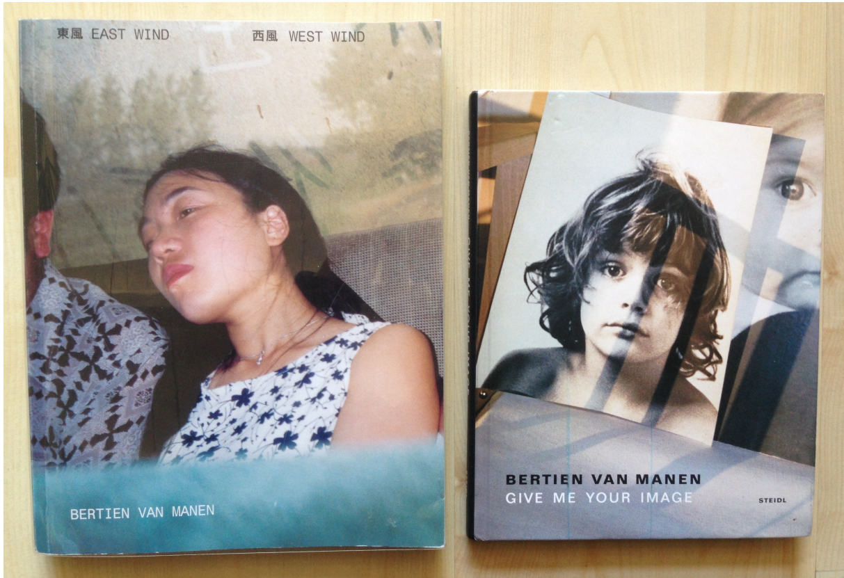
Afb. 1. Bertien van Manen, East wind, west wind (l), 2001, boek, 25,6 x 20 x 1,8 cm en Give me your image (r), 2006, boek, 22,5 x 17,6 x 1,6 cm.