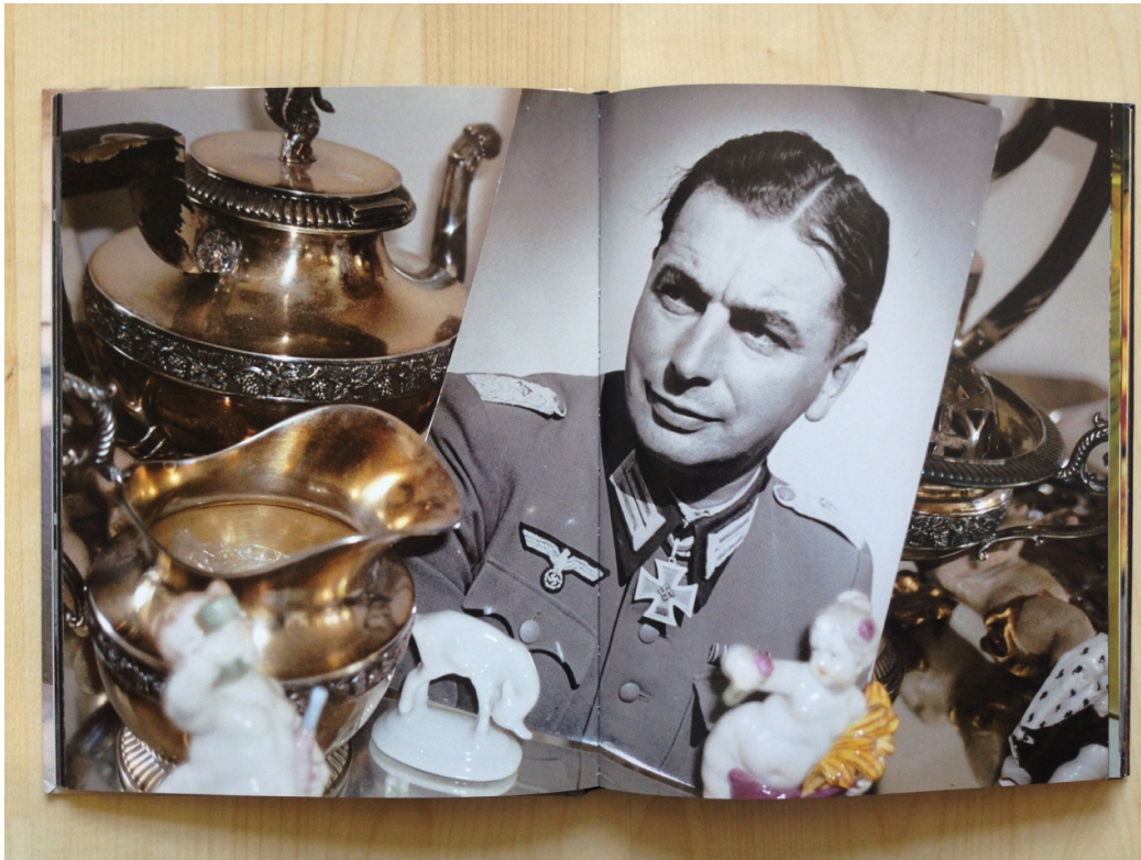
Afb. 7. Bertien van Manen, Give me your image , 2006, boek, 22,5 x 17,6 x 1,6 cm, ongepagineerd.