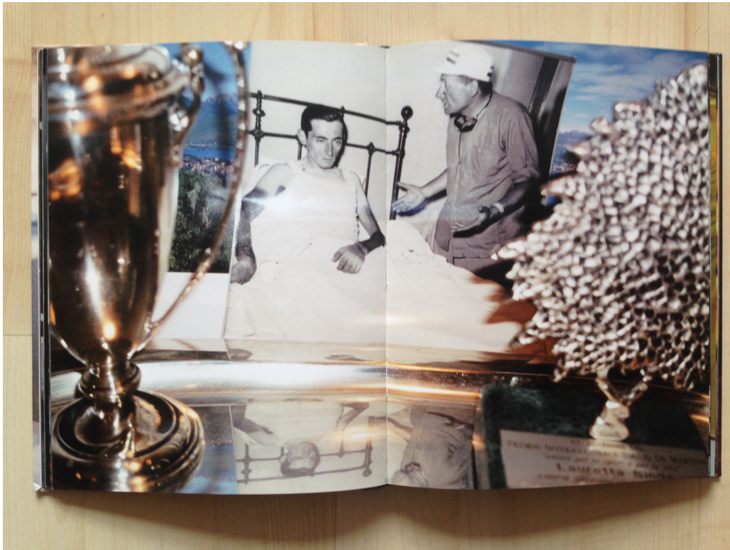
Afb. 9. Bertien van Manen, Give me your image , 2006, boek, 22,5 x 17,6 x 1,6 cm, ongepagineerd.