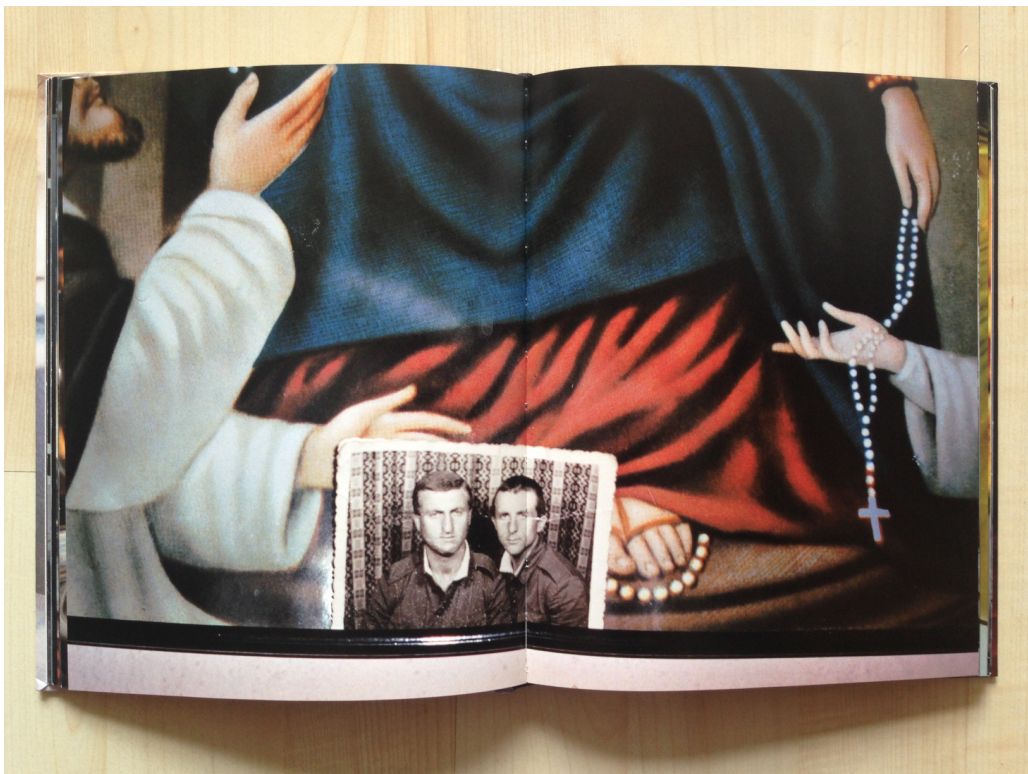
Afb. 10. Bertien van Manen, Give me your image , 2006, boek, 22,5 x 17,6 x 1,6 cm, ongepagineerd.