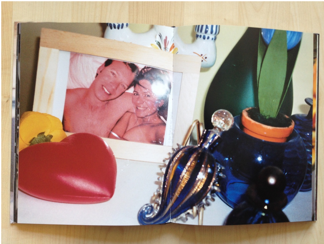
Afb. 8. Bertien van Manen, Give me your image , 2006, boek, 22,5 x 17,6 x 1,6 cm, ongepagineerd.