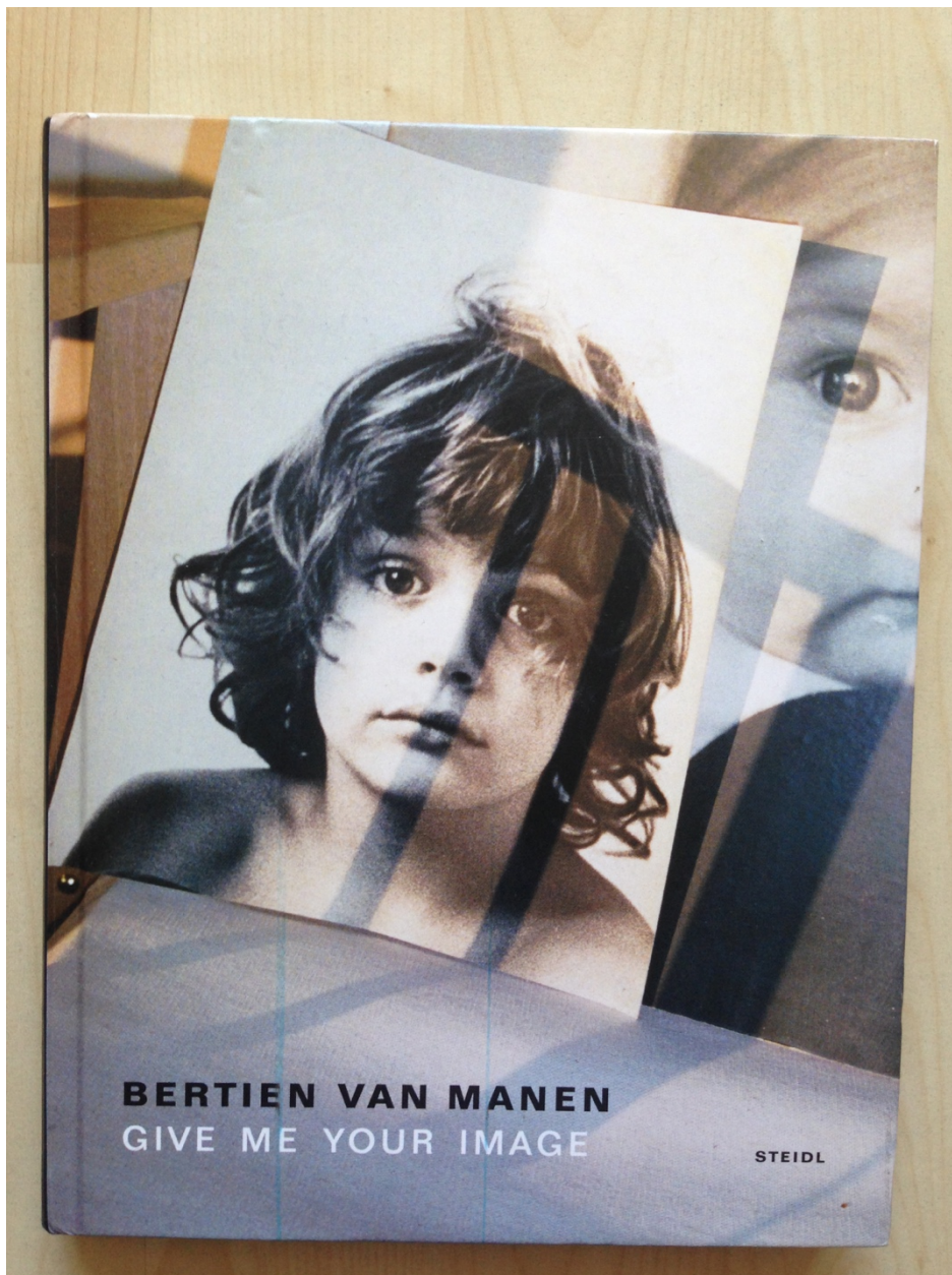
Afb. 6. Bertien van Manen, Give me your image , 2006, boek, 22,5 x 17,6 x 1,6 cm.