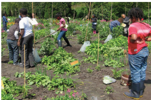
Figuur 3: Stadslandbouwinitiatief in Amsterdam. (Gemeente Amsterdam, 2015)

Een van de doelstellingen is om daarom om bewoners de ruimte te geven deze groene initiatieven te realiseren. Hiervoor worden kaders gesteld waarin (groene) initiatieven mogelijk zijn. Zo wordt onder andere de ‘Hoofdgroenstructuur’ vastgelegd waarin per type groen omschreven staat wat wel en niet kan. Daarnaast wordt er informatie op gemeentelijke websites geplaatst en worden belemmeringen door regelgevingen rondom voedsel en stadslandbouw waar mogelijk weggehaald. Tot slot bestaan er bij de gemeente (mede)beheer overeenkomsten in de groene ruimte (Gemeente Amsterdam, 2015).