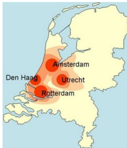
Figuur 2: Geografische ligging G4-gemeenten; (Van Amerom, 2016)

Groene burgerinitiatieven worden in de G4-gemeenten sterk gepromoot (Figuur 2). Ondanks dat deze gemeenten zich, sinds 2002, allemaal moeten houden aan de wet dualisme, waarbij burgers het recht hebben een initiatief op de agenda van de gemeenteraad te zetten, bestaan er onderlinge verschillen in de verwerkingen van initiatieven in hun beleidsvisies. Om een beeld te geven van het bestaande beleid in deze gemeenten, geeft dit hoofdstuk per gemeente een korte omschrijving van het beleid.