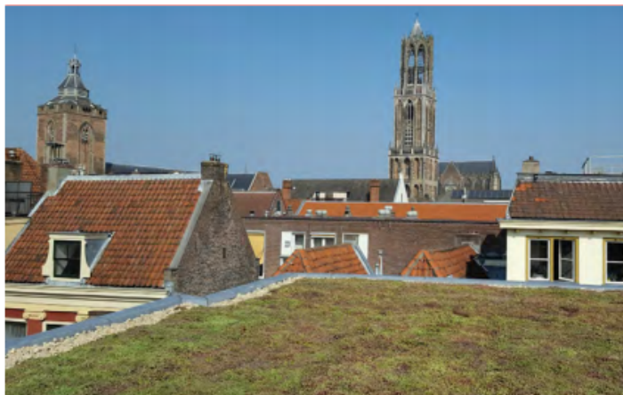
Figuur 6: Een initiatief voor een groen dak op de Springweg in de Binnenstad. (Gemeente Utrecht, 2018)

Ook Utrecht heeft in haar groenbeleid (Actualisatie groenstructuurplan Utrecht 2017-2030) aandacht voor de rol van groene burgerinitiatieven. Hierin schrijft de gemeente adequaat te reageren op groene initiatieven door deze te ondersteunen, kaders en randvoorwaarden te bieden en waar mogelijk drempels weg te halen. Ook in financiële zin worden sommige groene initiatieven ondersteund, zoals bijvoorbeeld stadslandbouw. Dit alles om zo een gezonde groene toekomst van Utrecht te creëren (Gemeente Utrecht, 2018).