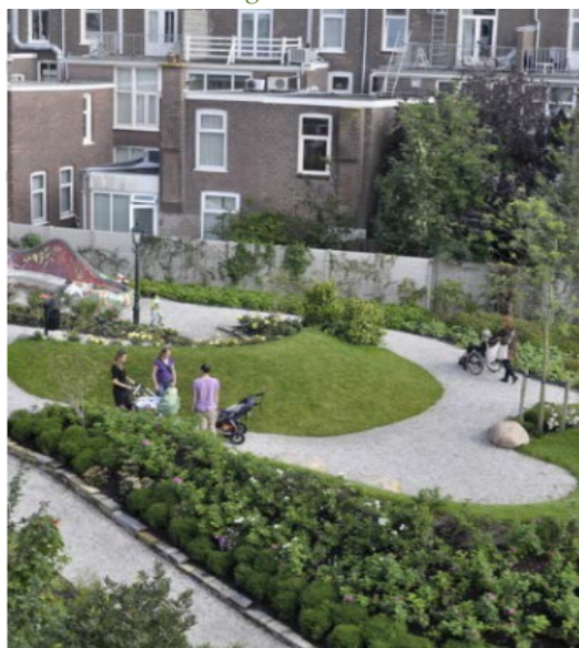
Figuur 5: Emma’s hof: Een stadstuin door een lokaal vergroeningsinitiatief (Gemeente Den Haag, 2016)

Waar in voorgaand beleid weinig ruimte was voor initiatieven en wensen, veranderde dit met de invoering van ‘Agenda voor Groen’ in 2016. In dit groenbeleid is veel aandacht voor het ondersteunen van groeninitiatieven. Hierbij wordt zowel ruimte aangeboden in de vorm van schooltuinen en pluktuinen, maar ook door heldere beleidskaders aan te geven over de mogelijkheden omtrent groene initiatieven. Ook stelt de Den Haag informatie en educatie beschikbaar over de mogelijkheden om zelf voedsel te verbouwen. Tot slot wordt groen waar mogelijk financieel ondersteund met behulp van het initiatievenbudget. Met dit beleid erkent de gemeente ook een nieuwe rol, waarbij zij initiatieven begeleiden met kaders, kennis, enthousiasme en soms met geld (Gemeente Den Haag, 2016).