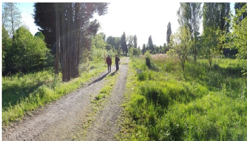
Figuur 4: Het Essenburgpark: Voorheen was dit een stuk onontwikkeld gebied in het centrum van Rotterdam. Nu wordt het ontwikkeld tot een multifunctioneel stadspark. (Hoeve, 2018)

Het beleid stelt verder dat overleggen tussen de interne organisatie, gebiedscommissies en wijkraden plaats moeten vinden om mogelijkheden voor groene initiatieven te bespreken. Hiervoor heeft de gemeente een budget van 12,5 miljoen gereserveerd om onder andere initiatieven verder te stimuleren. Dit alles om uiteindelijk de doelstelling van 20 hectare extra te behalen (Gemeente Rotterdam, 2019).