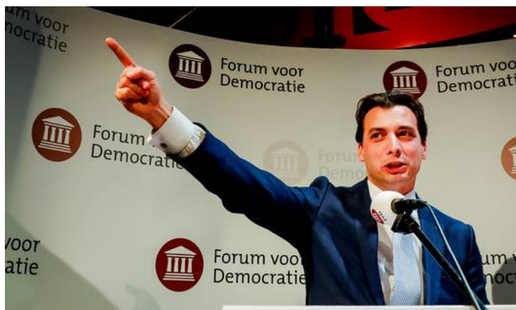
Thierry Baudet (1983-heden)