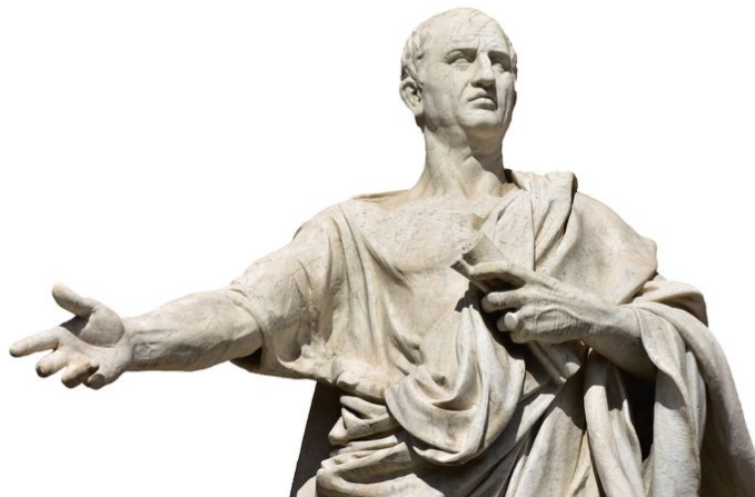
Cicero (106-43 v. Chr.)

Een functionele en retorische analyse van de overwinningsspeech van de politieke partij Forum voor Democratie na de Provinciale Statenverkiezingen van 20 maart 2019.