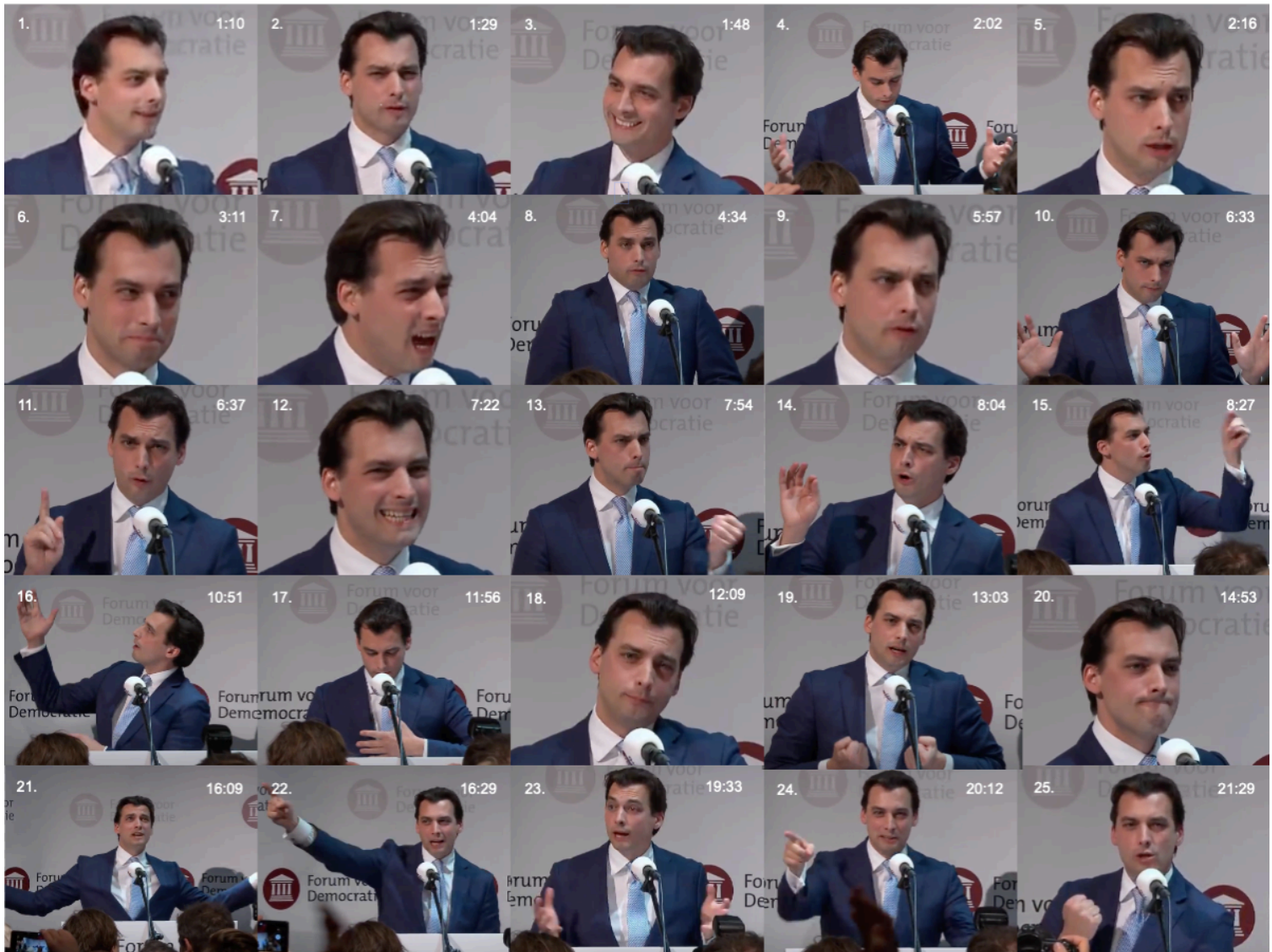
Figuur 3. Overzicht van verschillende gezichtsuitdrukkingen en handgebaren.

Zoals te zien is in bovenstaande figuur maakt Baudet tijdens het spreken gebruik van verscheidene handgebaren en gezichtsuitdrukkingen. Toch heeft Baudet tijdens zijn speech meestal een neutrale en ietwat ernstige blik, zoals te zien op afbeelding 5 in figuur 3. Het valt op dat vooral bij het aanzetten van woorden hij zijn wenkbrauwen wat optrekt en frons. Afbeelding 7 is daar een (overdreven) voorbeeld van. In bijna elke zin is er wel een aantal woorden die hij extra nadrukkelijk of wat luider uitspreekt. Tijdens het nadrukkelijk uitspreken van die woorden kijkt hij vrijwel altijd het publiek aan en maakt hij daarbij een handgebaar. Baudet kijkt sowieso veel het publiek in tijdens het spreken, hij kijkt naar links en naar rechts. Ook kijkt hij een aantal keer naar het publiek dat zich boven hem bevindt, zie afbeelding 16.