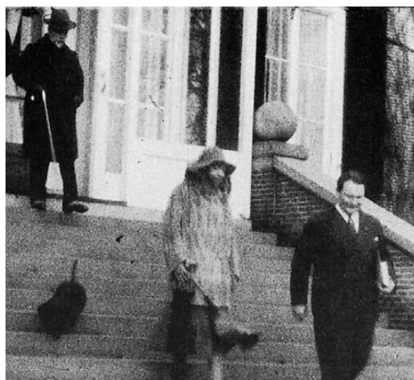
Figuur 5: Görings bezoek aan Huis Doorn in 1932