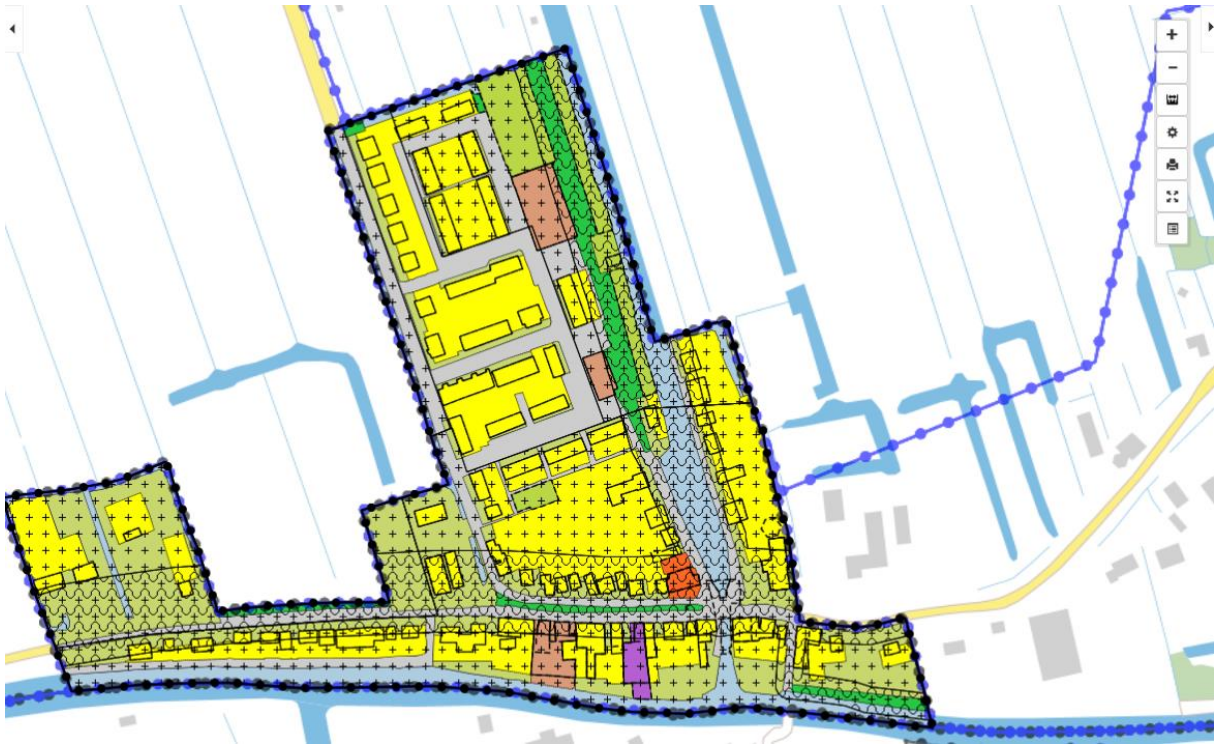
Figuur 1: bestemmingsplan Hekendorp.