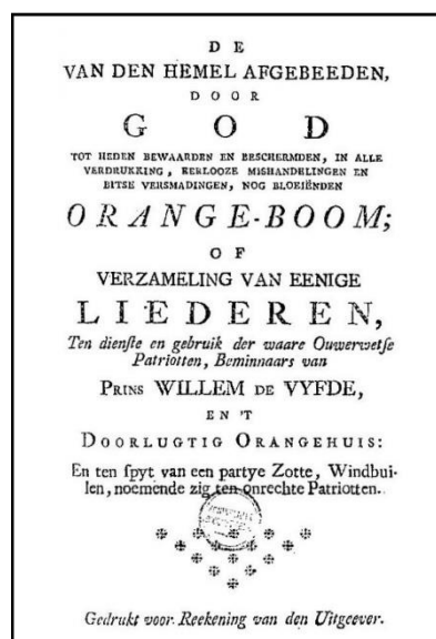
Afb. 1 Titelpagina Orange-boom (1786)

De periodisering van dit liedboek maakt het tot een interessant onderzoeksobject. Willem V was al enige tijd verdwenen uit het centrum van de macht en de Patriotten waren op hun hoogtepunt. De