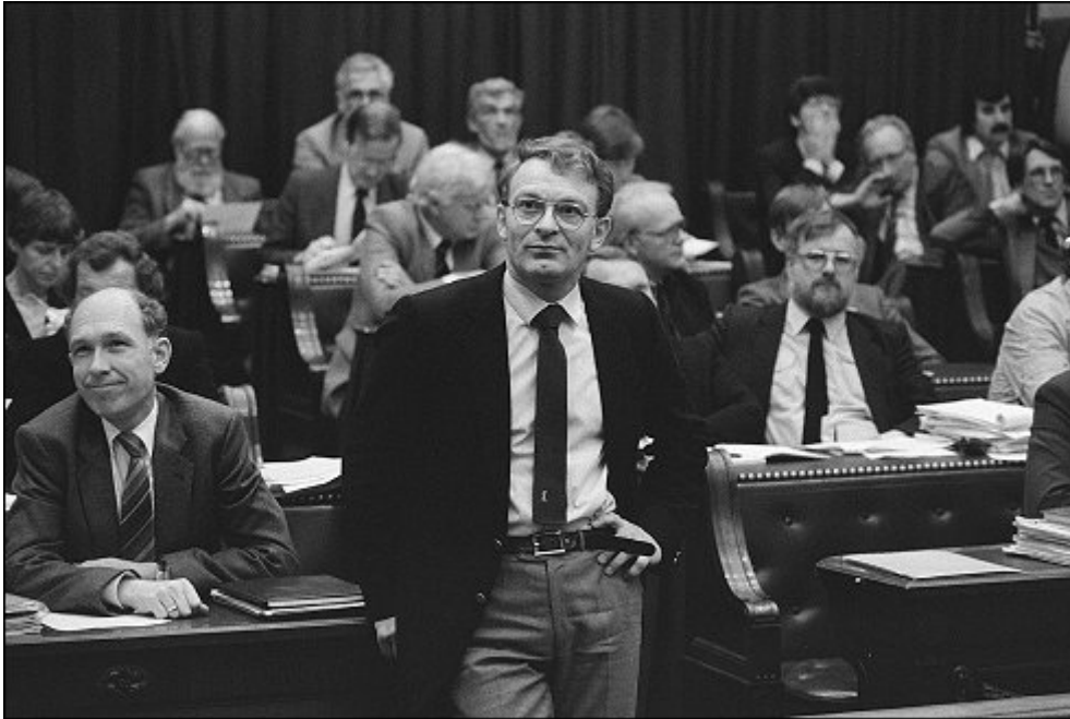
Hans Janmaat op 11 oktober 1983 in de Tweede Kamer

Een onderzoek naar de representatie van, en de reactie op de vreemdelingenhaat van Janmaat in de Tweede Kamer en de emotionalisering van de politiek tussen 1982-1984