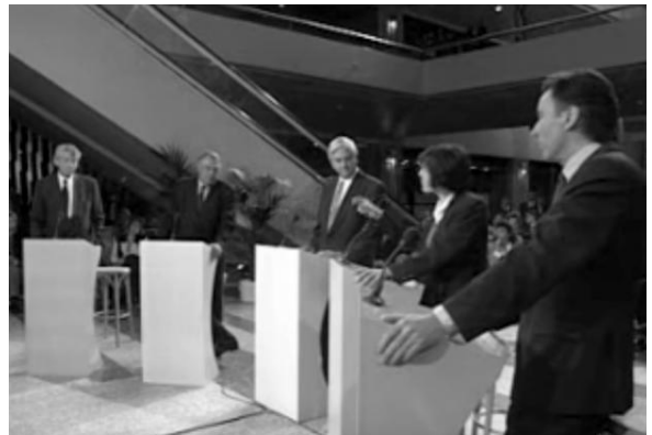
V.l.n.r. Wim Kok, Hans van Mierlo, Frits Bolkestein, Ina Brouwer, Eelco Brinkman