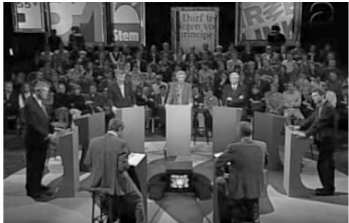
V.l.n.r. Wim Kok, Jaap de Hoop Scheffer, Els Borst, Frits Bolkestein, Paul Rosenmöller

In dit hoofdstuk analyseer ik het Grote Nationale Lijsttrekkersdebat van 5 mei 1998. 32 Het debat werd wederom geleid door Ferry Mingelen en Paul Witteman. Dezelfde vijf partijen deden mee als in 1994: Jaap de Hoop Scheffer van het CDA, Paul Rosenmöller van GroenLinks, Frits Bolkestein van de VVD, Els Borst van D66 en Wim Kok van de PvdA. Voor de verkiezingen was er een coalitieregering geweest van de PvdA, de VVD en D66; ook