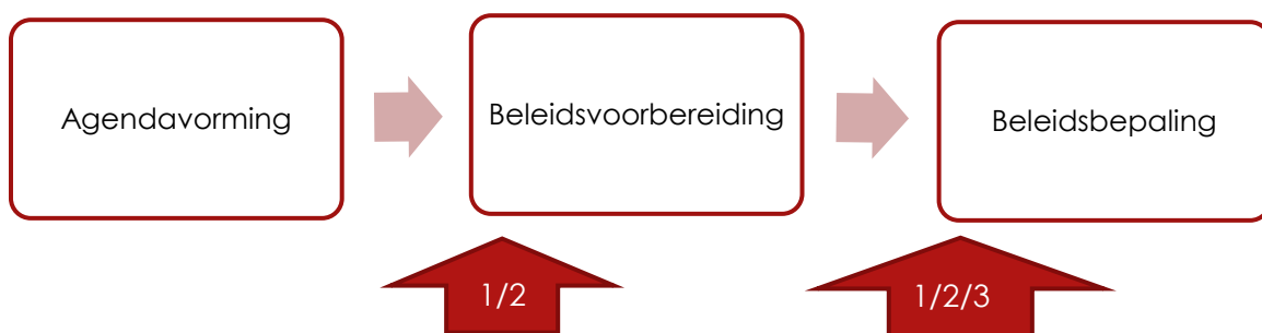
Figuur 3: Moment van Invloed territoriale raden B1 en B2

In het onderstaande figuur zijn de formele momenten van invloed weergegeven. Het OV is nummer 1, herstellen stuk historische stad nummer 2 en de ontsluitingsweg nummer 3.