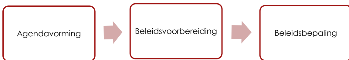
Figuur 1: Het beleidsproces (Woerdman, 2013: 46)

Na de agendavorming komt de beleidsvoorbereiding: In de beleidsvoorbereiding zoeken actoren naar een oplossing voor het probleem. Ook definiëren zij het probleem. Territoriale raden kunnen hier invloed hebben door zich te mengen in het aanreiken van oplossingen en het definiëren van het probleem. De beleidsbepaling is de volgende fase. Dit is de fase waarin het besluit valt. De invloed van territoriale raden is hier beperkt, omdat er al een plan ligt. Er wordt alleen nog geschaafd aan het voorliggende plan. Het gaat voornamelijk om de doelen, middelen en het tijdsplan van het voorliggende plan (Woerdman, 2013: 49; Bovens, 't Hart & van Twist, 2012: 81). De laatste fasen van het beleidsproces, beleidsuitvoering en beleidsevaluatie, vallen buiten dit onderzoek.