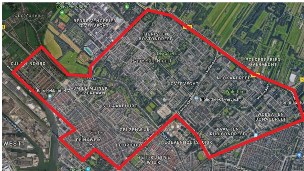
Figuur 3.1: Onderzoeksgebied Utrecht- Overvecht- en -Zuilen (GoogleMaps, 2019)

In deze paragraaf wordt eerst een gebiedsbeschrijving geven van Overvecht en vervolgens van Zuilen. Daarna worden er enkele cijfers weergegeven met betrekking tot de situatie in de wijk. De onderstaande kaart laat zien wat onderdeel uitmaakt van het onderzoeksgebied. Hierbij worden Ondiep, aangeduid met ‘Het Kleine Wijk’ en Bedrijfsgebied Overvecht niet meegenomen in het onderzoek.