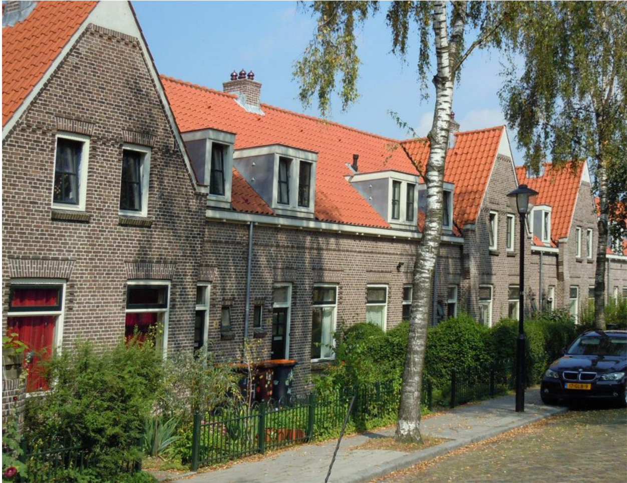
Figuur 3.3: De typische arbeidershuizen in Zuilen (Usine, 2019)