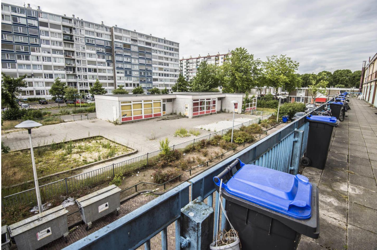
Figuur 3.2: Overvecht met hoogbouw- en laagbouw (DUIC, 2019)

De infrastructuur in de wijk is ook ruim opgezet, dit zorgt voor problemen zoals het moeilijk kunnen oversteken naar bepaalde delen van Overvecht, zoals het winkelcentrum in Overvecht. In Overvecht is er voldoende gelegenheid om het openbaar vervoer of de fiets te pakken naar het centrum van Utrecht (Gemeente Utrecht, 2015).