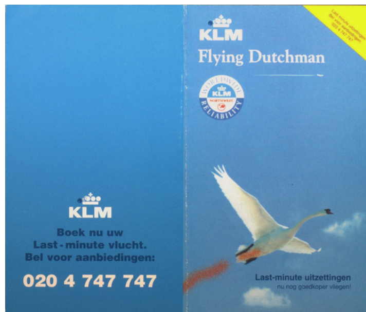
Figuur 3 en 4. Flyers van de acties tegen de betrokkenheid van KLM bij uitzettingen 109