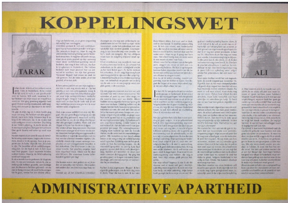
Figuur 1. Het vertellen van persoonlijke levensverhalen om de effecten van het beleid concreet te maken 94

De kraakbeweging maakte zich echter niet enkel hard voor de familie Gümüş: voor de groep witte illegalen in het algemeen werd fanatiek actie gevoerd, waarvan hoofdzakelijk manifestaties en demonstraties. Wat opvalt tijdens de analyse van de acties en strategieën, is de focus van de acties. Via vrijwel alle acties streefde de kraakbeweging ernaar – overeenkomstig met de focus van de acties voor de familie Gümüş – om de witte illegaal als menselijk en sympathiek te portretteren. De acties en strategieën van de kraakbeweging waren hoofdzakelijk gericht op het zichtbaar maken van de witte illegalen. Zij wilden hen uit de anonimiteit halen: de witte illegaal moest een gezicht krijgen om op deze wijze empathie en solidariteit op te wekken bij het grotere publiek. Door het verwerven van een zo groot mogelijke achterban