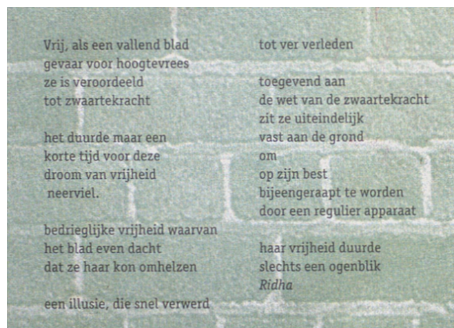
Figuur 2. Gedicht geschreven door witte illegaal Ridha 99

Daarnaast werd er veelvuldig gebruik gemaakt van culturele strategieën om een emotionele, betrokken reactie teweeg te brengen. Zo staat in bijna elke informatieve uitgave wel een gedicht, en werd ook kunst, muziek en toneel ingezet om mensen te inspireren tegen de Koppelingswet te strijden. 97 Tevens maakte de kraakbeweging intensief gebruik van de culturele strategie waarbij ze het discours trachtten te veranderen: ze wilden van de terminologie ‘illegaal(liteit)’ af. 98 Door de nadruk te leggen op het discours poogden ze de groep uit de ‘illegaliteit’ te halen en het proces van illegalisering te beïnvloeden. Deze culturele strategieën spelen bewust in op de emotionele kant van het migratiebeleid. Deze focus op het creëren van een zo groot mogelijke achterban, waarmee zij via buitenparlementaire acties trachtten invloed uit te oefenen op de reguliere politiek, is een klassiek kenmerk van een sociale beweging: de kraakbeweging trachtte met deze acties de regering te dwingen de slachtoffers van de Koppelingswet alsnog te legaliseren.