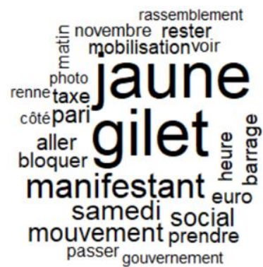
Les 25 mots les plus utilisés dans les articles de Libération

De plus, Le Figaro a cité surtout les politiciens dans les articles comme Christophe Castaner, le Ministre de l'Intérieur, ce qu'on retrouve dans notre analyse quantitative. Les mots « ministre » et « intérieur » sont utilisés respectivement 29 (12 ème place) et 23 fois (22 ème place). Dans 20 cas, le mot « ministre » est utilisé ensemble avec « intérieur ». En d'autres mots, le Ministre de l'Intérieur est mentionné vingt fois dans les articles du Figaro . De plus, le mot « gouvernement » se trouve sur la 8 ème place de notre liste et est utilisé 42 fois. En étudiant le lexique de Libération , il est clair que Libération prête moins d'attention au pouvoir en place que Le Figaro l'a fait. Le mot « gouvernement » se trouve sur la 22 ème place et n'est qu'utilisé 16 fois. Le mot « ministre