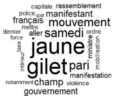
Les 25 mots les plus utilisés dans les articles du Figaro