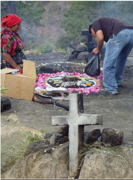
Een stel dat een offer ritueel uitvoert bij Paxcual Ab'aj in Chichicastenango