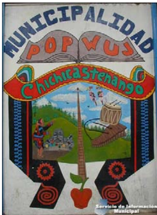
Het wapen van Chichicastenango

De volledige naam van het dorp is Santo Tomás Chichicastenango en het heeft 101,864 inwoners. Guatemala heeft 22 dialecten naast het Spaans. In Chichicastenango spreekt 93% van de bevolking Ki'che en maar 7% Spaans. Chichicastenango is een dorp waarvan 95% van de bevolking zich inheems beschouwd en maar 5% niet-inheems. Van deze bevolking woont 85% in de 80 buitenwijken die het dorp rijk is en heeft een agrarische leefstijl. Vaak woont men met meerder families in één huis. Agricultuur en handel zijn de twee belangrijkste vormen van bestaan. De markt wordt gezien als een van de belangrijkste en kleurrijkste van de regio. De verdeling van religie is als volgt: 45% van de bevolking is Evangelisch, 39% is Katholiek en 11% beoefend een Maya spiritualiteit ( http://www.inforpressca.com/chichicastenango 24-06-2009).