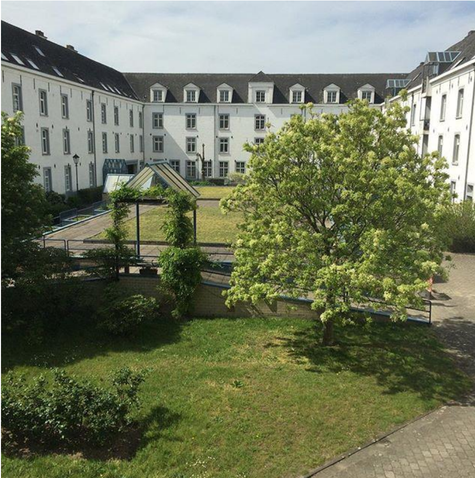
Afbeelding 1: Zicht op de binnenkoer van de voormalige kazerne. In de vertrekken zijn woonappartementen gebouwd en op de binnenkoer zelf is een hofje ingericht.