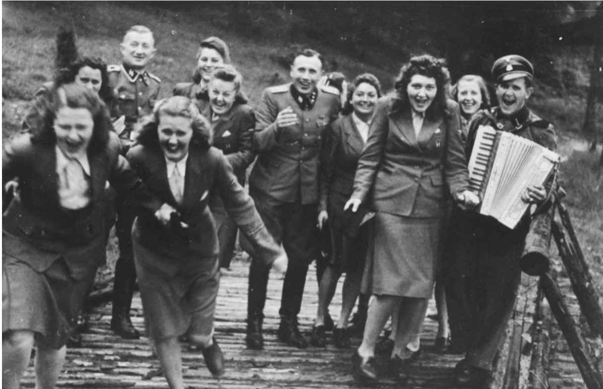
Afbeelding 4: 1 juli 1944, Foto uit het Höcker album. Deze foto wordt met andere foto's uit het fotoalbum getoond door Kazerne Dossin. Bijschrift in de catalogus van Kazerne Dossin luidt: 'Naziofficieren samen met SS-Helferinnen, die in Auschwitz-Birkenau instonden voor de communicatie. In het midden tussen de 'helpsters' staat Karl Höcker, aan wie het fotoalbum toebehoorde' 154.

Veelzeggend zijn ook de cijfers uit het jaarverslag van 2018 over het aantal lezingen, lessen en vormingen die de medewerkers van Kazerne Dossin gaven. 155 Als je kijkt naar de onderwerpen is te zien dat veruit de meest besproken thema's polarisatie en dadergedrag zijn: