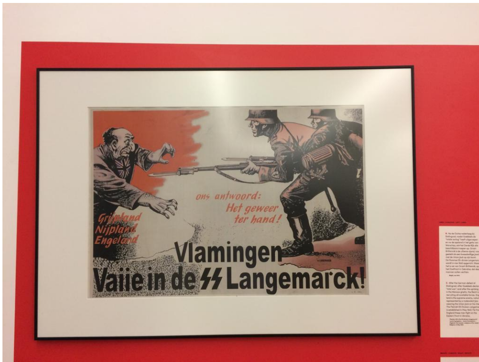
Afbeelding 3: 24 januari 2019, Propagandaposter voor de SS-Langemarck getoond door Kazerne Dossin.

Een gehele wand van het museum staat in het teken van het daderperspectief. Het museum laat hier foto's zien uit het Höcker album. De foto's van de nazi-officieren die werkzaam waren in Auschwitz-Birkenau laten hen alleen zien tijdens vrolijke uitstapjes en officiële momenten. Niets van de gruwelijke werkelijkheid die zich afspeelde in het kamp is te zien. Afbeelding 3 toont een van de foto's die Kazerne Dossin opgenomen heeft in de permanente tentoonstelling. Rob van der Laarse maakt uit de wereldwijde impact van deze foto's op dat er een perspectiefwisseling plaatsvindt waarbij de behoefte groeit om ook het perspectief van de daders in ogenschouw te nemen bij het vertellen van het verhaal van de oorlog. 153