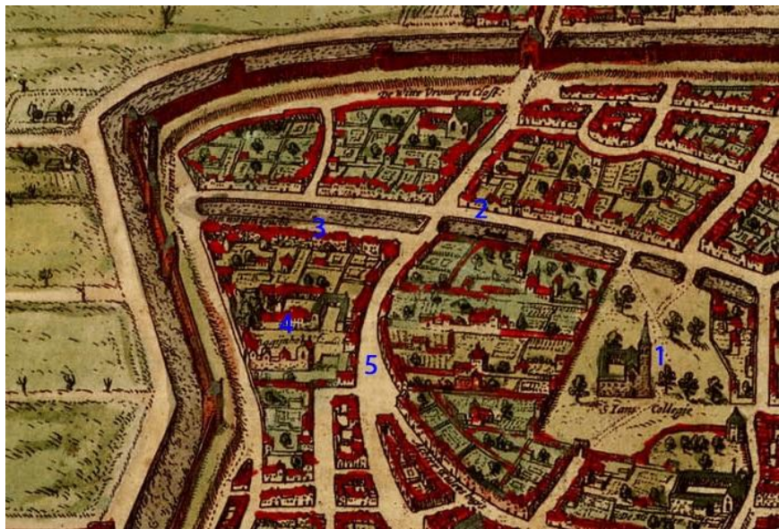
Figuur 2 Deel van een stadsplattegrond van Utrecht uit circa 1572

Wijde Begijnestraat. De oplettende lezer van deze scriptie zal correct geconcludeerd hebben dat dit de plek is waar het begijnhof in de stad Utrecht lag. Op de hiernaast weergegeven afbeelding van Utrecht rond 1572 is goed te zien hoe het begijnhof zich bevond in het stratenplan. 94 Het hof