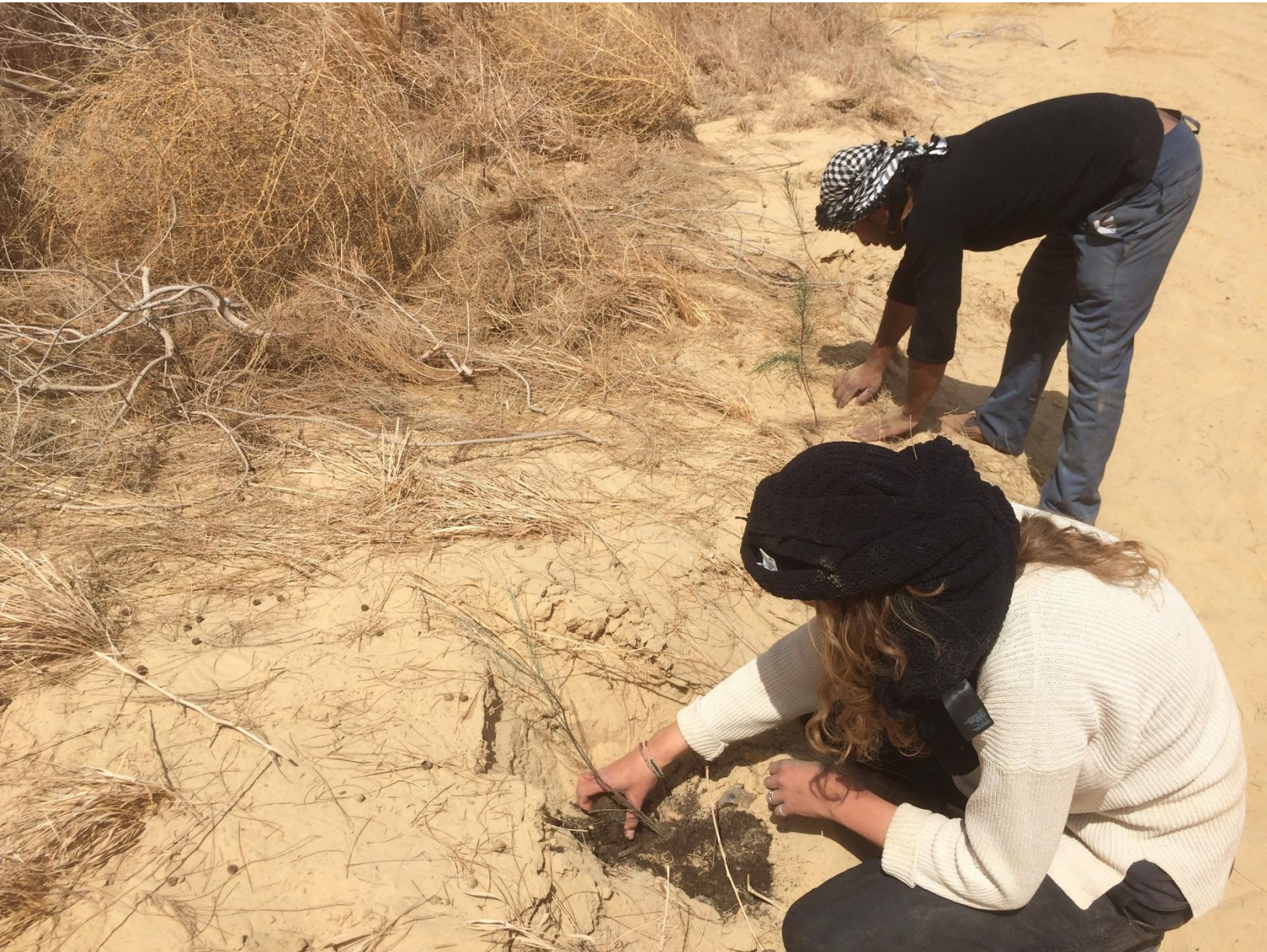
Casuarinabomen planten op Wahat