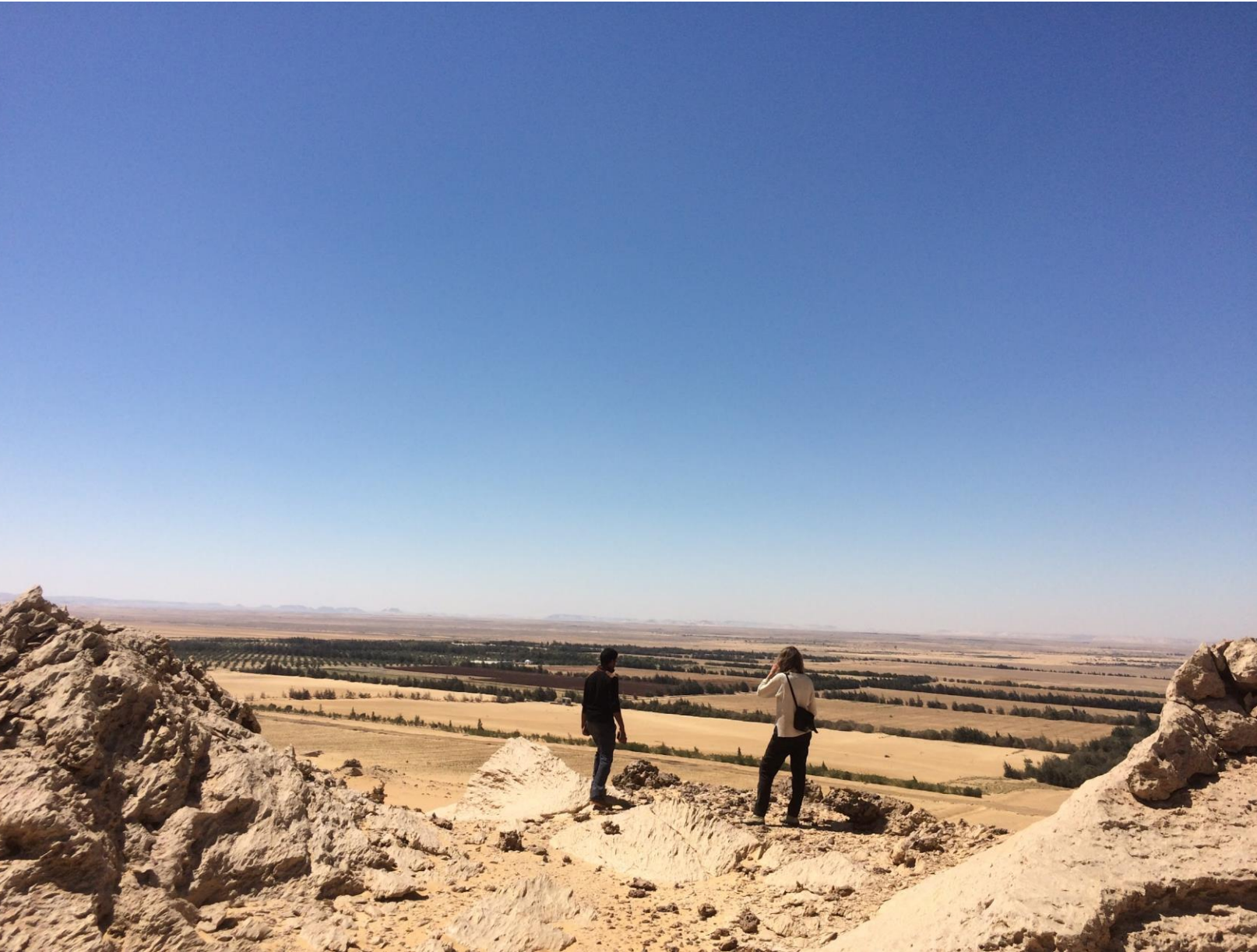
Uitzicht op boerderij El Wahat El Bahareya