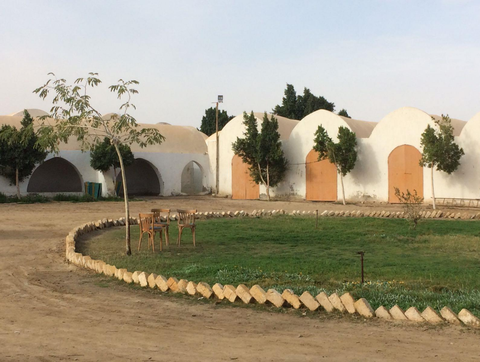
Binnenplaats boerderij Wahat