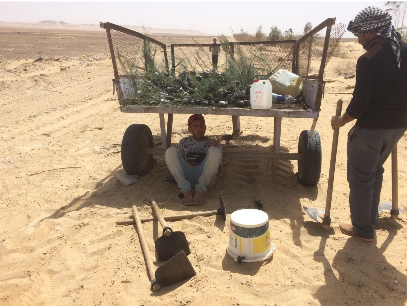
Werknemer in de schaduw, boerderij El Wahat El Bahareya