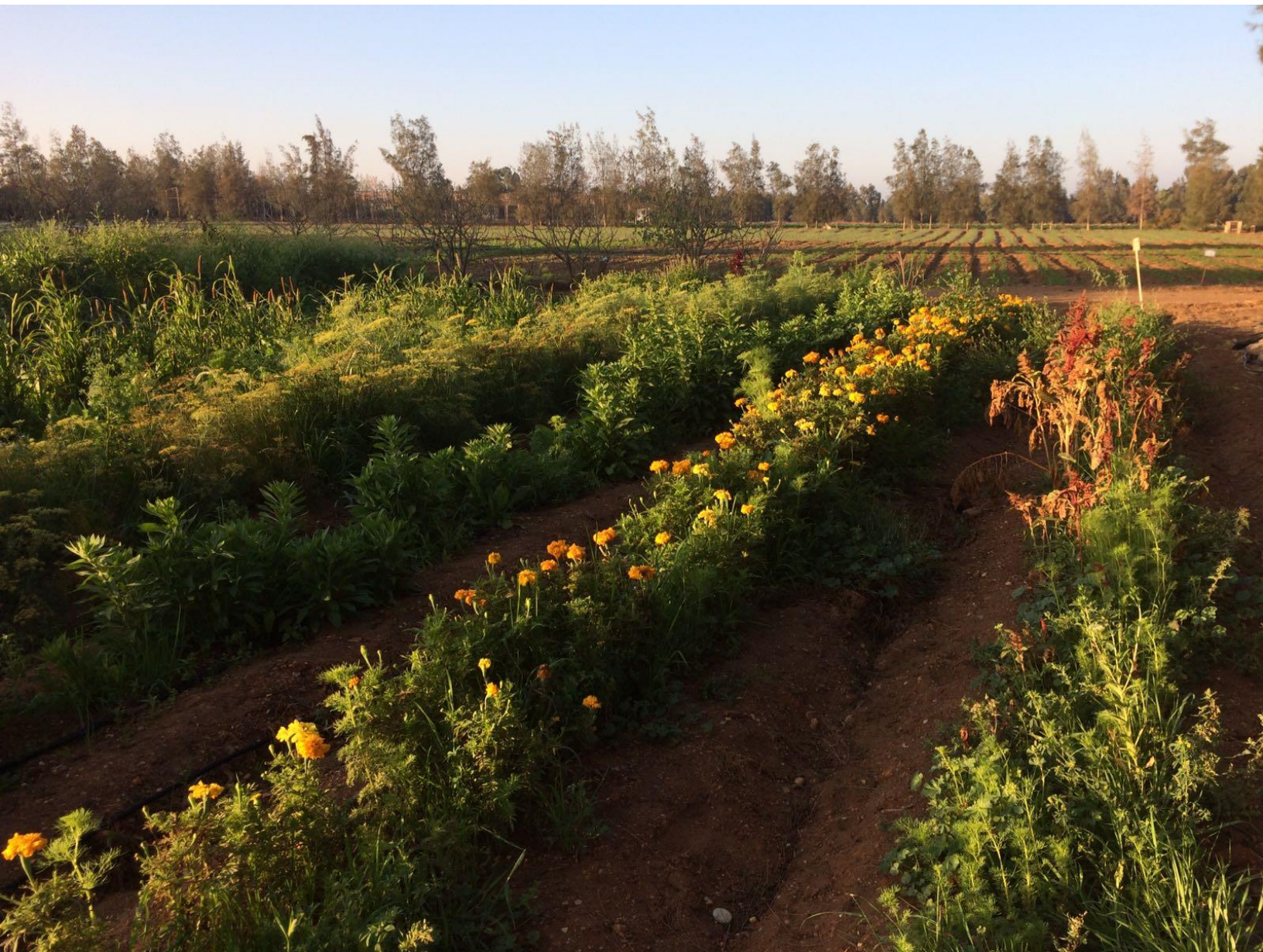
Medical garden, boerderij Adleya