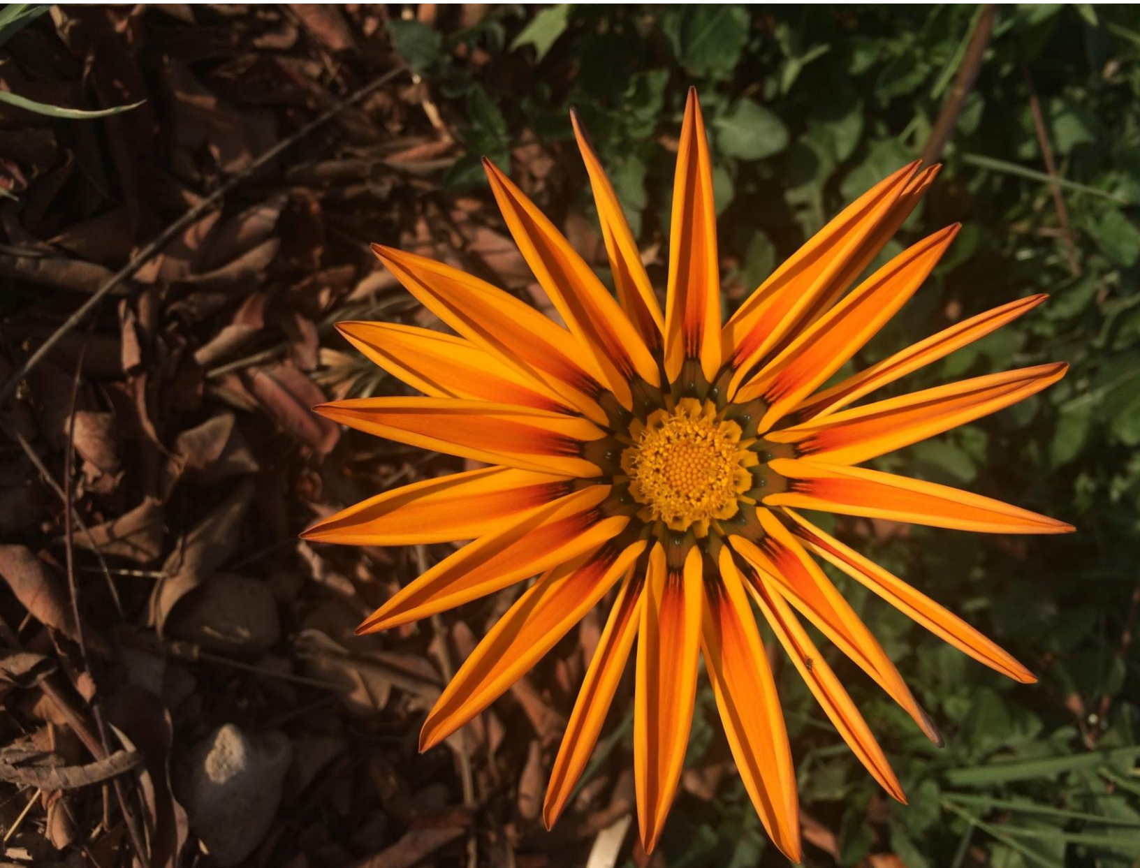
Bloem, Sekem Main farm