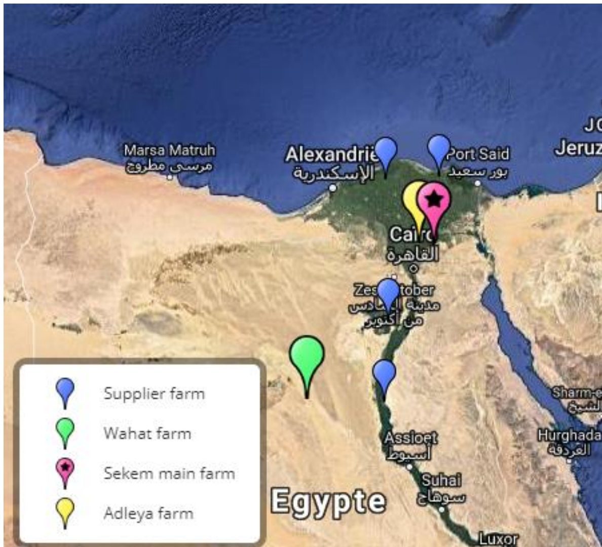
Afbeelding 1: De door ons bezochte Sekem locaties