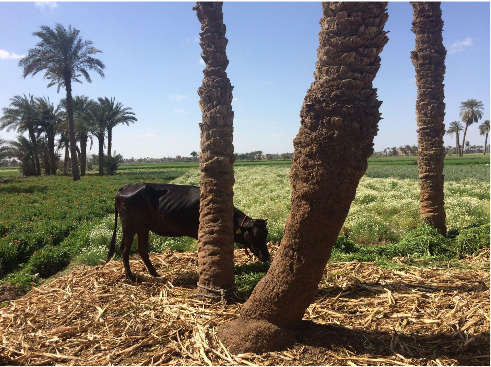
Supplier Farm Abo Hased, El Fayum