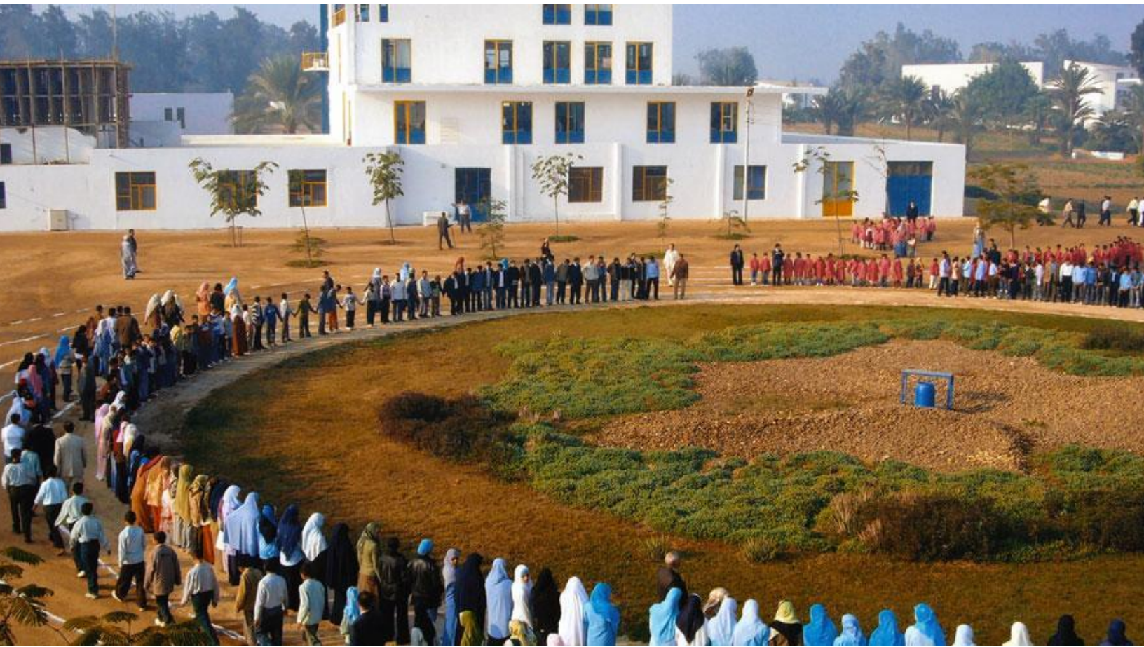
Sekem cirkel, Main farm 18