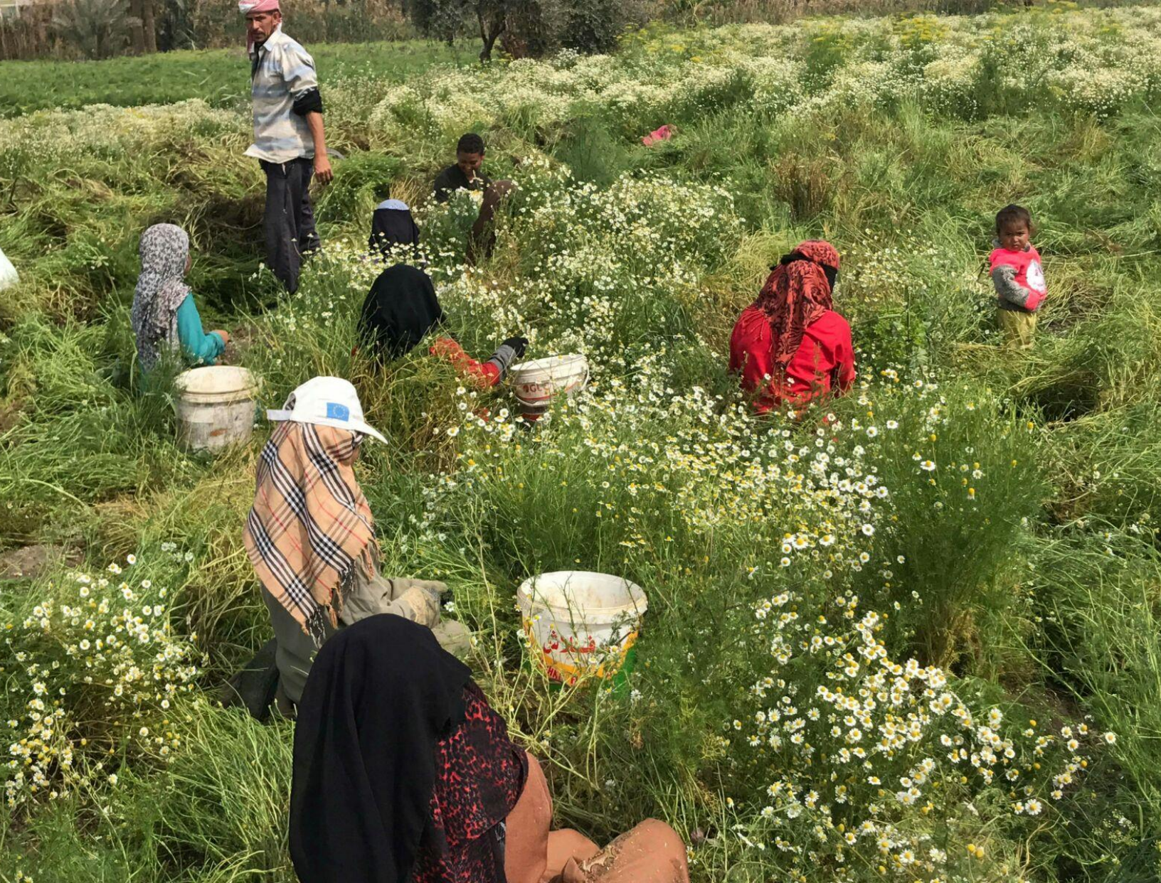
Werknemers op supplier farm Kafr-El-Shaikh