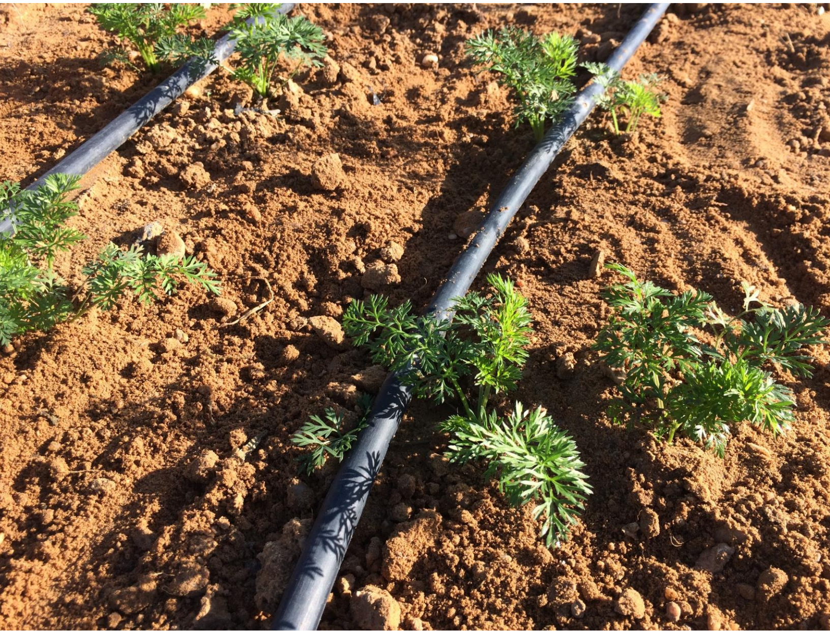
Participerende observatie: Worteltjes planten op boerderij Adelya