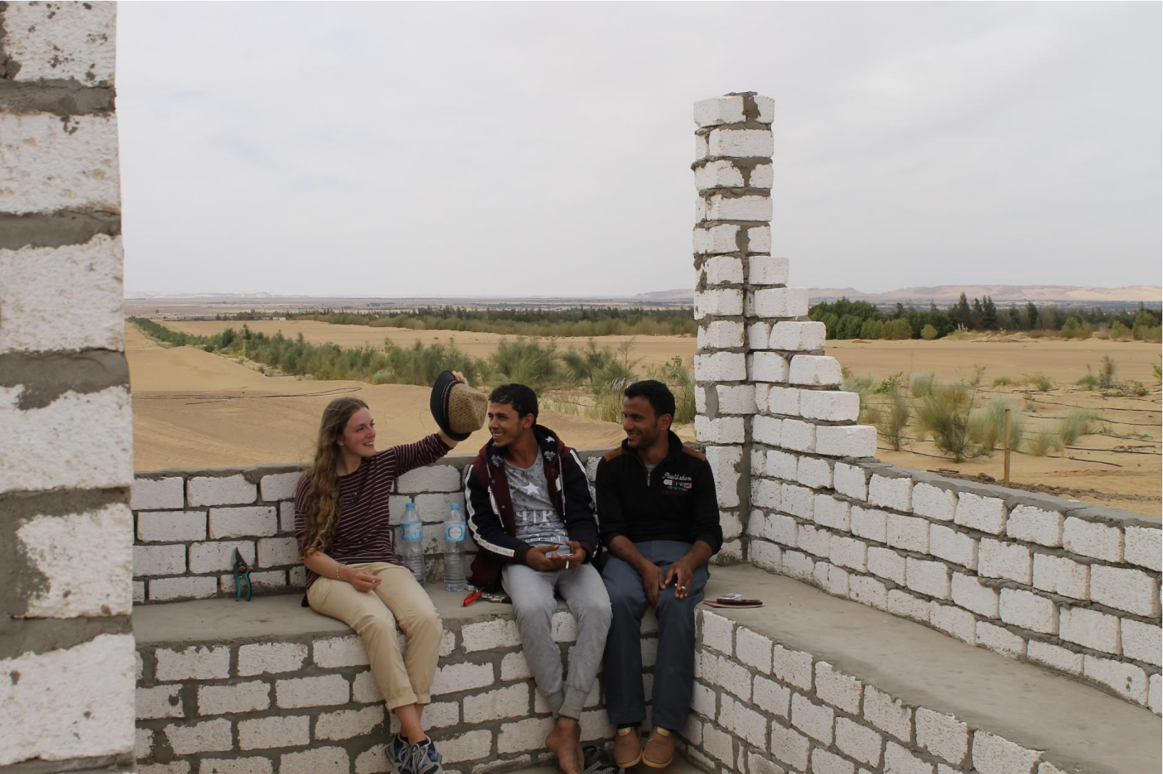
Pauze van het werk op boerderij Wahat