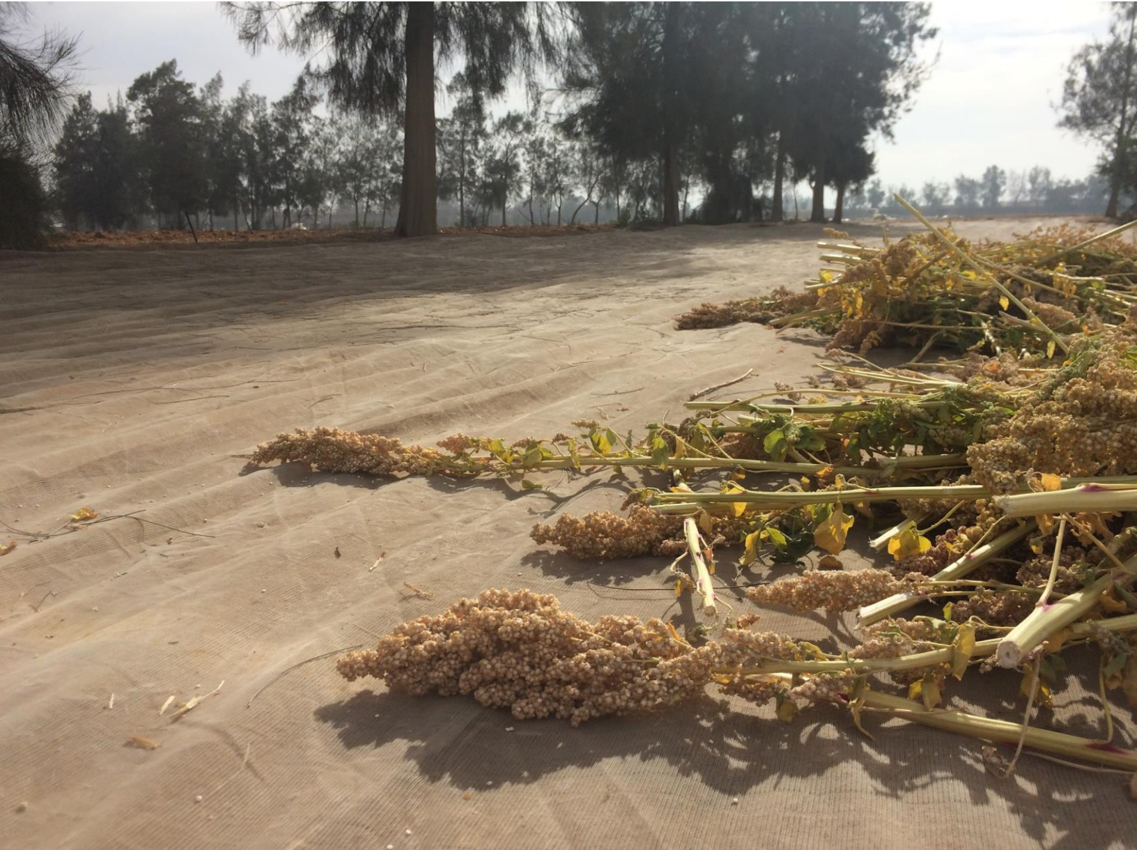
Drogende quinoa, boerderij Adleya