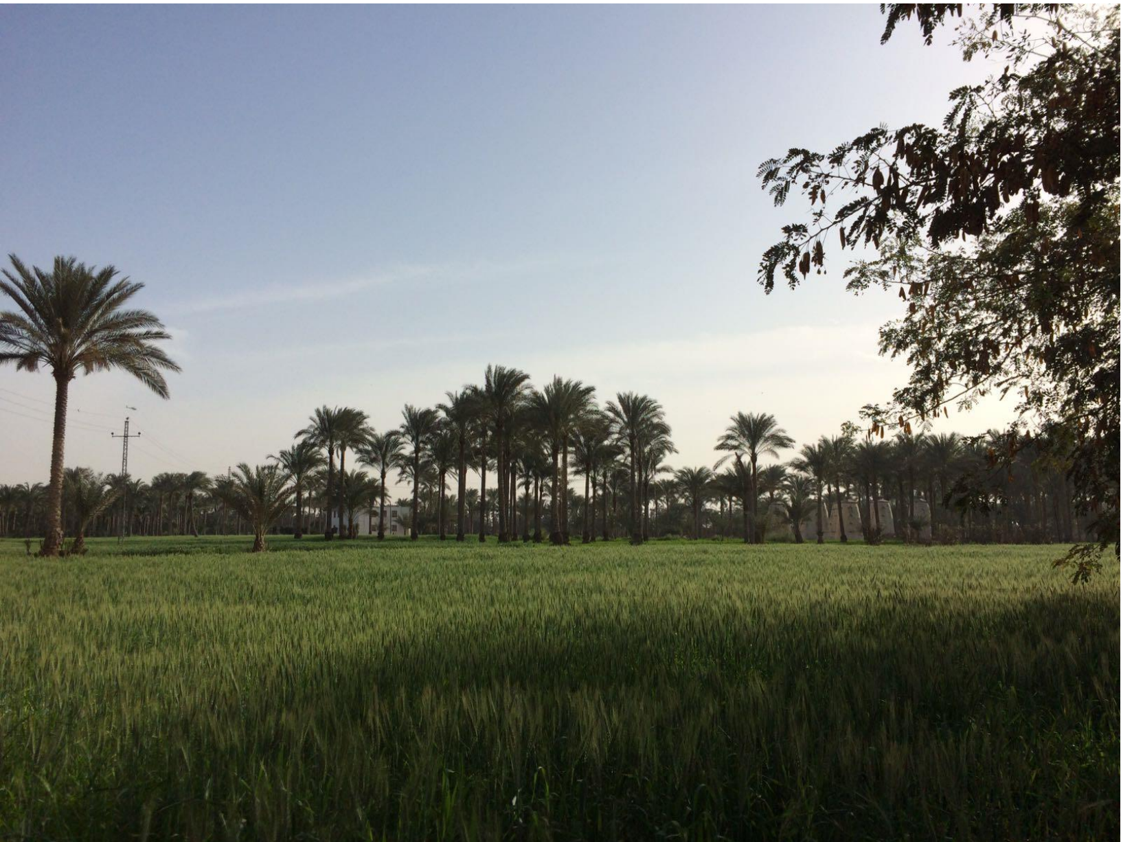
Sekem Main farm, graanvelden