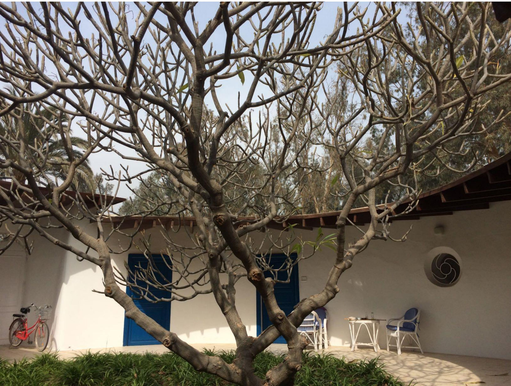
Één van de eerst geplante bomen op Sekem