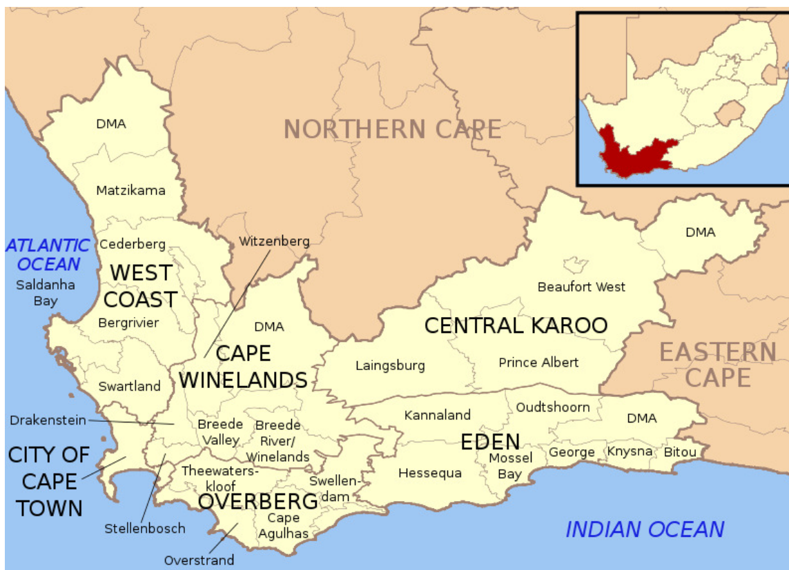
Figuur 2: Western Cape