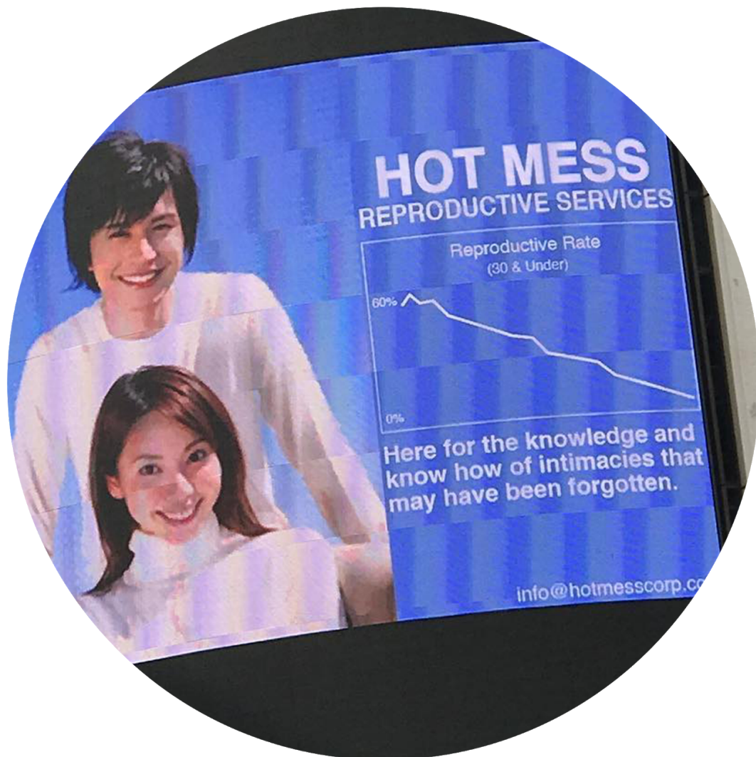
Afbeelding 1. (Luka Sabbat, 2018)