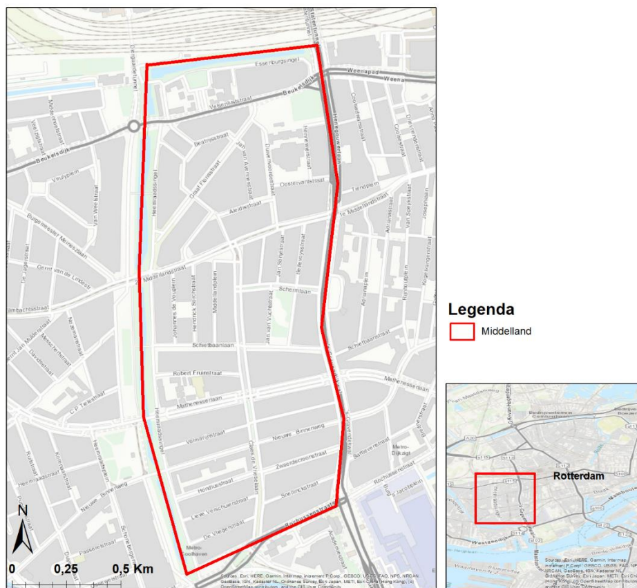
Figuur 2. Ligging van Middelland in Rotterdam Middelland in Rotterdam

Middelland is een stadswijk in Rotterdam-West met veel diversiteit. Door middel van de Nieuwe Binnenweg en de Middellandstraat is de wijk verbonden met het centrum van Rotterdam, zie figuur 2.