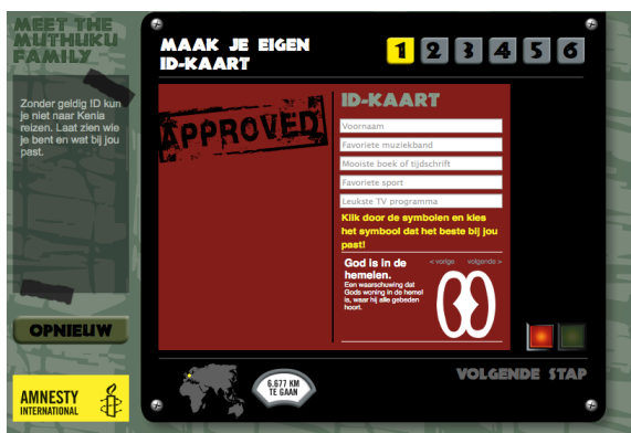
Afbeelding 1: opdracht 1 van de game MEET THE MUTHUKU FAMILY . 44

Ten tweede biedt zappechtgebeurd.nl spaces of participation aan rondom enkele thema's van de documentaires. Op het platform worden lesbrieven aangeboden voor scholen. Eén van deze opdrachten is gebaseerd op de documentaire over de Keniaanse familie Muthuku. Het lespakket rondom deze documentaire bevat verschillende thema's waarover kinderen kunnen discussiëren in de klas. Deze opdrachten vallen niet allemaal binnen de definitie van Müller van spaces of participation . De meeste activiteiten zijn niet online. Daarnaast is er geen mogelijkheid voor kijkers om een zichtbare bijdrage te leveren over de content. 43 Om deze reden wordt alleen de game geanalyseerd. In de game moeten kinderen naar Kenia reizen en leren zij onderweg naar deze familie een aantal feiten over de leefomstandigheden. De game heeft een duidelijk narratief. De speler gaat op reis en krijgt onderweg verschillende opdrachten, totdat de speler bij de familie is aangekomen. Doordat de educatieve concepten regelmatig worden herhaald in de game, is het makkelijk om de algehele boodschap te identificeren.