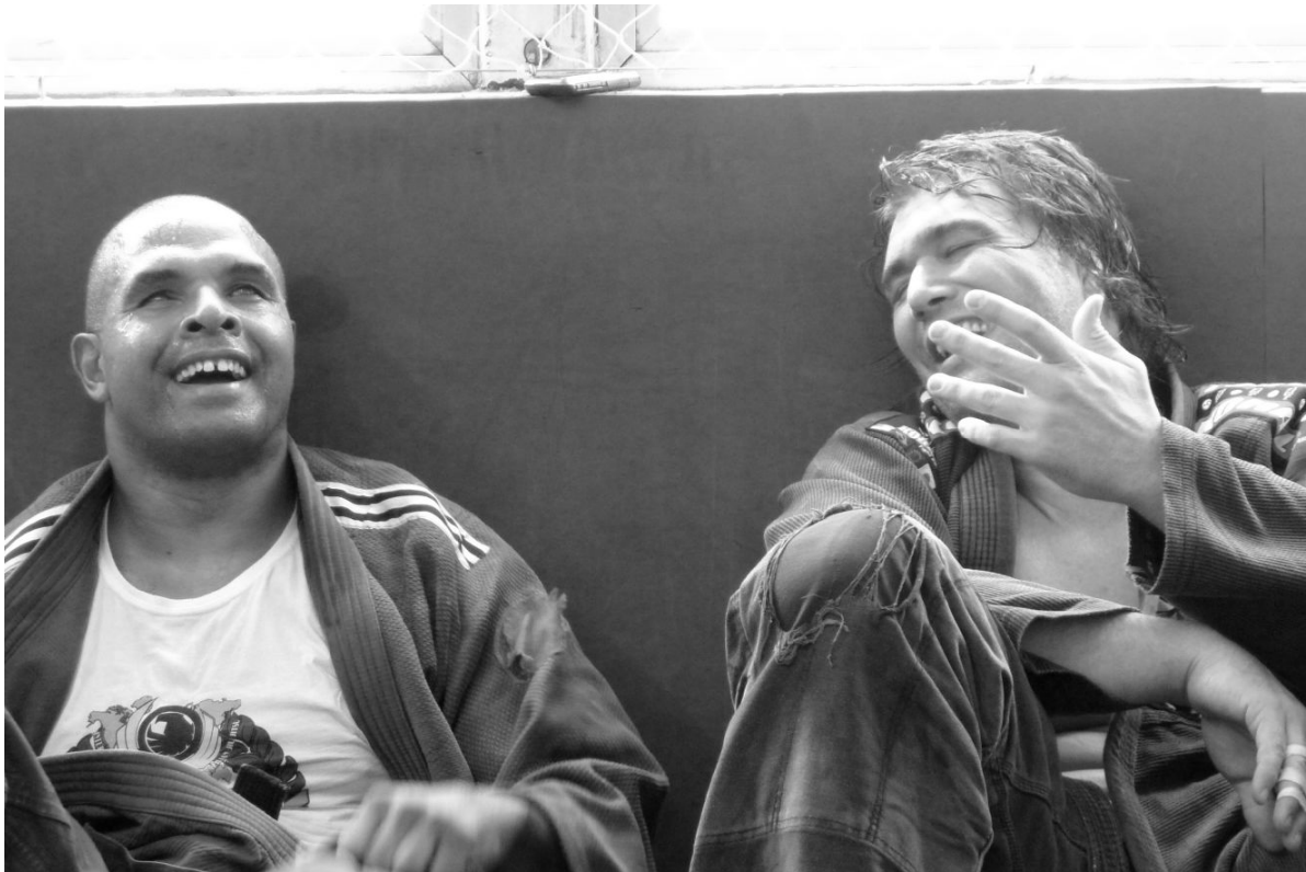
Afbeelding 5: ‘Het sociale karakter van sport’

om het sociaal isolement, wat in Brazilië benoemd wordt als sedentario , te doorbreken kwam zowel van de visueel gehandicapte zelf als van ziende en visueel gehandicapte vrienden en andere naasten.