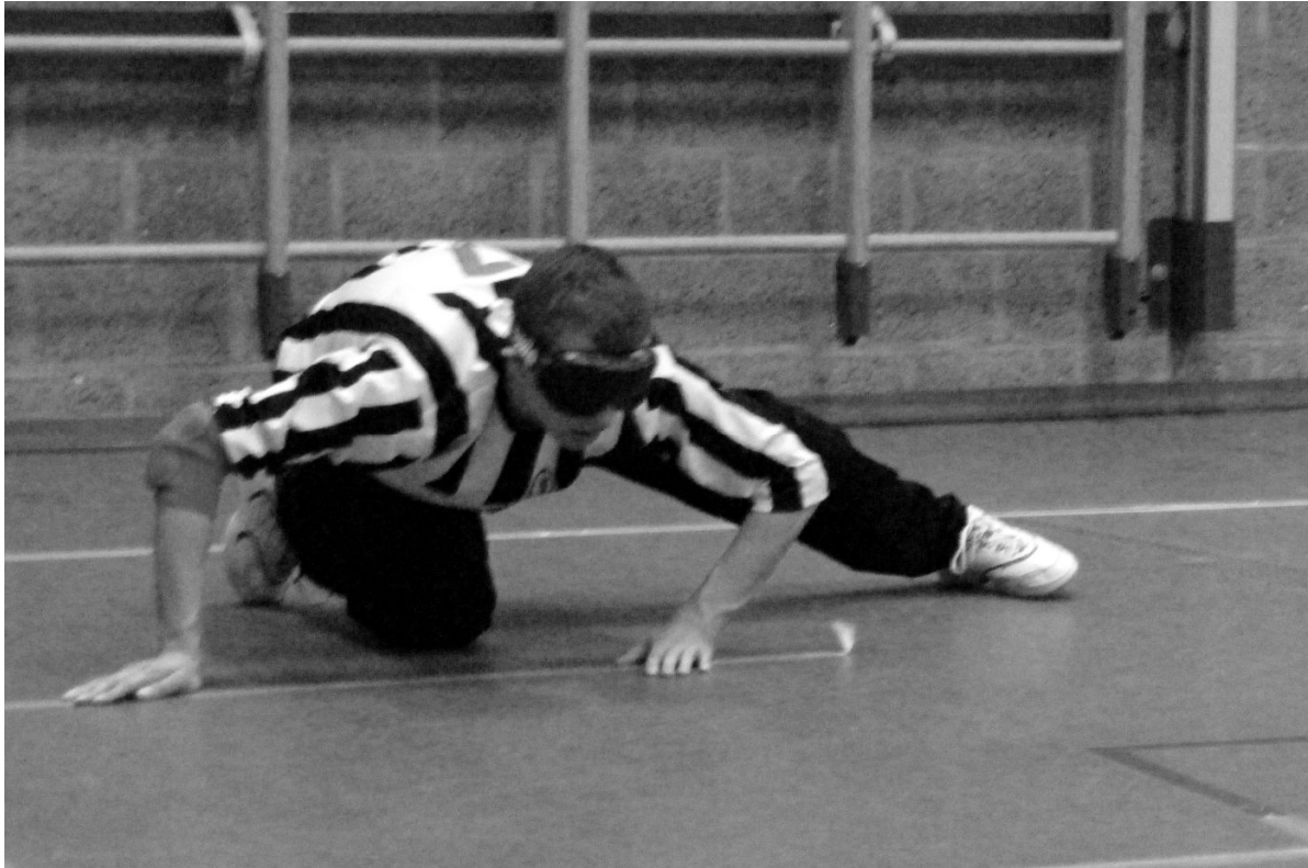
Afbeelding 6: 'Ontwikkeling van fysieke vermogens tijdens goalball'