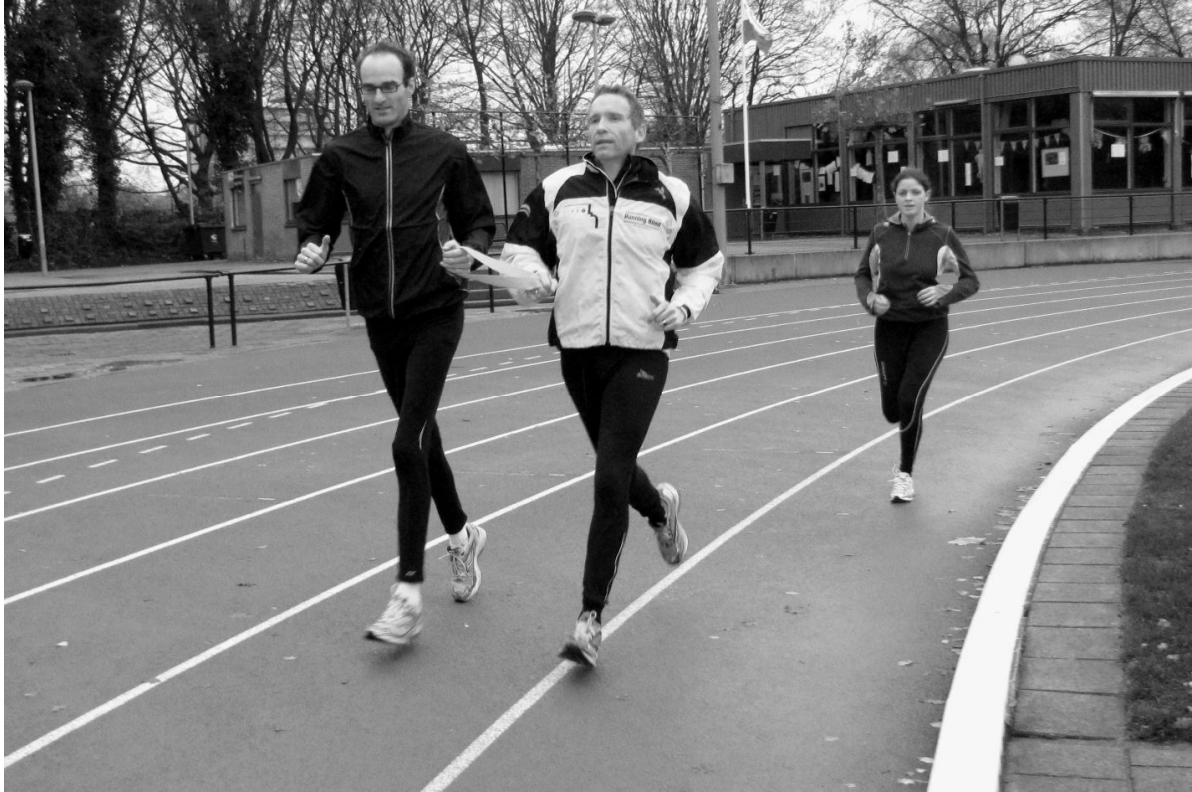
Afbeelding 2: 'Slechtzienden tijdens een hardlooptraining'

Successen op Paralympisch niveau hebben wel merkbare invloed gehad op de sportsituatie van blinden en slechtzienden in Brazilië. De positie in de samenleving verandert echter niet direct door persoonlijke initiatieven.