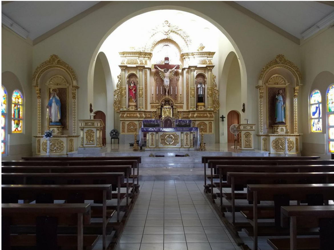
Voorste gedeelte van het katholieke kerkgebouw

Voorin het katholieke kerkgebouw straalt het vele goud de kerkganger tegemoet. In gouden omlijstingen staan vijf heiligenbeelden en onder het kruisbeeld van Jezus staat een gouden kastje waarin de bekers met de overgebleven hostie worden opgeborgen. Daarvoor staat een rechthoekige tafel: het altaar, ook met goud versierd.