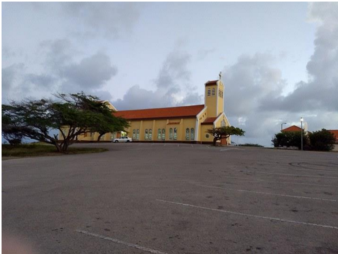
De Santa Philomena-Kerk op Aruba

Dit korte vignet over hoe de gelovigen van de katholieke Santa Philomena Kerk in Paradera op Aruba op een willekeurige zondagochtend de kerk binnenkomen laat al iets zien van de religieuze uitingsvormen van deze groep katholieken. In dit hoofdstuk worden de belangrijkste uitingsvormen voor de onderlinge beeldvorming besproken, namelijk ruimte, afbeeldingen en objecten, taal, kleding en lichaam.