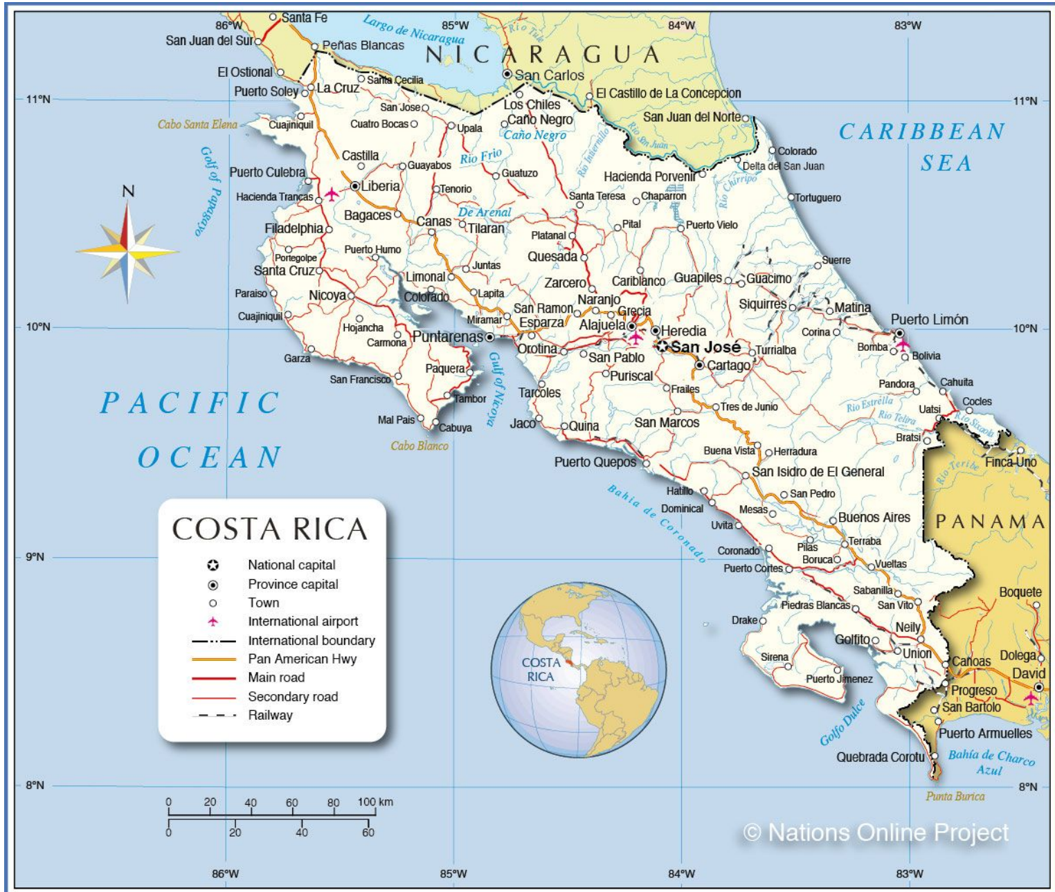
Figuur 1 1 : Costa Rica