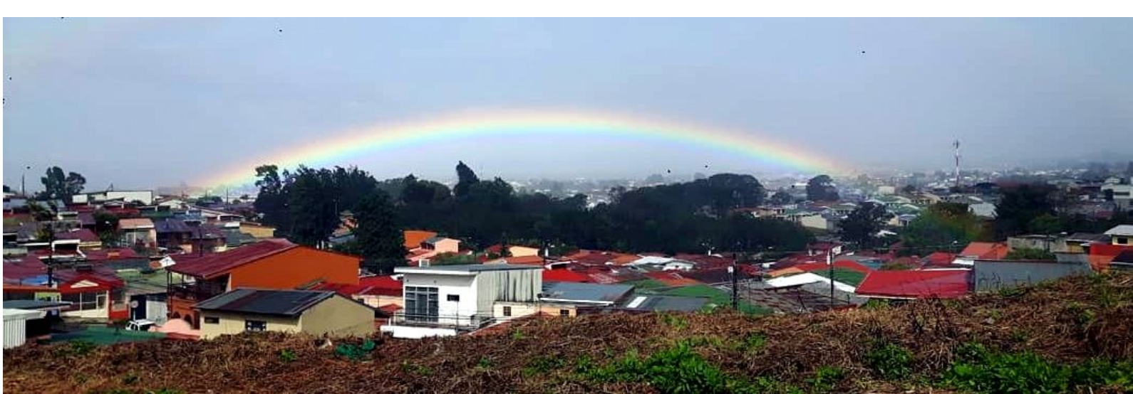
San José

Individuele en Collectieve Seksuele Identiteitsconstructie van de LGBT-populatie in San José, Costa Rica