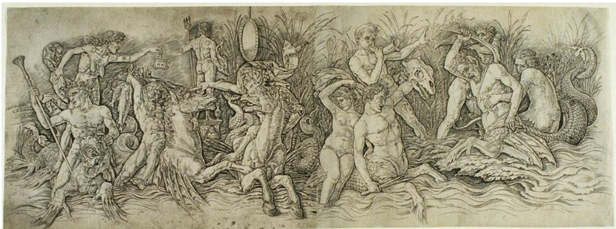
Afb. 10. Andrea Mantegna, De strijd van de zeegoden , 1485-1488, gravure, 31 x 84 cm, Johnson Museum of Art.

Andrea Mantegna's De strijd van de zeegoden (1485-1488, Afb. 10) wordt genoemd als vergelijkingsmateriaal. Een zekere gelijkenis is zeker te zien in de algemene vorm van de monsters. Echter, deze voorstellingen zijn grotendeels heroïsche gevechten, die plaatsvinden in het water. Op de tekening van Hans Baldung is geen water te bekennen, en er lijkt eerder een symbiotische relatie te zijn tussen de draak en de vrouw dan een gevecht.