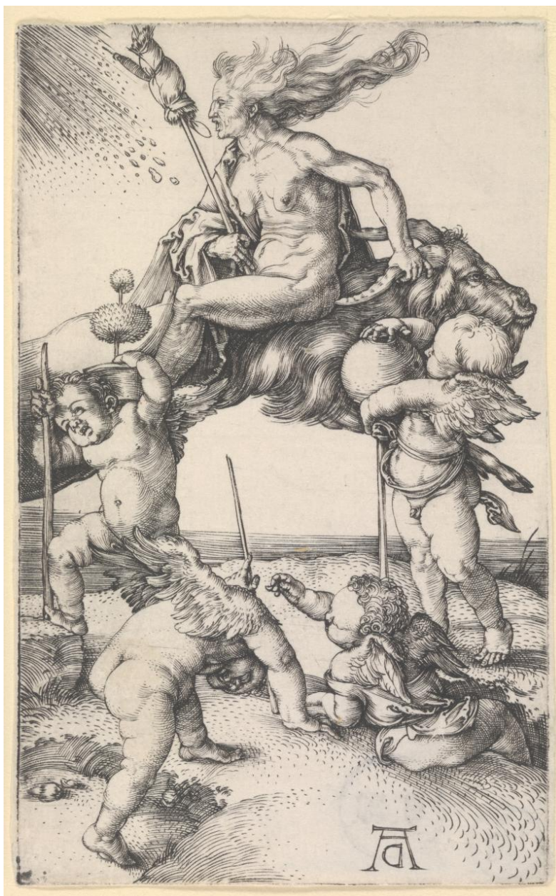
Afb. 4. Albrecht Dürer, Een heks rijdt achterstevoren op een geit, ets, ca. 1500 , Museum of Fine Arts, Boston.

Door deze directe connectie tussen Baldung en Dürer is het waarschijnlijk dat Baldung's heksen in een traditie staan van vergelijkbare werken van Dürer. Het is echter lastig te zeggen of de invloed enkel visueel of ook intrinsiek was. Theorieën over deze werken lopen uiteen, van een nieuwe interpretatie van de klassieken 3 , tot een visuele weergave van Dürers humanistische denkbeelden. 4