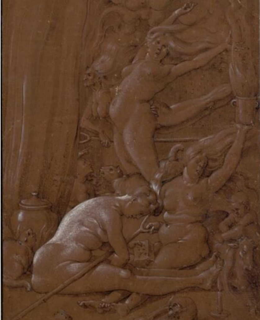
Afb. 11. Hans Baldung, Hekensabbat II , 1514, penseeltekening op roodbruin papier, 28.8 x 20.5 cm, The Albertina, Wenen.

De 'relentless misogyny' waar Hults over spreekt is zeker aanwezig in de Malleus Maleficarum , maar is niet overtuigend aanwezig in de werken van Hans Baldung. De bestaande overeenkomsten tussen de beschreven heks in de Malleus en de werken van Hans Baldung zijn geen reden om de werken aan te merken als gelijken op het vlak van vrouwenhaat.