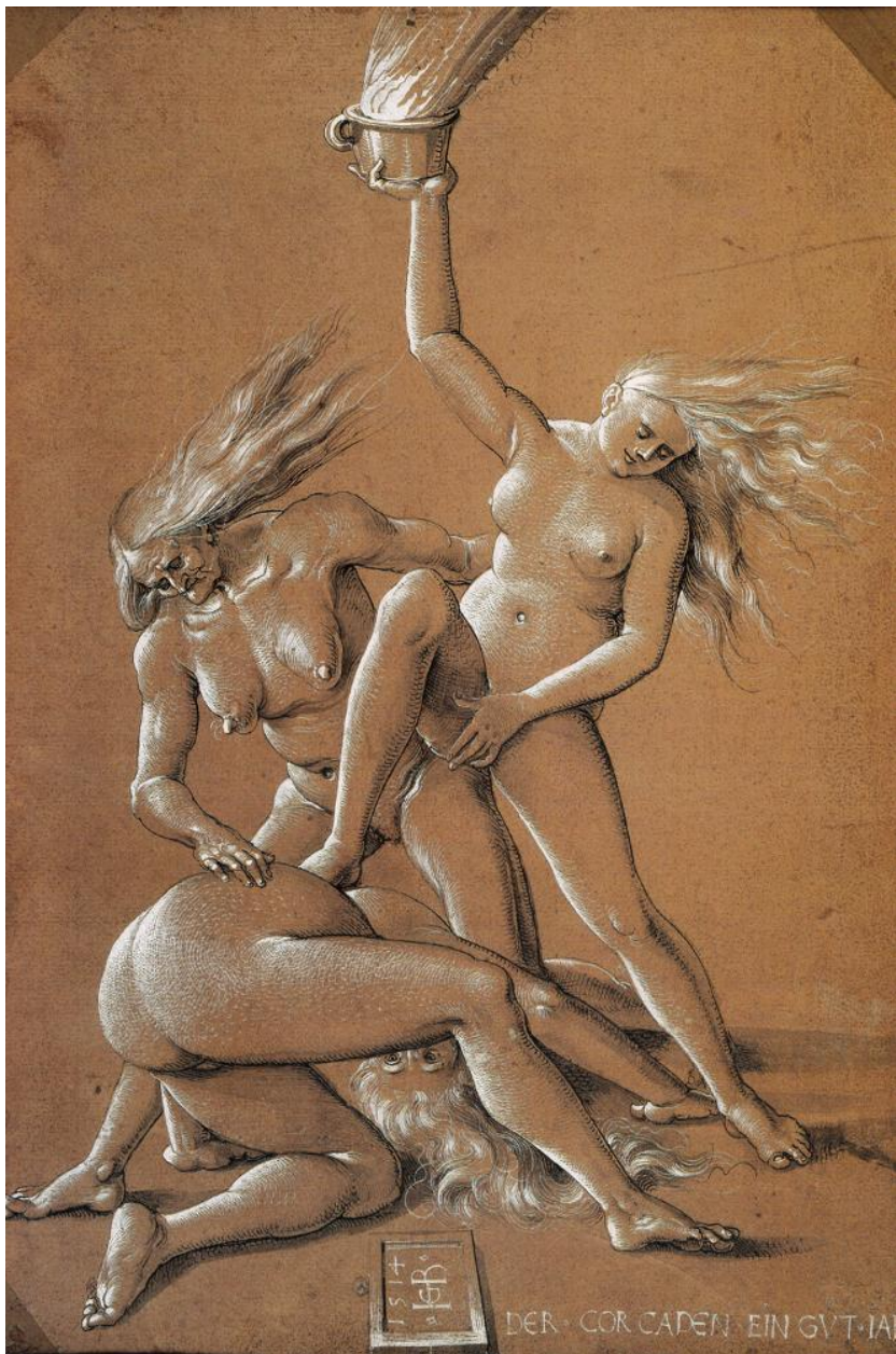
Afb. 7. Hans Baldung, Nieuwjaarsgroet met drie heksen , 1514, penseel en pentekening op bruin papier, 30.9 cm x 21 cm, The Albertina, Wenen.

De bijzondere compositie van de figuren in Nieuwjaarsgroet met drie heksen wordt op verschillende manieren geïnterpreteerd door kunsthistorici. De wilde bewegingen die de vrouwen maken kunnen de bezeten staat weergeven waarin zij verkeren. Het weelderige haar van de heksen heeft ook een betekenis: het haar werd gezien als een bron voor magische kracht. De connectie