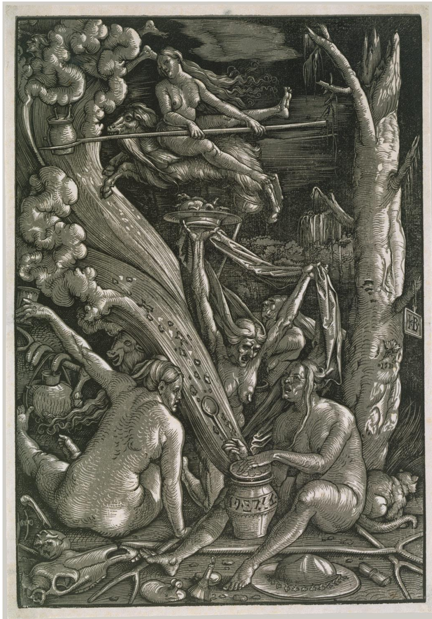
Afb. 1. Hans Baldung, De heksen (Heksensabbat) , 1510, houtsnede, 38.9 × 27 cm, The Metropolitan Museum of Art, New York.