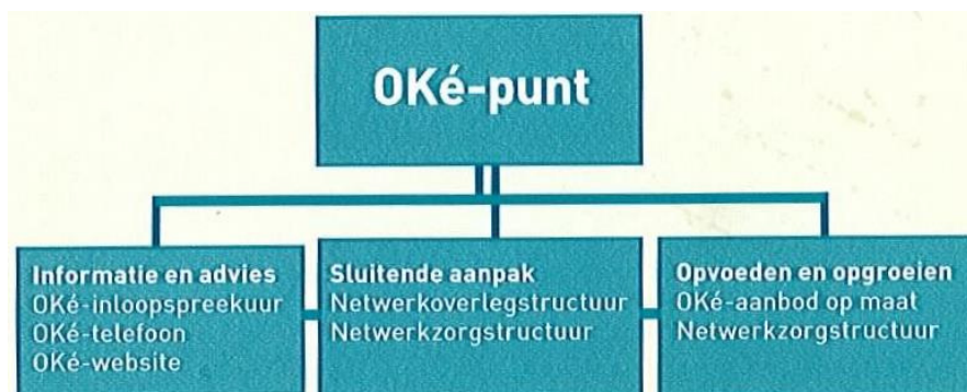
Figuur 1: Onderdelen van het OKé-punt (Gemeente Almere, 2009d).

Gemeenten hebben grote vrijheid in de manier waarop zij een CJG invullen en zijn ook vrij om het aanbod aan diensten uit te breiden (Jeugd en Gezin, 2009). Almere heeft in 2006 haar eerste CJG-locatie gestart onder de naam Ouder-Kindcentrum, oftewel het OKé-punt. Momenteel zijn er 15 plekken in Almere waar ouders en jongeren terecht kunnen met hun vragen en problemen. Er valt echter meer onder het OKé-punt dan alleen deze 15 fysieke plekken waar om hulp en advies gevraagd kan worden. Het OKé-punt kan namelijk opgevat worden als een drieluik met als onderdelen ‘informatie en advies’, ‘sluitende aanpak’ en ‘opvoeden en opgroeien’ (zie figuur 1) (Gemeente Almere, 2009d).