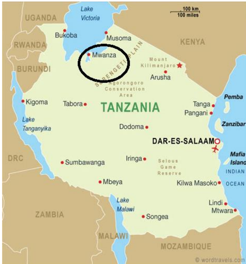
Figuur 1: Kaart met ligging van regio Mwanza, Tanzania 2