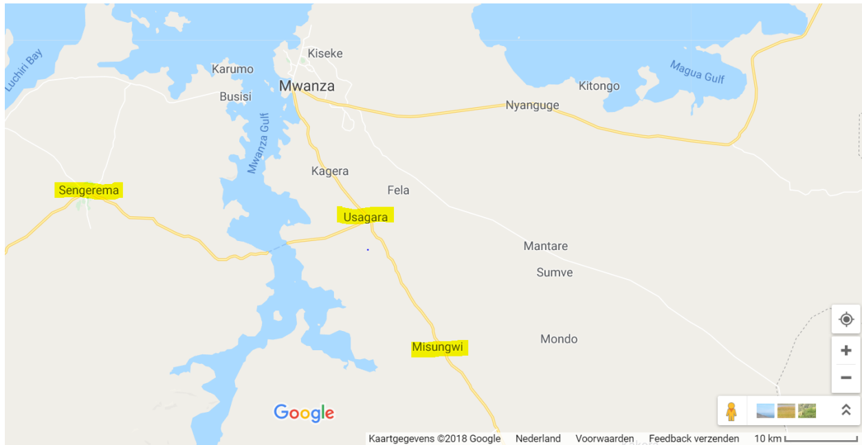
Figuur 2: Kaart van Sengerema, Usagara en Misungwi 3