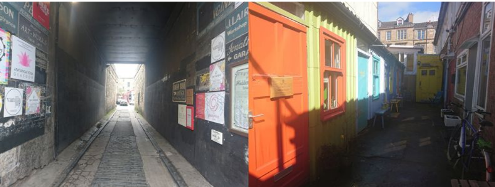
(Links foto nr. 1 de ingang vanuit de hoofdstraat, rechts foto nr. 2 studio's naast de Hidden Tearoom) 10

Deze verborgen plek zit naast Argyle street in Finnieston. The Hidden Lane is nu een plek waar meer dan 100 studiotjes zitten voor studenten, afgestudeerden en werkende artiesten. Men komt in The Hidden Lane via een tunnel te vinden in de hoofdstraat van Finnieston; Argyle street. De opening heeft geen uitnodigende uitstraling van zichzelf. Toch wanneer men durft verder te gaan staat er een kleurrijke verrassing te wachten. Veel van de gebouwen zijn beschilderd in vrolijke, felle kleuren. Voor de ingangen staan uitnodigingen om binnen te komen en met de bekende Hidden Tearoom op de hoek oogt het gezellig.