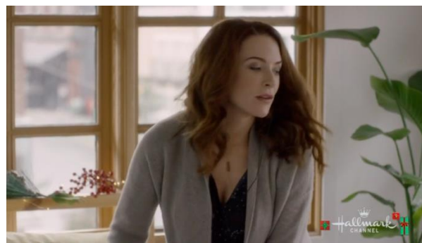
Afbeelding 6: Screenshot uit Christmas Getaway , bijlage 2, shot 157.