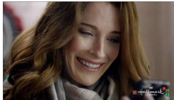
Afbeelding 8: Screenshot uit Christmas Getaway , bijlage 3, shot 64.

is bij een close-up groter dan bij een medium shot, omdat het publiek een groter deel van haar gezicht en dus haar emoties beter kan zien. De verdere close-ups zijn van beeldschermen van laptops, mobieltjes en computers. Dit zijn in de meeste gevallen ook stilstaande objecten, dus reframing speelt daar geen rol. Door het gebruiken van medium shots (medium (long) shots en medium close-ups) heeft de acteur ruimte om te bewegen en de cameraman kan makkelijker fouten tijdens de take corrigeren. De camera-afstand staat dus in dienst van de impact die het beeld moet hebben en in dienst van de