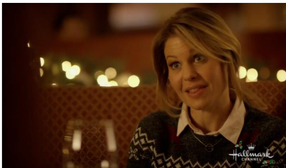
Afbeelding 13: Screenshot uit Switched for Christmas bijlage 8, shot 168.