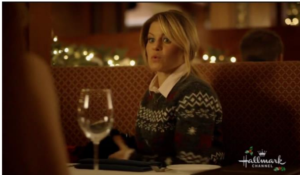
Afbeelding 11: Screenshot uit Switched for Christmas bijlage 8, shot 166.