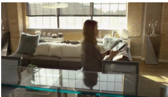
Afbeelding 19: Screenshot uit Switched for Christmas bijlage 8, shot 12.

Het huis is in het begin van de film onversierd en kil. Eric, de man in de rode trui, heeft een slechte ervaring met kerst gehad en wil het niet meer vieren. Aan het eind van de film staat er echter een grote kerstboom centraal achterin het shot met kerstsokken aan de open haard en lichtjes op de trap. Het huis straalt een en al kerst uit. Eric heeft het kerstgevoel weer teruggevonden. Deze tegenstelling, een onversierd huis versus een versierd huis, is ook te zien in Switched for Christmas (2017). Het appartement van Kate (afbeelding 19) is strak gemeubileerd en kil, terwijl het huis van Chris