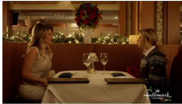
Afbeelding 12: Screenshot uit Switched for Christmas bijlage 8, shot 167.