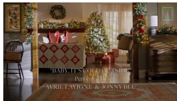
Afbeelding 20: Screenshot uit Switched for Christmas bijlage 8, shot 13.

(afbeelding 20) warmte en kerst uitstraalt. Daarom eindigt de film ook in het huis van Chris. Alles komt namelijk goed wanneer het kerst is en daar is het kerst. Dat is ook wat de Hallmark kerstfilms uitdragen: alles komt goed met kerst. Niet alleen komt deze deus ex machina terug in het narratief, maar dus ook in de mise-en-scène.