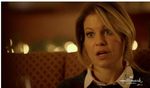
Afbeelding 15: Screenshot uit Switched for Christmas bijlage 8, shot 172.