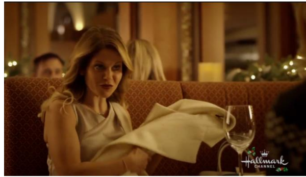
Afbeelding 10: Screenshot uit Switched for Christmas bijlage 8, shot 165.