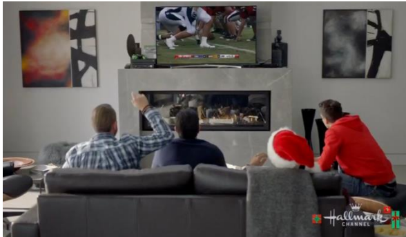
Afbeelding 17: Screenshot uit Christmas Next Door bijlage 5, shot 151.

Wat in de Hallmark kerstfilms wel sterk opvalt is de mise-en-scène en specifiek de uitbundig gedecoreerde sets met kerstversiering. Het groen en rood van bijvoorbeeld kerstbomen en kerstballen straalt van het scherm. Zie hieronder het verschil tussen het huis van Eric in Christmas Next Door (2017) aan het begin van de film en aan het eind van de film.