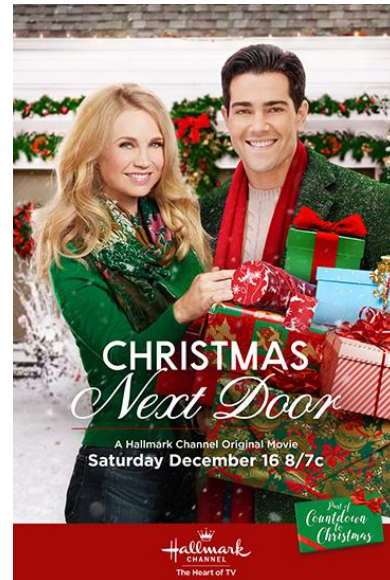
Afbeelding 2: Christmas Getaway (2017) filmposter

De ingebouwde marketing van high concept films zorgt er ook voor dat de films een bepaalde 'pre-sold identity' hebben volgens Wyatt. 34 Dit kan een vorm nemen als: "de nieuwe Dwayne 'The Rock' Johnson film" of "de vrouwelijke Ghostbusters reboot." Star power is dus een van de elementen waarmee een high concept film naar het publiek gebracht kan worden. 35 De bekendheid van Dwayne Johnson met het publiek kan mensen naar bioscoopzalen trekken. Bij de Hallmark films worden vaak dezelfde acteurs gebruikt, zoals Candace Cameron Bure en Danica McKellar die elk jaar minstens twee films voor Hallmark maken waaronder een kerstfilm. Deze acteurs zijn onderdeel van de Hallmark 'familie'. Het doel van de marketing is om deze pre-sold identity kenbaar te maken door simpele en grafisch opvallende beelden en tekst. 36