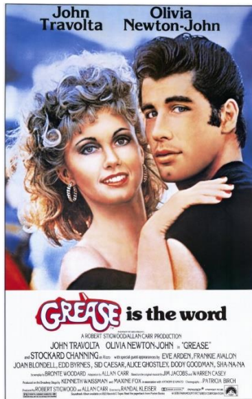
Afbeelding 1: Grease (1978) filmposter

versturen, dus de kerstkaarten kunnen indirect gezien worden als merchandise. Als laatst wordt het 'Countdown to Christmas' logo gebruikt om films aan te duiden die op Hallmark Channel uit worden gezonden.