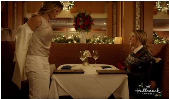
Afbeelding 9: Screenshot uit Switched for Christmas bijlage 8, shot 164.