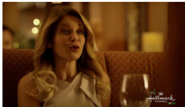
Afbeelding 14: Screenshot uit Switched for Christmas bijlage 8, shot 169