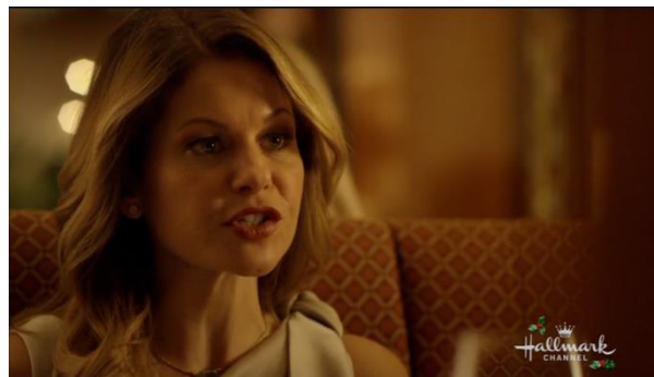
Afbeelding 16: Screenshot uit Switched for Christmas bijlage 8, shot 173.