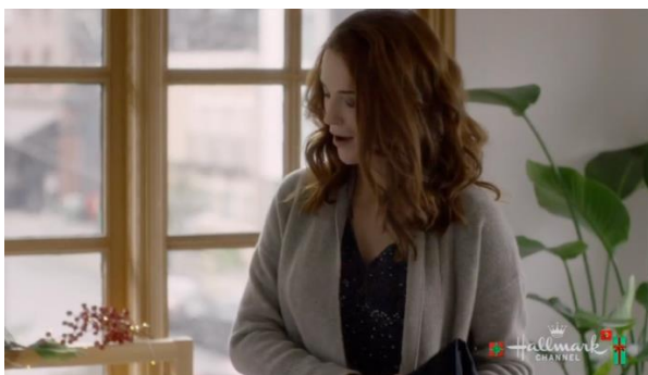
Afbeelding 5: Screenshot uit Christmas Getaway , bijlage 2, shot 157.

Zoals hierboven gezegd is, valt bij de cinematografie op dat de drie films niet stilistisch gefilmd zijn. Het zijn dus geen opvallende cameratechnieken gebruikt. De bewegingen die de camera bijvoorbeeld maakt, bestaan uit simpele dolly shots , pans en tilts . Alleen in Switched for Christmas (2017) wordt er in de eerste en laatste sequentie ook nog gebruik gemaakt van in totaal vijf crane shots. 113 De voornaamste functie van al deze camerabewegingen is om de personages te volgen. Zo is dat ook met alle handheld shots in de shotlijsten. Handheld shots zijn in het geval van dit onderzoek shots waarbij de camera minimale bewegingen maakt om een personage goed in beeld te houden. Zie onderstaand voorbeeld. Emory pakt haar koffer in en de camera gaat ietsjes omlaag om de beweging