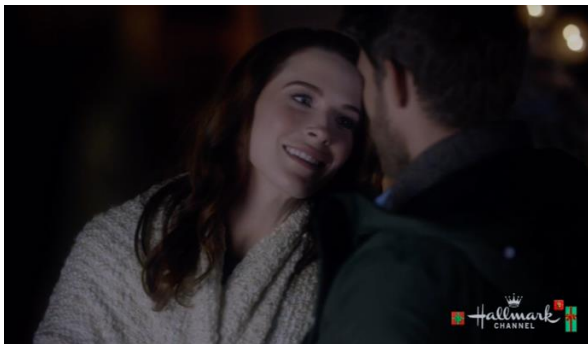
Afbeelding 3: Screenshot uit Christmas Getaway segment C73.

Dat de kerstfilms zich hebben aangepast aan het televisiemedium is ook te zien in hoe de segmenten zijn ingedeeld in de drie films. Vaste verhaallijnen in de film vinden plaatsen rond dezelfde tijd. Bijvoorbeeld het moment dat de hoofdpersonages voor het eerst hun gevoelens voor de ander aan elkaar erkennen net voor reclameblok 6. In de films Christmas Getaway (2017) en Christmas Next Door (2017) worden deze gevoelens duidelijk doordat de hoofdpersonages bijna zoenen (zie afbeelding 3 en 4). 101 Ze worden, in allebei de films, net op het laatste moment tegengehouden door de kinderen die hen roepen en de samenkomst van man en vrouw wordt vooralsnog uitgesteld. Switched for Christmas (2017) is de enige film die niet zo'n moment heeft, maar voor reclameblok 6 in die film is het wel duidelijk dat de twee stellen elkaar leuk vinden. Reclameblok 6 is daarbij ook het keerpunt in de drie films. Na deze reclame vinden namelijk de grootste complicaties plaats. In