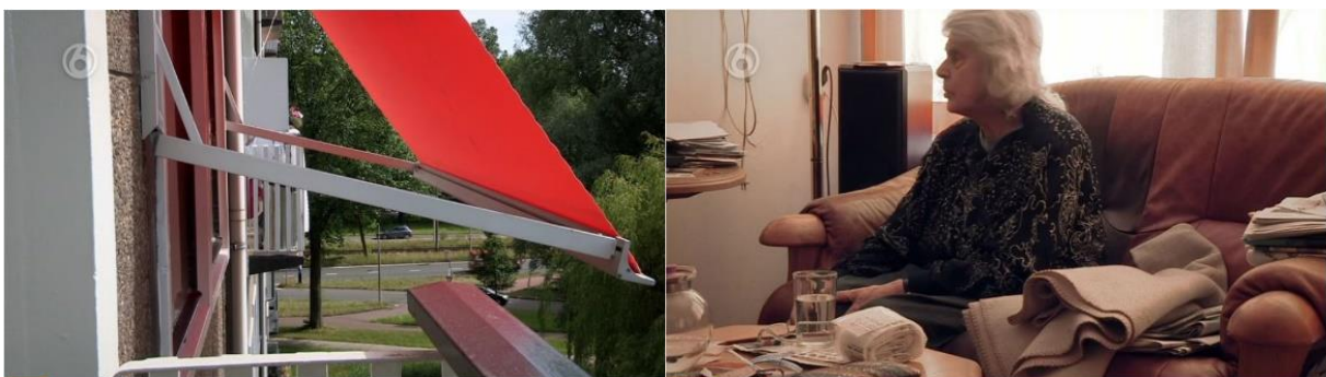
Figuur 2: Buiten/binnen contrast – Shot A4.3. en shot A4.4.

In de eerste sequentie is de setting van mevrouw Breed altijd binnen, in haar huis. Dit draagt in eerste instantie bij als demonstratief bewijsmiddel voor de constatering van de thuiszorg, dat mevrouw Breed zo weinig buiten komt terwijl ze dat vroeger juist graag deed. 118 Daarnaast wordt het constant 'binnen zijn' benadrukt, door een contrast met buiten. Een voorbeeld daarvan is te zien in figuur 2, waarbij de camera eerst vanuit het raam op de straat blikt, waar auto's voorbijrijden en waarbij verschillende kleuren te zien zijn. In het daaropvolgende shot zit mevrouw Breed binnen op de bank, in een constant zelfde setting en zijn er weinig/onverzadigde kleuren te zien. Deze opeenvolging van shots benadrukt het contrast van de levendige buitenwereld die in beweging blijft, ten opzichte van mevrouw Breed die in een grauwe omgeving binnen zit, waar de dagen voorbij tellen. 119