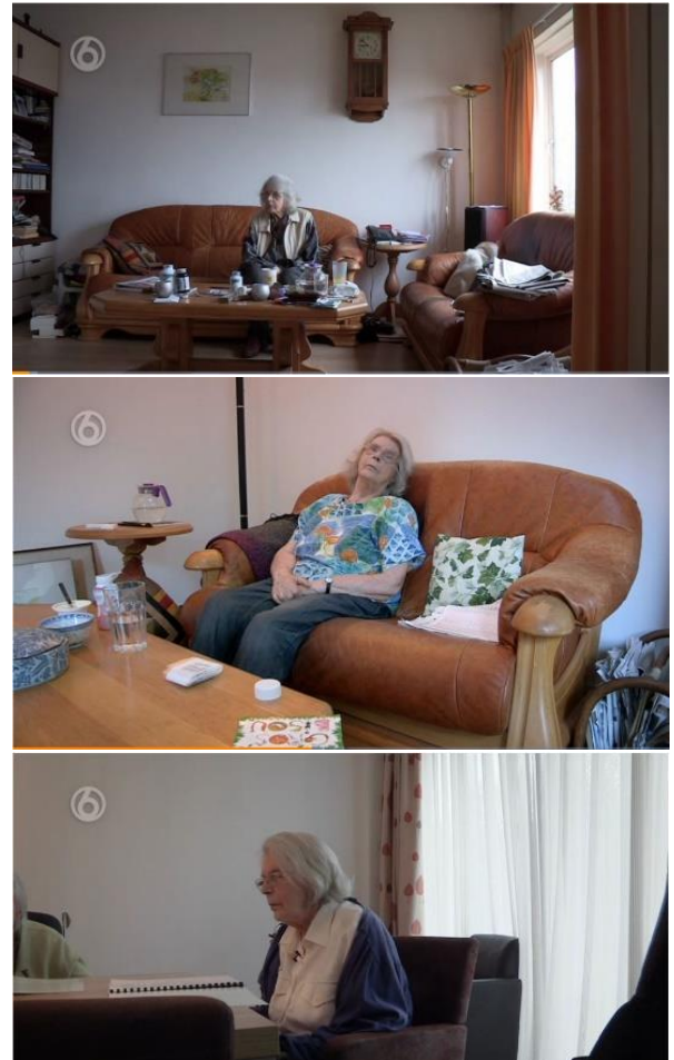
Figuur 3: Verloop in mise-en-scène – shot A1.4., shot D17.2. en shot K36.5.

Daarnaast worden de positieve plotontwikkelingen ook benadrukt door verandering in de kleding, wat ook te zien is in figuur 3. In de eerste sequentie draagt mevrouw Breed alleen grijstinten, waarbij ze in de meeste scènes dezelfde zwarte trui draagt. Het lang dragen van dezelfde kleding wordt ook door de thuiszorg benoemt als een van de hygiëneproblemen bij het alleen wonen, hierbij is de mise-en-scène dan een demonstratief bewijsmiddel. 123 In de tweede sequentie draagt mevrouw Breed voornamelijk een lichtblauwe blouse met patroon, wat zorgt voor een meer kleurrijke mise-en-scène. Waardoor een positievere sfeer wordt geïmpliceerd bij de resultaten van de eerste oplossing. In de laatste sequentie is de meeste variatie in de kleding van mevrouw Breed, waarbij de kleur paars nieuw