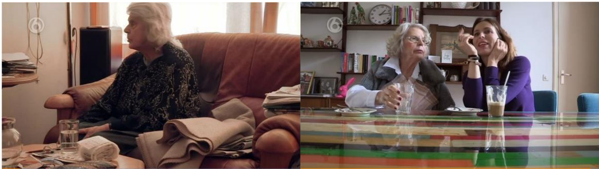
Figuur 4: Contrast in uiterlijk – shot A4.4. en shot K35.2.

Het uiterlijk van mevrouw Breed wordt dus als demonstratief bewijsmiddel ingezet voor de positieve ontwikkelingen in het narratief. Hierbij wordt ook een contrast weggezet tussen het begin en eind, te zien in figuur 4. Het aantonen van de problemen bij het ouder worden, wordt als doel genoemd in het begin van de film. 124 Dit wordt onder andere ondersteund met de donkere kleding van mevrouw Breed. Vervolgens benoemt Heleen haar einddoel in scène K35: “Ik wil ook laten zien dat het op zich best goed met je gaat. Dus dat het niet alleen maar ellende is”. 125 In die scène ziet mevrouw Breed er verzorgd uit, haar haren zijn geknipt en gekruld en ze heeft nagellak en lippenstift op, wat als demonstratief bewijsmiddel dient voor het einddoel van de film en daarmee een narratieve afsluiting bevordert.