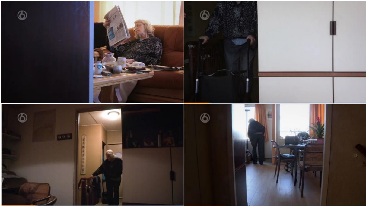
Figuur 5: Licht/donker contrast – boven: shot A2.7. en shot A6.2. onder: shot A7.7. en shot A8.4.

Doordat de camera vrijwel altijd een straight-on angle heeft, komt het niet voor dat er letterlijk wordt op- of neergekeken naar bepaalde personen. Daarnaast staat de camera voornamelijk stil en zijn enkele scènes met de hand gefilmd, zoals scène D18 waarin mevrouw Breed de krant wil ophalen en ze met haar stok door de tuin van Heleen loopt. Hierbij draagt de camerabeweging bij aan de onrust en verwarring die mevrouw Breed op dat moment ervaart, omdat ze denkt dat ze nog de trap af moet. Ook legt het gebruik van (medium) close-up hierbij de nadruk op de angst en verwarring in de gezichtsuitdrukking van mevrouw Breed, zoals afgebeeld in figuur 6. Hierdoor wordt de onrust en angst veroorzaakt door de cognitieve achteruitgang in deze scène benadrukt. Wat als framing device gezien kan worden voor het frame ‘scheiding lichaam/geest’, aangezien de nadruk ligt op het verval van de mentale capaciteiten. 127