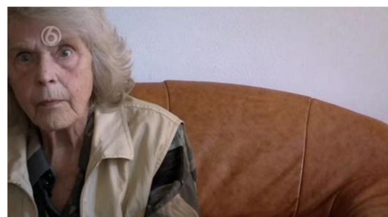
Figuur 7: lege blik, shot A9.6.

Net als in figuur 6 wordt er ook in figuur 7 gebruik gemaakt van een medium close-up om de blik van mevrouw Breed centraal te stellen. Mevrouw Breed geeft in die scène aan dat ze het leven zat