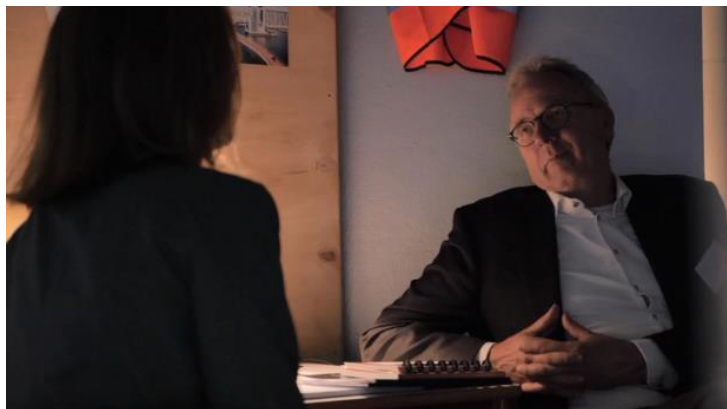
Bron: Menno Bakker, 23 mei 2018

"Het is goed om eens door de ogen van de andere partij te kijken. Ook op het alledaagse werk moet je dit kunnen doen. Dat is essentieel bij landmaken, om zo verschillende belangen te kunnen verbinden".