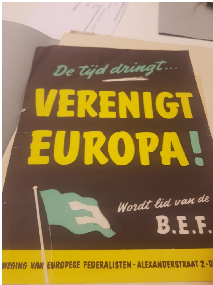
Afb. 2: De tijd dringt, wordt lid van de B.E.F. 23