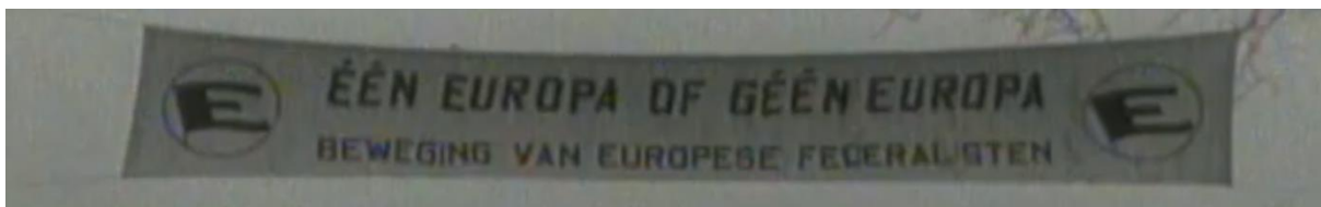
Afbeelding 10 63