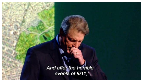
Afbeelding 7: Al Gore lijkt emotioneel (1:00:35)

Behalve zijn handen maakt Gore ook veel gebruik van zijn gezicht. Op momenten dat hij emotie bij het publiek uitlokt komt dit vooral tot zijn recht. Gore maakt op strategische wijze een serieus of angstig gezicht als hij spreekt over verschrikkelijke gevolgen, die het broeikaseffect met zich meebrengt. Door eerst zelf deze emotie aan te nemen, hoopt hij dat het publiek hier sneller in meegaat. Een goed voorbeeld hiervan doet zich voor tijdens het doemscenario. Hierin brengt Gore de vliegtuigramp van 11 september 2001 naar voren. Hierbij pauzeert hij een moment en legt hij zijn hand over zijn mond. Gore doet hiermee een duidelijke uiting van pijn en verdriet, alsof hij tranen moet wegslikken. Dit is te zien in Afbeelding 7 . Hiermee benadrukt hij de emotie die hij op het publiek wil projecteren.