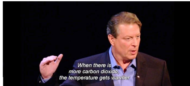
Afbeelding 6: Handgebaar voor nadruk (22:11)

Behalve zijn handen maakt Gore ook veel gebruik van zijn gezicht. Op momenten dat hij emotie bij het publiek uitlokt komt dit vooral tot zijn recht. Gore maakt op strategische wijze een serieus of angstig gezicht als hij spreekt over verschrikkelijke gevolgen, die het broeikaseffect met zich meebrengt. Door eerst zelf deze emotie aan te nemen, hoopt hij dat het publiek hier sneller in meegaat. Een goed voorbeeld hiervan doet zich voor tijdens het doemscenario. Hierin brengt Gore de vliegtuigramp van 11 september 2001 naar voren. Hierbij pauzeert hij een moment en legt hij zijn hand over zijn mond. Gore doet hiermee een duidelijke uiting van pijn en verdriet, alsof hij tranen moet wegslikken. Dit is te zien in Afbeelding 7 . Hiermee benadrukt hij de emotie die hij op het publiek wil projecteren.