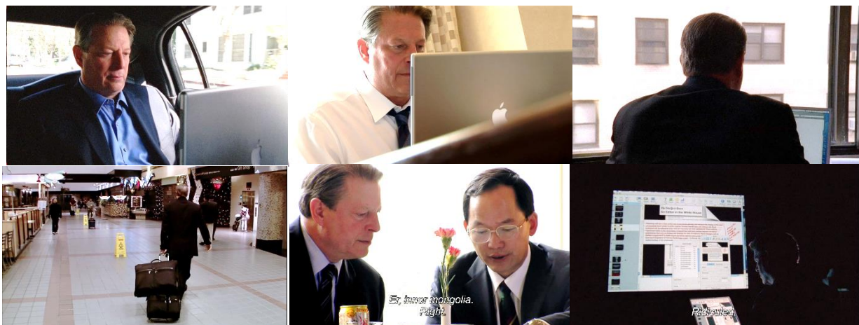
Afbeelding 3: Shots van Al Gore (v.l.n.r. 1e rij: Sequenties 3, 7 en 16; 2e rij: Sequenties 23, 28 en 34)

Behalve binnen de cinematografie is ook in de mise-en-scène goed te merken dat deze documentaire niet alleen over het broeikas-effect, maar ook over Al Gore zelf gaat. Veel shots van de presentatie laten Gore zien die voor het projectiescherm staat. Dit zorgt niet voor een betere informatie overdracht, maar wel voor de bouw van autoriteit van het karakter van Al Gore. Tijdens de scènes die buiten de presentatie gefilmd zijn, komt dit ook opvallend terug. We zien erg veel shots die benadrukken dat Gore aan het werk is aan zijn presentatie of onderweg is naar 'belangrijke' besprekingen. Enkele voorbeelden zijn te zien in Afbeelding 4 .