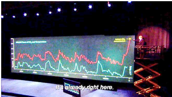
Afbeelding 8: Gore op schaarlift (23:15)

meer op het scherm past. Hier wordt vervolgens een van de coulissen boven het scherm voor omhoog gedaan, zodat de grafiek zijn stijgende lijn kan vervolgen. Dit is te zien in Afbeelding 8 en Afbeelding 9 .