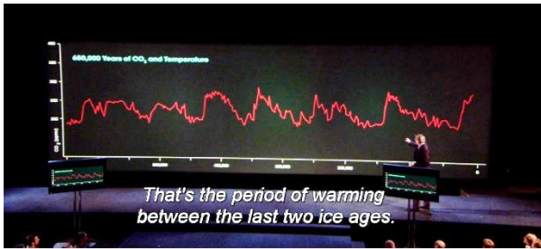
Afbeelding 5: Al Gore wijzend naar grafiek (21:08)

Afbeelding 6 , waar Gore zijn hand van beneden naar boven beweegt om nadruk op een stijgende temperatuur te leggen.