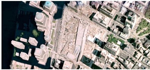
Afbeelding 2: Overstroming ingezoomd (1:00:45)

uitgezoomd. Deze zoom benadrukt hoe groot de omvang van deze ramp zou zijn, en ondersteunt het emotionele argument. Dit voorbeeld is weergegeven in Afbeelding 2 en Afbeelding 3 .