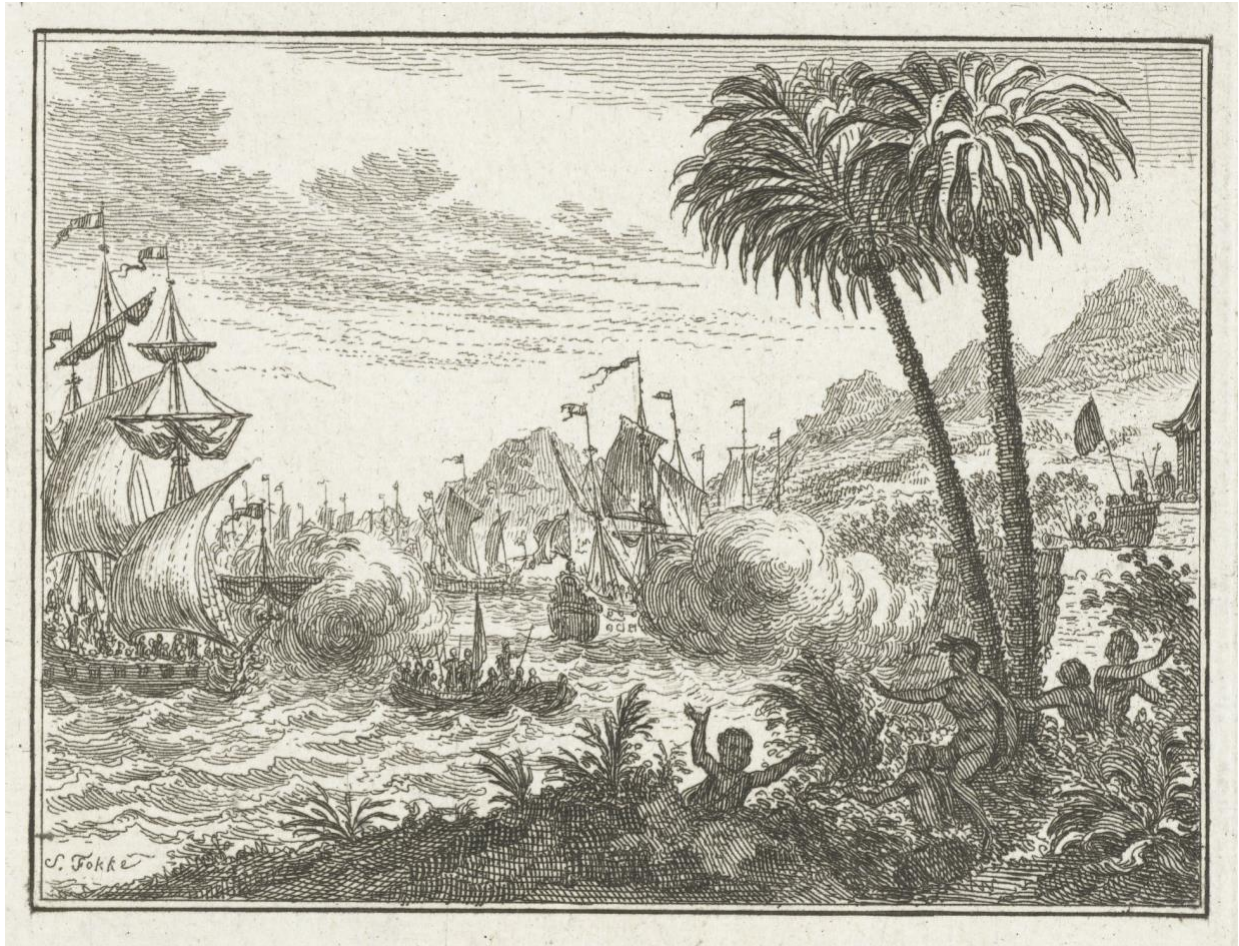
Verovering van Ambon, 1606 1

Religieuze tolerantie onder de VOC op het eiland Ambon in de zeventiende eeuw