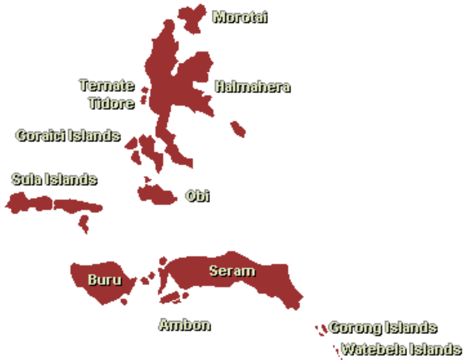
Afbeelding 2 Map of Maluku, indahnesia.com, http://indahnesia.com/indonesia/MAL/maluku_information.php .