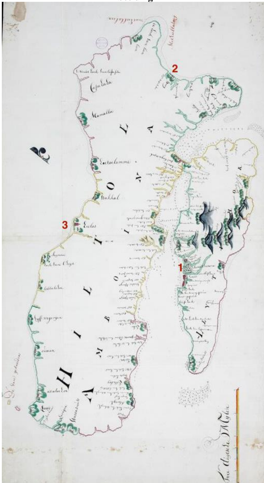
Afbeelding 1 Kaartenmaker onbekend, 'Kaart van het eiland Ambon', 1700-1750, http://www.atlasofmutualheritage.nl/nl/Kaart-eiland-Ambon.6321 .

1: Ambon stad/fort Victoria, 2: Waay, 3: Hila.