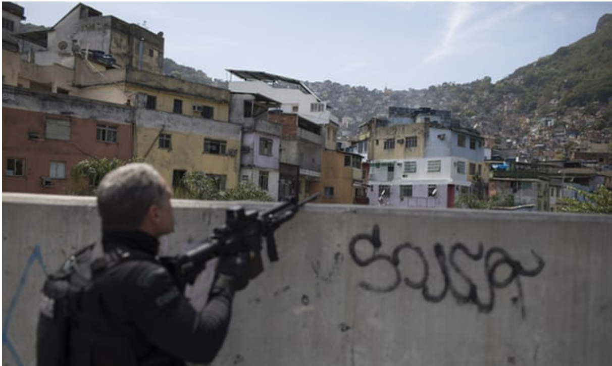
Afbeelding 1 Een agent tijdens de inval in Rocinha afgelopen september 2017.