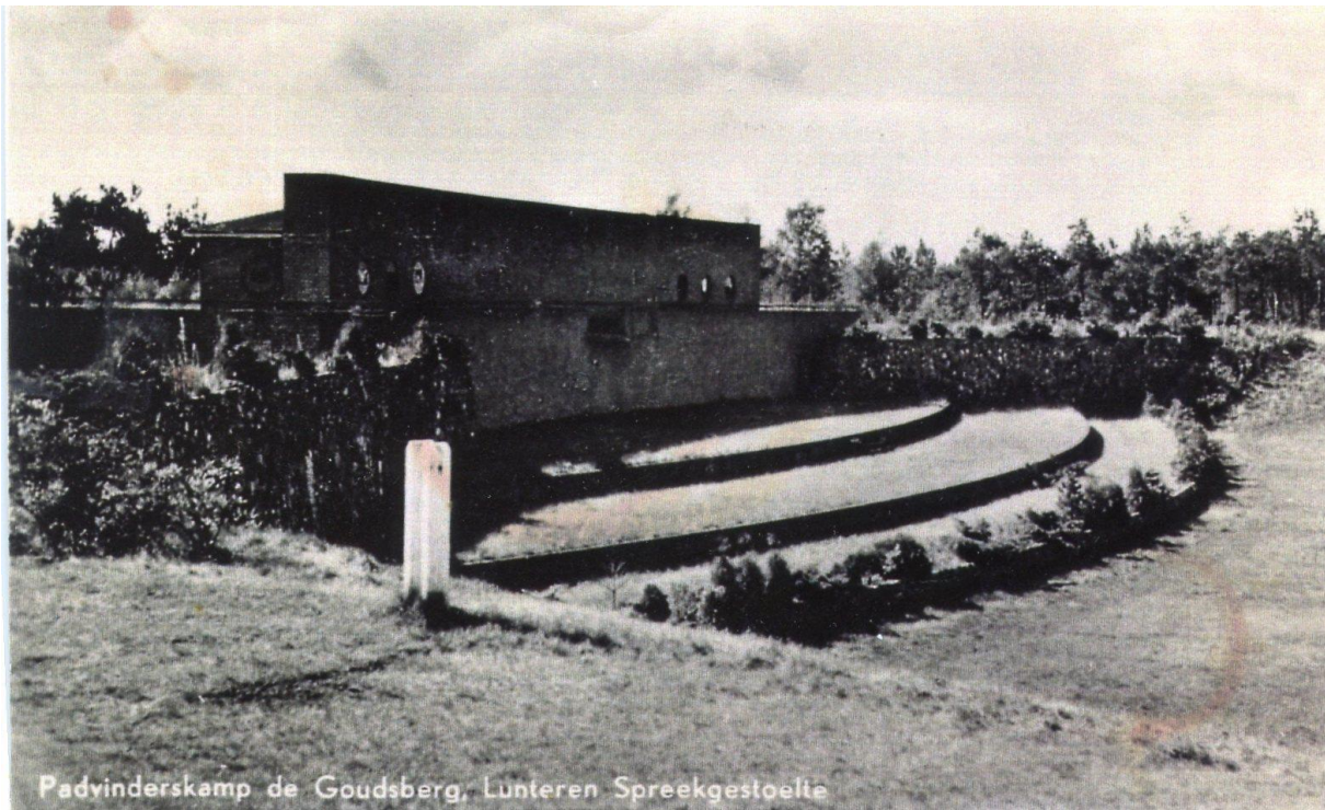
Foto van de muur van na de oorlog, opschrift luidt: 'Padvindskamp de Goudsberg, Lunteren Spreekgestoelte'.

voor de oorlog grond was van de NSB. In 1947 schreef De Tijd over de bijeenkomst van het Rode Kruis het volgende: 'Op de plaats, waar eens Mussert aan Göring een enorme klok aanbood als dank voor de prestaties van zijn luchtmacht, wordt nu gemanifesteerd voor de naastenliefde en hulp aan allen, die door rampen zijn of worden getroffen'. 23 Het Limburgsch dagblad schreef in 1948 over de Kampoelan: 'Om kwart voor zes stroomden de tentenkampen leeg en begaf een ieder zich naar de grote vergaderplaats, waar eens Mussert en zijn trawanten tezamen kwamen en de runen-tekeens het terrein markeerden, doch waar nu het teken des kruises stond opgericht'. 24