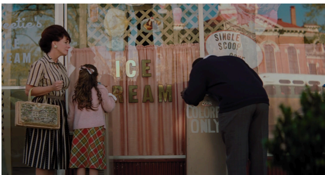
Afbeelding 17: Waterfontein in de stad