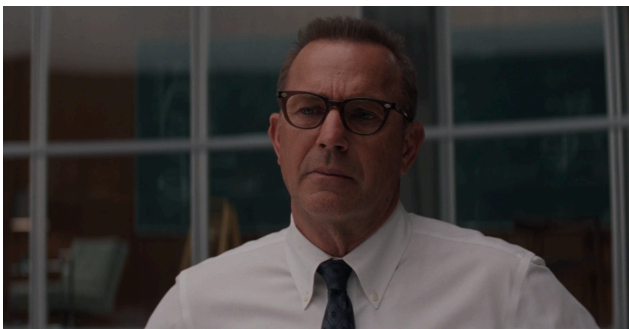
Afbeelding 5: Reactie van AI, scene 18