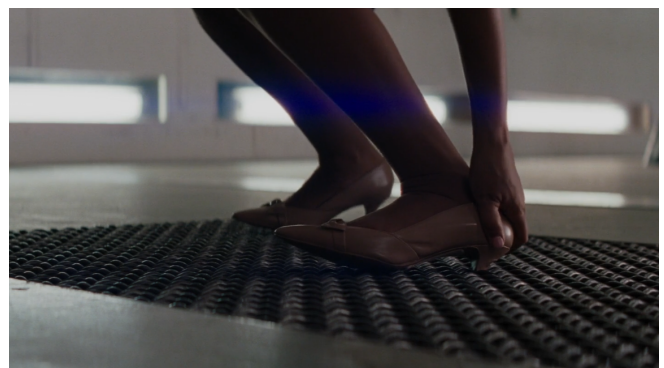
Afbeelding 14: Mary die met haar hak vastzit en deze los probeert te wrikken