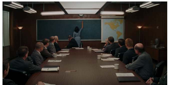
Afbeelding 28: Katherine die 'boven' de blanke gepositioneerd staat