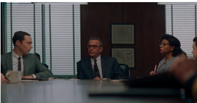
Afbeelding 27: Positie van de camera op tafel

Het opvallende aan deze shots in de scene is dat het camerawerk hetzelfde is als in scene 18. De focus is constant op haar gericht als zij haar berekeningen uitlegt met constante cuts naar de andere blanke personages die vol verbazing kijken hoe snel zij dit uit haar hoofd berekent. Ook hier begint het met een close up die langzaam inzoomt op de personages en de camera glijdt als het ware over de tafel naar haar toe (afbeelding 27). Daarbij staat zij hier ook weer boven de blanke personages gepositioneerd wat goed terug te zien is in afbeelding 28.