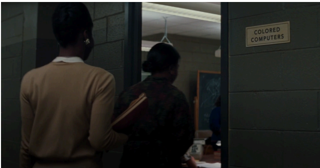
Afbeelding 15: 'Colored Computers' in de West Computing Building

Er zijn verschillende vormen van discriminatie op basis van etniciteit in die in de film naar voren komen. Allereerst zal er gefocust worden op de mise-en-scene van de film. Er zijn regelmatig momenten in de mise-en-scene waar de nadruk wordt gelegd op het feit dat bepaalde secties voor de gekleurde personen die bij NASA zijn. Ruimtes voor de gekleurde werknemers worden aangegeven met 'colored only'. Deze shots zijn vaak wat langer waardoor de focus meer gelegd wordt op deze bordjes en de constante scheidingen van gekleurd en blank. De afbeeldingen 15 tot en met 18 zijn screenshots van deze shots in de film. De koffiepot op afbeelding 8 bij de Space Task Group was er in het begin niet maar werd door de medewerkers daar neergezet voor Katherine ook al is zij de enige gekleurde vrouw in het kantoor. Dit zijn allemaal kleine algemene momenten die dus regelmatig in de film voorkomen.