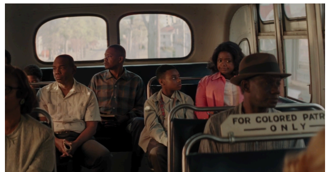
Afbeelding 18: Afzetting voor 'coloreds' achterin de bus