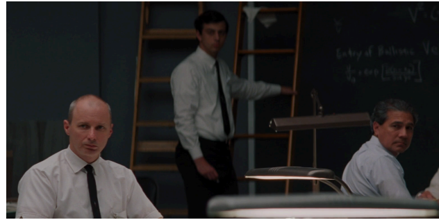
Afbeelding 8: Reactie van de 'overige' blanke mannen, scene 18 (2)