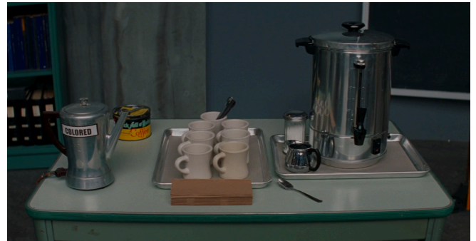
Afbeelding 16: De koffiepot die voor Katherine is neergezet bij de Space Task Group