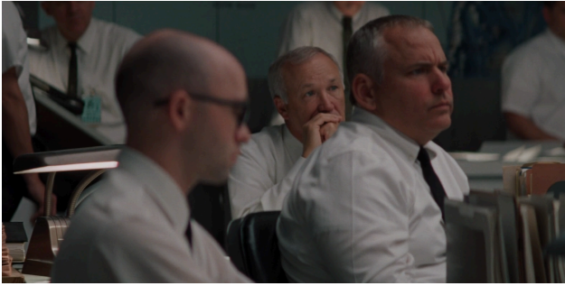
Afbeelding 2: Reactie van de 'overige' blanke mannen, scene 18 (1)