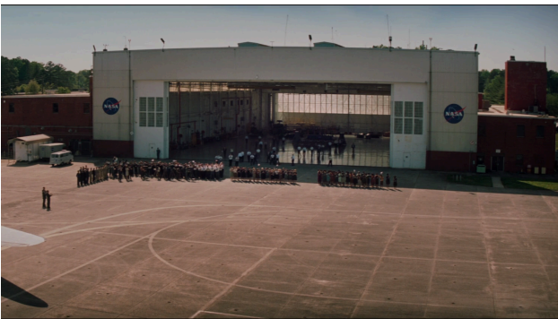
Afbeelding 19: Scene 11 waar de astronauten opgewacht worden door alle medewerkers van NASA

Een ander voorbeeld van de scheiding tussen gekleurd en blank is goed te zien in scene 11 als alle medewerkers van NASA de astronauten opwachten. Alle medewerkers staan in rijen opgesteld met een opvallende scheiding. Allereerst zien we de blanke mannen in een rij staan en vervolgens daar vlak naast de blanke vrouwen. De rij eindigt met de gekleurde vrouwen maar er is wel een groot gat gecreëerd tussen de blanke en gekleurde vrouwen. De gekleurde vrouwen staan ver gescheiden van de rest, terwijl de blanke vrouwen veel dichterbij de blanke mannen staan. Deze scheiding is goed te zien in de afbeeldingen 19 en 20. Met het camerawerk wordt hier ook extra de nadruk opgelegd doordat het een wat langer shot is waar de camera langs alle medewerkers gaat.