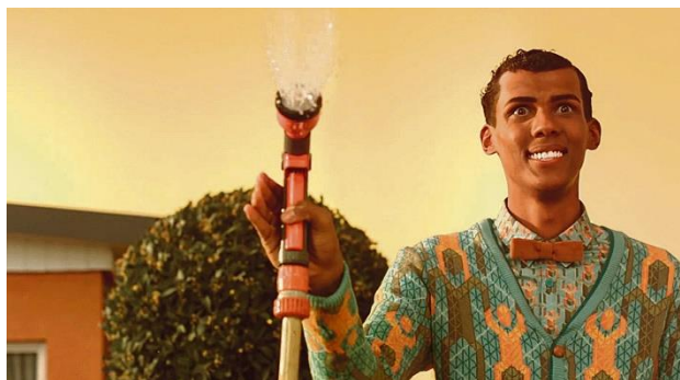
Image : Clip Papaoutai , 2013. 95

La chanson Papaoutai parle aussi des espoirs, cette fois des espoirs des pères. Le clip 94 montre un garçon et son père qui habitent ensemble. Stromae joue le rôle du père ; or ce père n'est pas une véritable personne mais une sorte de poupée qui ne bouge pas et ne parle pas (voyez l'image). Il voit d'autres garçons avec leurs pères, et il semble jaloux. Un moment donné, le fils commence à se fâcher, il chante à son père les paroles de la chanson. A la fin du clip, le