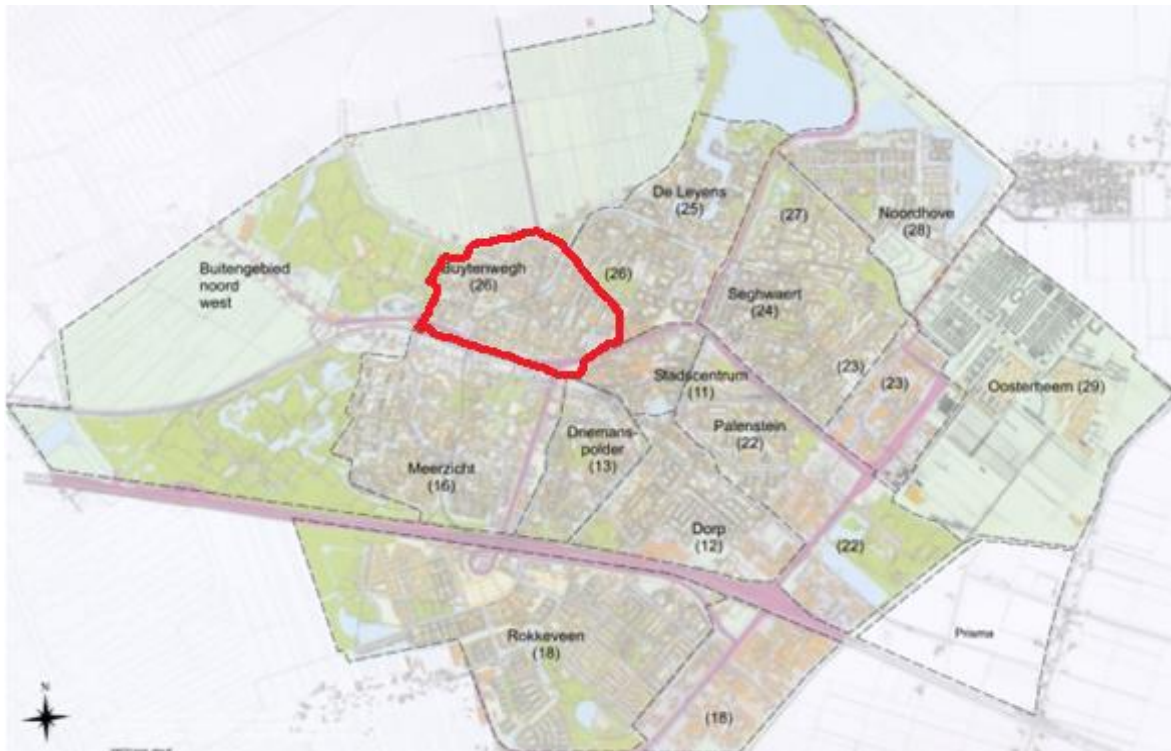
Afbeelding 1.1: Topografische weergave van Zoetermeer - wijk Buytenwegh in rood ([wijkenkaart Zoetermeer], z.j.).

In de wijk Buytenwegh (zie Afbeelding 1.1) wonen 10.188 mensen (voor het wijkprofiel, zie bijlage IV). Een grove indeling van de wijk is te maken in twee buurten, die van elkaar worden gescheiden door de Randstadrail. De buurten verschillen op veel vlakken van elkaar, bijvoorbeeld in sfeer, bebouwingsdichtheid en hoeveelheid groen.