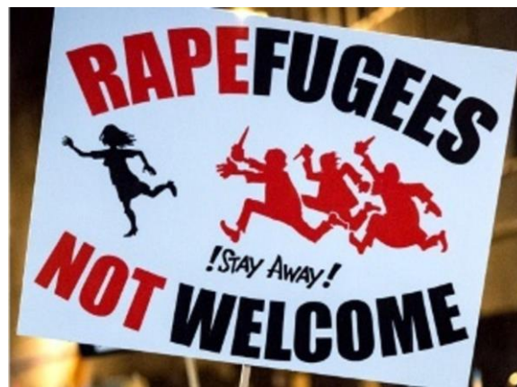
Figuur 2 PEGIDA's variatie op de leus "Refugees Welcome"

Niet alleen vormen deze op geld belust jongemannen een bedreiging voor de Hollandse portemonnee, maar ook voor de Nederlanders zelf. Deze “jonge honden”, die niet geremd worden door enige vorm van sociale controle, worden gezien als een seksueel en crimineel gevaar voor de samenleving en haar inwoners. Borden met daarop de tekst “ Rapefugees Not Welcome ” (zie figuur 2) geven aan hoe negatieve stereotypingen over de islam als een mannenreligie worden gekoppeld aan de vluchtelingen en hun morele kompas.