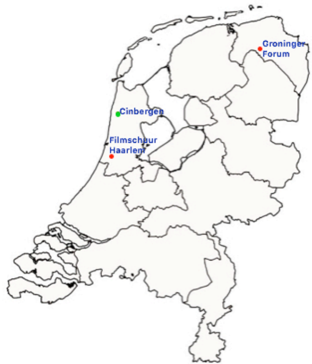
Afbeelding 3 Filmtheaters die klassiekers vertonen binnen een vast programma, voorzien van een inleiding.