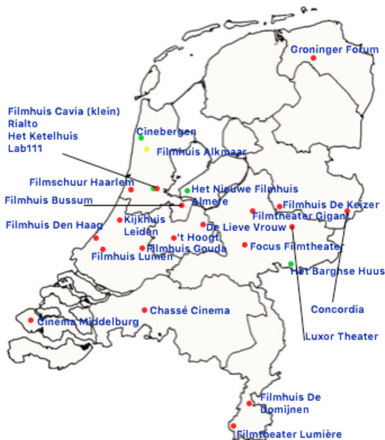
Afbeelding 1 Geografische verspreiding van filmtheaters die in februari 2017 klassiekers vertoonden.

Zoals hieronder is te zien, zijn de meeste filmtheaters die klassiekers vertonen gevestigd in Noord-Holland. 54 Van de acht filmtheaters in deze provincie die klassiekers vertoonden, zijn er vier gevestigd in Amsterdam. Met uitzondering van Friesland en Drenthe werden ook in alle andere provincies in februari 2017 klassiekers vertoond. In Flevoland, Zeeland en Groningen kon het publiek bij slechts één locatie terecht voor een klassieker: respectievelijk bij Het Nieuwe Filmhuis Almere, Cinema Middelburg en het Groninger Forum. 55 Slechts vier filmtheaters zijn de enige vertoningsplek in hun stad. Dit zijn Het Barghse Huus ('s-Heerenberg), Cinebergen (Bergen), Filmhuis Bussum en Cinema Middelburg. In alle andere plaatsen waar zich een filmtheater bevindt, zijn een of meer andere bioscopen en/of filmtheaters. Van de 26 filmtheaters vervullen er elf ook een of meer andere functies. De meest voorkomende is de combinatie van filmtheater en theater voor podiumkunsten; vijf theaters bieden zowel films als theaterproducties aan. Daarnaast zijn drie filmtheaters ondergebracht in een bibliotheek en hebben drie filmtheaters een expositieruimte voor tentoonstellingen. 56