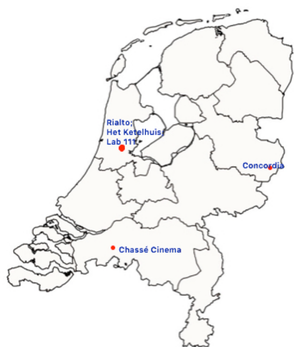
Afbeelding 7 Filmtheaters die klassiekers in een vast programma vertonen, zonder randprogrammering.