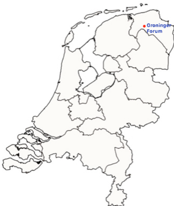
Afbeelding 6 Het Groninger Forum is het enige filmtheater dat in februari 2017 een filmklassieker in een tijdelijke reeks vertoonde, inclusief randprogrammering.