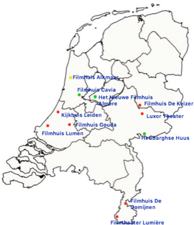
Afbeelding 2 Filmtheaters die klassiekers vertonen zonder verdere context.

Een andere manier om klassiekers te vertonen, is binnen een wekelijks of maandelijks terugkerend, vast programma. De films zijn daarbij voorzien van een inleiding. Deze programmeringspraktijk is te zien bij Cinebergen (4; Bergen), het Groninger Forum (20) en Filmschuur Haarlem (21). Daarbij is Cinebergen het enige kleine filmtheater, dat tevens ook geen andere functies vervult. Het Groninger Forum en Filmschuur Haarlem hebben beide meerdere zalen en vervullen beide meerdere functies: het Groninger Forum is tevens een bibliotheek, terwijl Filmschuur Haarlem ook theater aanbiedt. Zowel Cinebergen als het Groninger Forum vertoonden in hun vaste programma in februari 2017 films van Jarmusch. 63