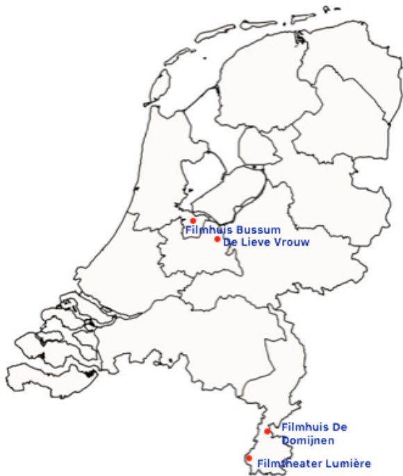
Afbeelding 4 Filmtheaters die klassiekers op incidentele basis vertonen, inclusief randprogrammering.