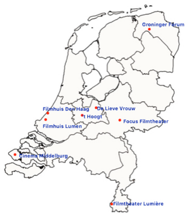
Afbeelding 5 Filmtheaters die klassiekers in een tijdelijke reeks vertonen, zonder randprogrammering.