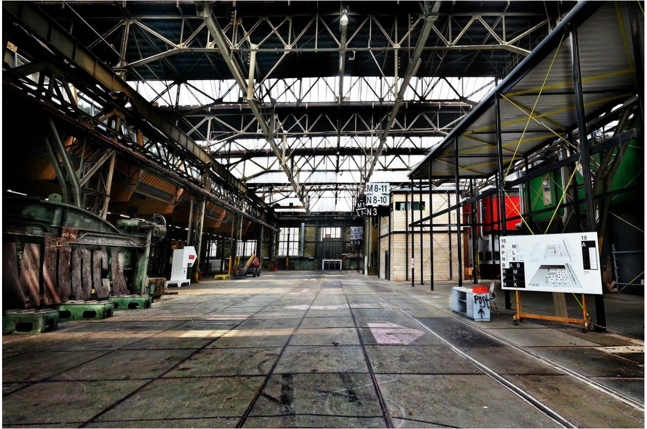
Figuur 4 - In de scheepsbouwloods (kunststad) – foto door Robert Jung.