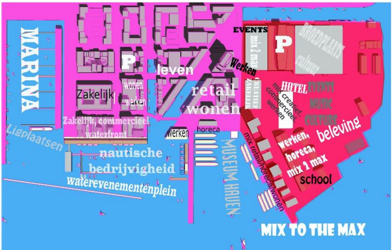
Figuur 5 - “mix to the max” – vroege toekomstvisie Biesterbos op NDSM-werf