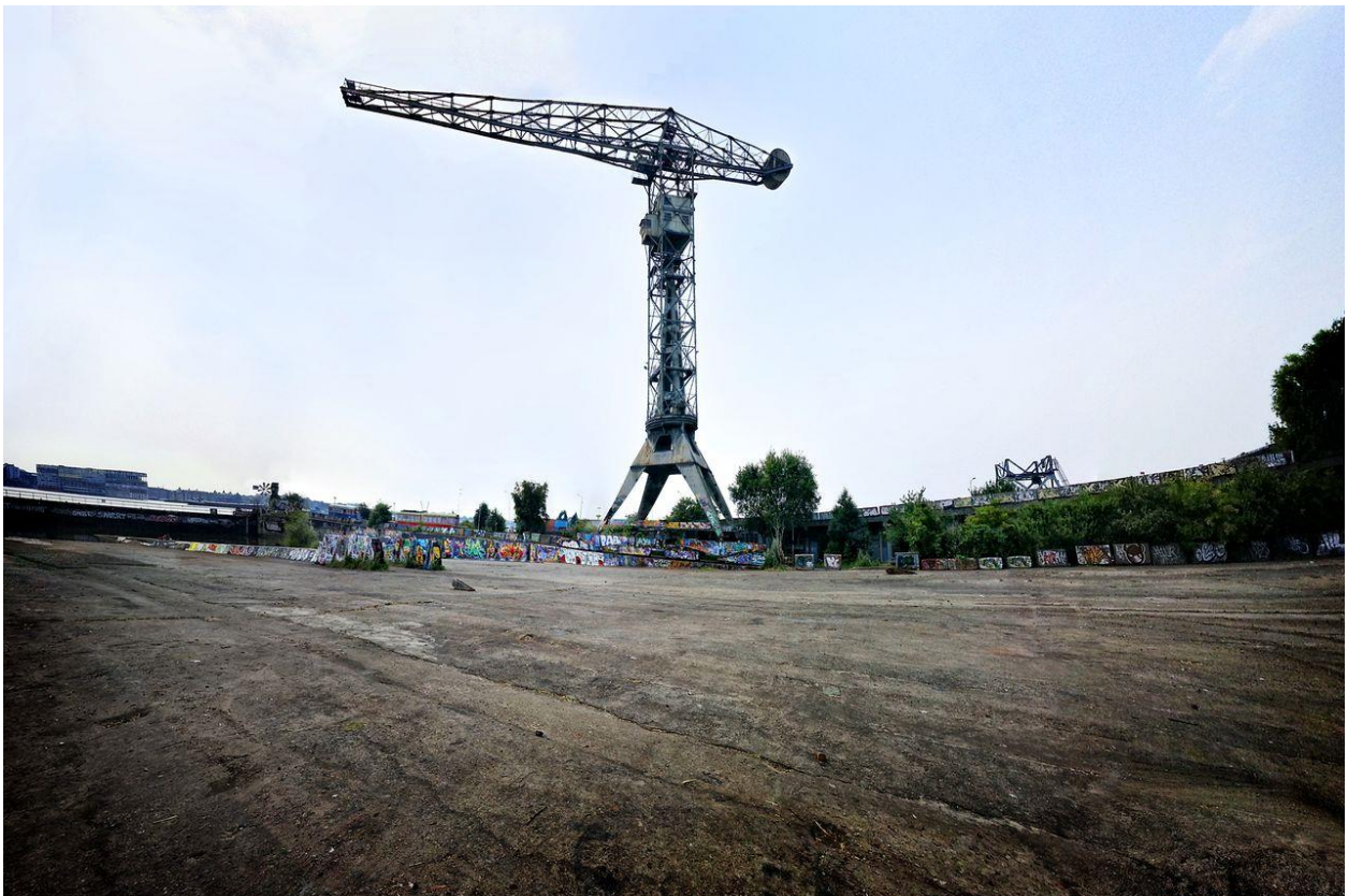
Figuur 3 - De kraan.