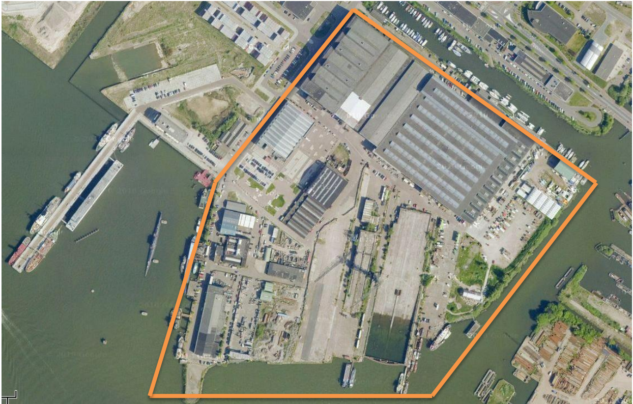
Figuur 2 - NDSM-werf Oost – via Google maps. (oranje afbakening is de NDSM-Werf Oost.)