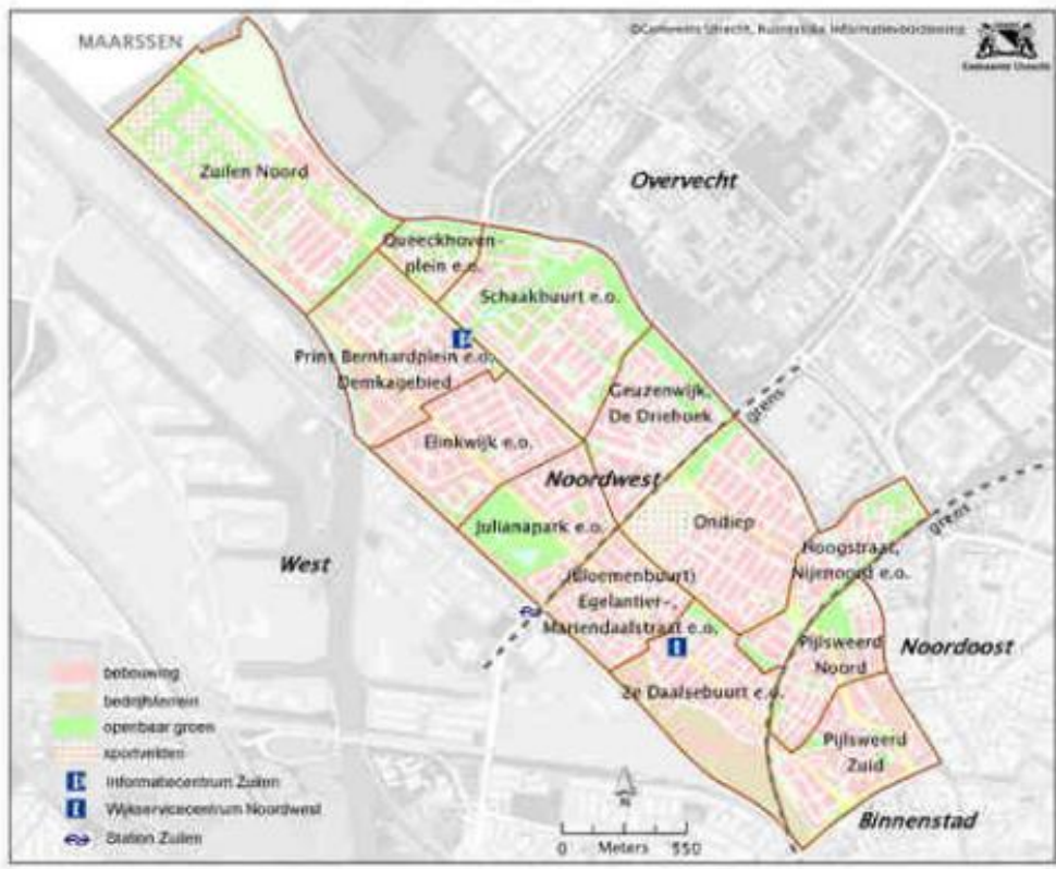
Subwijken en buurten van Noordwest

Bron: Wijkambities Noordwest 2014 – 2018