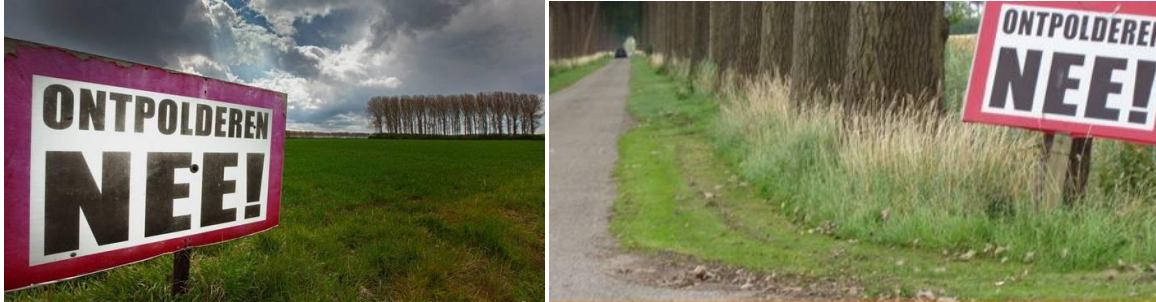
Afbeelding 4.8 & 4.9: Weerstand tegen ontpolderen