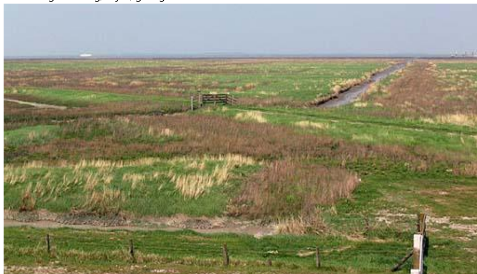
Afbeelding 4.6: Leeg, wijds, gras gebied