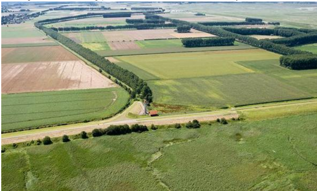
Afbeelding 4.10: Luchtfoto Hedwigepolder met de kenmerkende akkers en bomenrijen

zoveel verloren gaat en tekort aan voedsel is), welke veelal generaties lang bewerkt wordt. Dit wordt door de indianers gezien als kapitaalvernietiging. Door een indiener wordt gevraagd te reageren op de stelling 'wij ontpolderen, zij verhongeren'." Het ministerie benadrukt de beperkte gevolgen van het verlies aan landbouwgrond: "In totaal is er sprake van een verlies van 293 hectare landbouwgrond in de Hertogin Hedwigepolder, dit stemt overeen met 0,2% van de totale landbouwoppervlakte in de provincie Zeeland." "Relatief gezien is het oppervlak binnen de provincie zeer beperkt, wereldwijd is dat dan zeer zeker ook de situatie. Ten aanzien van de strijdigheid tussen het onttrekken van landbouwgrond en de concurrerendheid van Nederland, zoals beschreven in de Rijksstructuurvisie geldt dat de landbouw een van de economische sectoren is binnen Nederland. Door het landbouwflankerend beleid zoals in de eerste zienswijze binnen dit thema beschreven, wordt het effect van het project voor de Hedwigepolder op de economische concurrentiepositie van Nederland beperkt." (Ministerie van EZ & IenM, 2014, p. 61-63)