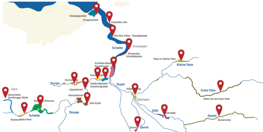
Kaart 4.3: Overzicht projecten Sigmoplan

werden de dijken niet alleen hoger en steviger gemaakt, maar kwamen er ook nieuwe overstromingsgebieden. De rivier krijgt de ruimte. Dit gaat samen met natuurontwikkeling. Natuur en veiligheid zijn de belangrijkste functies die het Sigmoplan ondersteunen. De overstromingsgebieden, ontpolderingen en wetland bieden kansen voor de natuur. "Het nieuwe Sigmoplan werkt aan een multifunctionele en duurzaam gebruikte Schelde. Zo ontstaat een robuuste en krachtige rivier, die niet alleen vandaag, maar ook morgen en overmorgen haar gebruiksfuncties met verve kan vervullen." (Sigmoplan, 2014b)