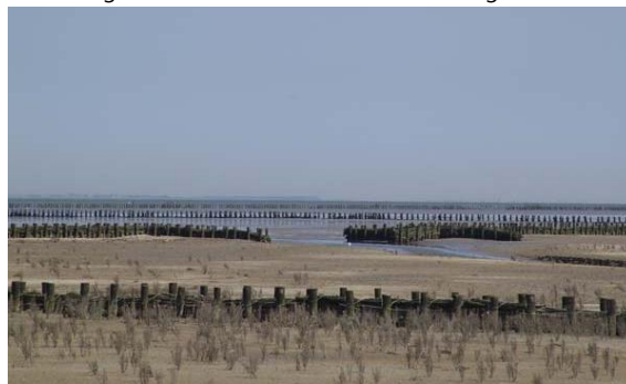
Afbeelding 4.5: Kwelderwerken als bescherming voor de zeedijk

Volgens de directeur van It Fryske Gea wordt het gebied Noord-Friesland Buitendijks gekarakteriseerd als een kustgebied, maar door mensen gemaakt. De kwelder is aangelegd door kwelderwerken, vroeger landaanwinningswerken genoemd. De kwelder is een natuurlijke rand die ook belangrijk is voor veiligheid, het beschermt de zeedijk. Het gebied heeft belangrijke natuur- en cultuurhistorische waarden: "Enorme groepen vogels zijn afhankelijk van het gebied. Ze gebruiken het gebied voor rust en voedsel. Daarnaast leven er specifieke plantensoorten." "Het landschap is uitgestrekt en open. De elementen die aanwezig zijn, zijn door de mens aangebracht zoals dobben en dijken." Voor de toekomst van het gebied is het veiligheidsaspect belangrijk voor It Fryske Gea: "De ontwikkeling is dat de zeespiegel omhoog komt. Het is een buitendijksgebied, deels kwelder en deels zomerpolder. Het verschil tussen het niveau van de zomerpolder en zeespiegel neemt toe. Als de zee geen toegang heeft tot de zomerpolder dan kun je het maaiveld niet meer laten stijgen. Dan is er geen natuurlijke bescherming meer. De randen van de Waddenzee zoals die er eeuwen geleden waren, zijn er bijna niet meer. Daarom zijn we bezig met het ontpolderen van de zomerpolders." Dit zijn de twee belangrijkste argumenten voor verkweldering: veiligheid en natuurkwaliteit. "Natuurontwikkeling is het doel, maar veiligheid is een goed argument".