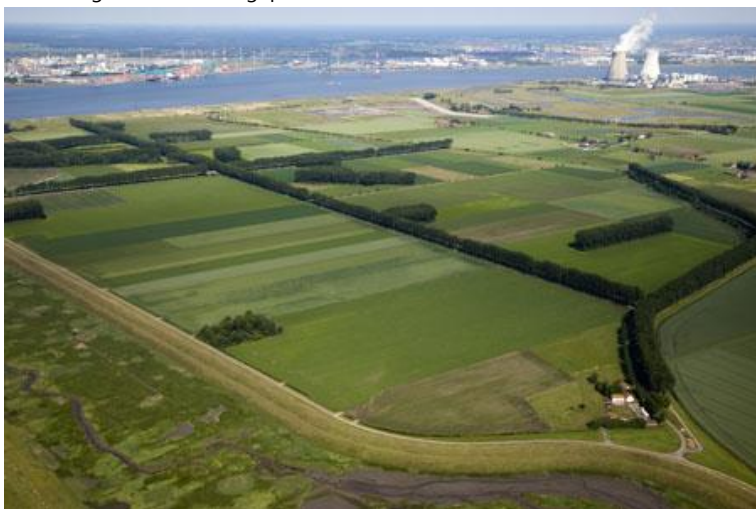
Afbeelding 4.11 De Hedwigepolder van bovenaf