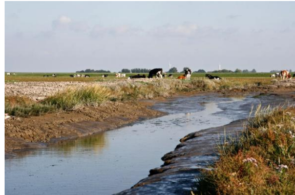
Afbeelding 4.4: Verkweldering

Ruim twee jaar later was de oorspronkelijke begroeiing van de zomerpolder al vrijwel verdwenen. De zoetwaterplanten hadden plaatsgemaakt voor zoutwaterplanten als zeekraal, schorrekruid en zeeaster. "Dit is veel eerder dan wij dachten" , aldus opzichte Albert Ferwerda van It Fryske Gea. Doordat het gebied niet meer intensief begraaasd en bemest worden zoals in het verleden, is er overlast van akkerdistel. It Fryske Gea probeert de overlast zoveel mogelijk te beperken aldus Ferwerda: "It Fryske Gea maait daarom drie tot vier keer per