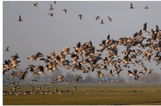
Afbeelding 4.3: Ganzen overlast

economische verandering. Ook zijn de boeren sceptisch over de uitstraling die een uitgestrekt natuurgebied buitendijks zal hebben op het binnenland (Leeuwarder Courant, 1999c). Door de afkeer van de boeren tegen de kwelderplannen werd de aankoop van land tegenwerkt. It Fryske Gea wilde 300 hectare buitendijksland van de Bildtpollen aankopen, maar het land werd verkocht aan een andere bidder. Deze ondernemer wil het gebied zijn agrarische functie laten behouden (Leeuwarder Courant, 1999d). Een jaar later moest de ondernemer het land echter weer verkopen aan It Fryske Gea, omdat hij geen kans zag een boerderij in de directe omgeving te kopen (Leeuwarder Courant, 2000e & Leeuwarder Courant, 2000f). De boeren begrijpen dat It Fryske Gea er is om over de natuur te waken, maar het steekt ze dat de natuurorganisatie het steeds meer voor het zeggen krijgt en beslag weet te leggen op vaak moeizaam in cultuur gebrachte grond. De boeren verwijten It Fryske Gea landhonger: "Landjepik" (Leeuwarder Courant, 1999e).