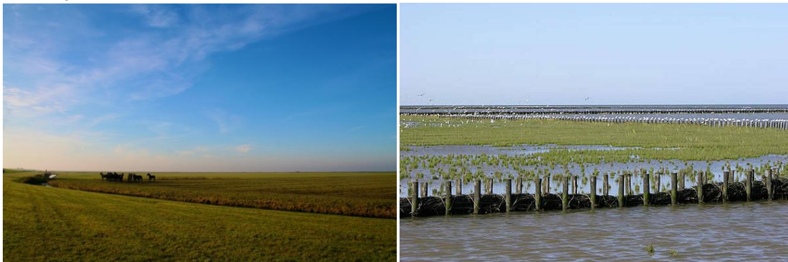
Afbeelding 4.1 & 4.2: Links de zomerpolders en rechts de kwelders