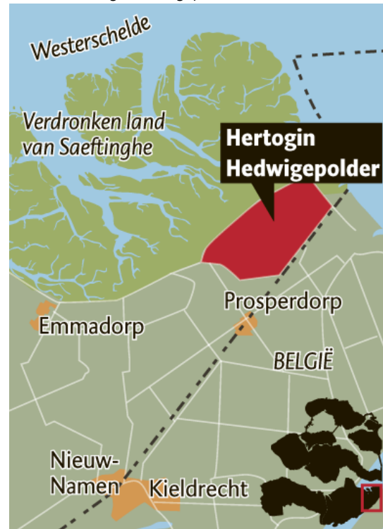
Kaart 4.4: Hertogin Hedwigepolder

In de PZC van 3 november 2012 wordt de Hedwigepolder als volgt omschreven: “De Hedwigepolder ligt er woensdag, de mooiste dag van de afgelopen week, vreedzaam bij. Een lekker herfstzonnetje schijnt. De populieren die de polder tekenen, zijn al bijna kaal. De bladeren liggen in de slagschaduw van de bomen over het land. Alleen het maïs moet nog worden geoogst. Twee boeren zijn aan het ploegen. De verse vette klei schittert in het licht.” (PZC, 2012d). De zeeklei, de populieren en het akkerland zijn kenmerken die de polder karakteriseren.