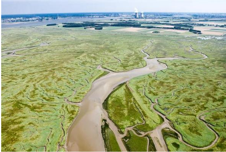
Afbeelding 4.12: Het Verdrongen land van Saefthinge met op de achtergrond de Hedwigepolder.