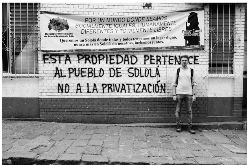
Figuur 3.1 Sololá, 8 April 2017 “ Dit bedrijf behoort toe aan het volk van Sololá. Nee tegen de privatisering”

Tijdens een van mijn hanging outs stuitte ik op een gebouw dat gesloten was door de municipalidad indigena :