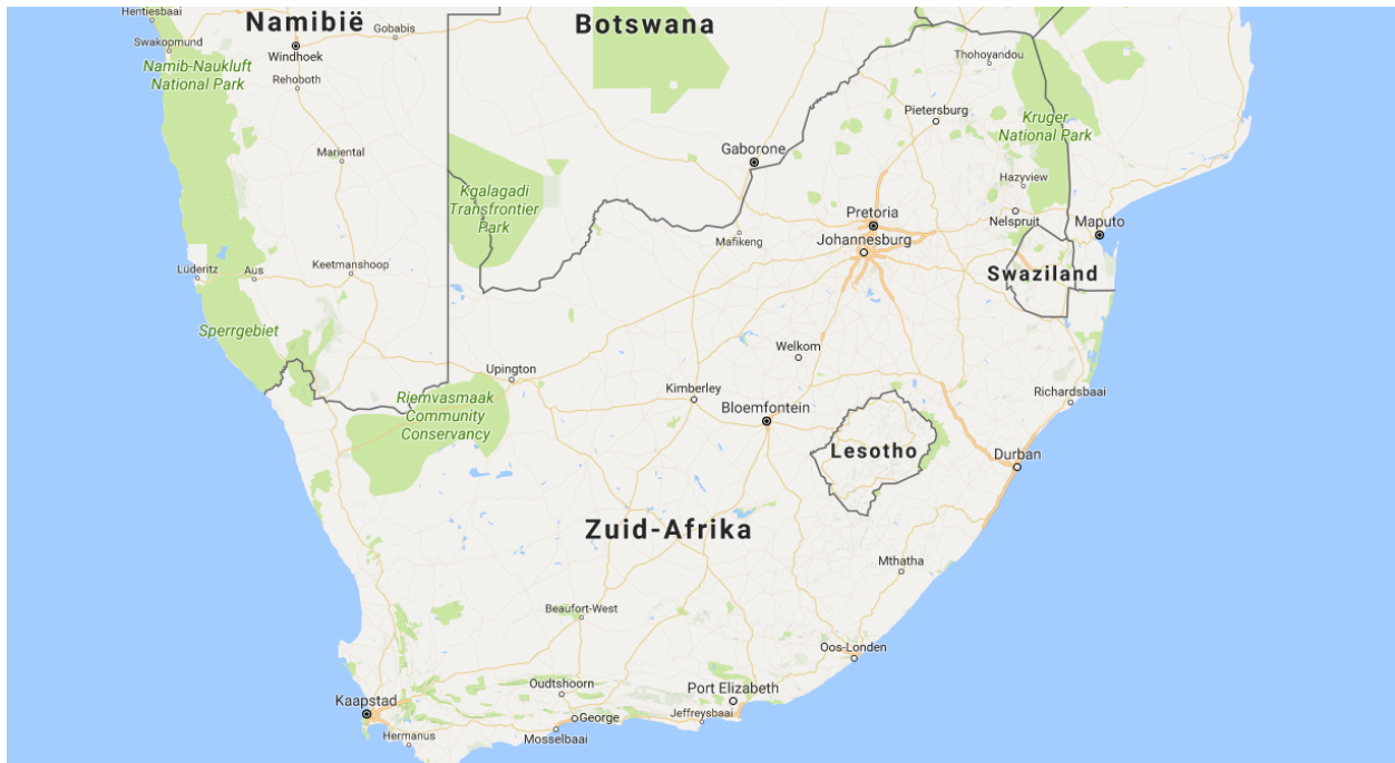
Afbeelding 2: Kaart van Zuid-Afrika met linksonder Kaapstad. Google maps. Google. Geraadpleegd op 24 juni 2017.